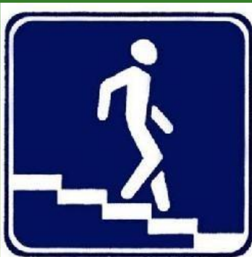
Подземный пешеходный переход