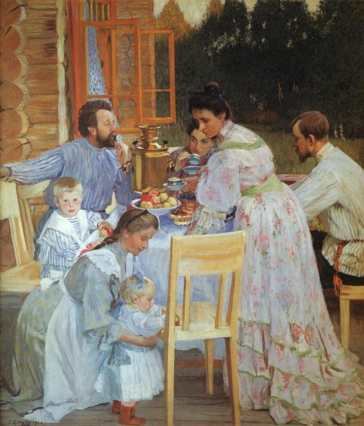
Кустодиев Борис. «На террасе»