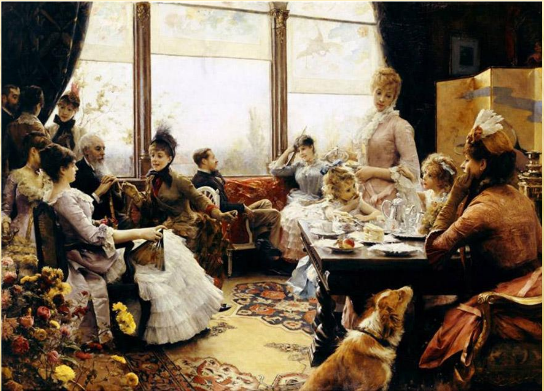
Юлий Леблан Стюарт «Пятичасовой чай»