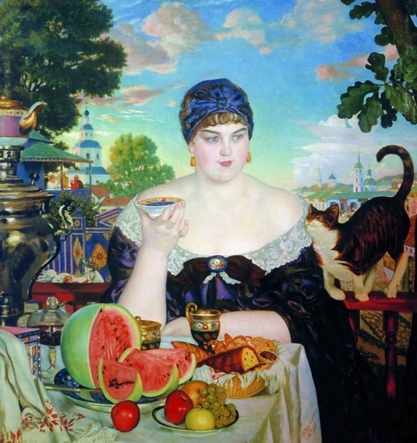
Борис Кустодиев. «Купчиха за чаем» 1918 г.