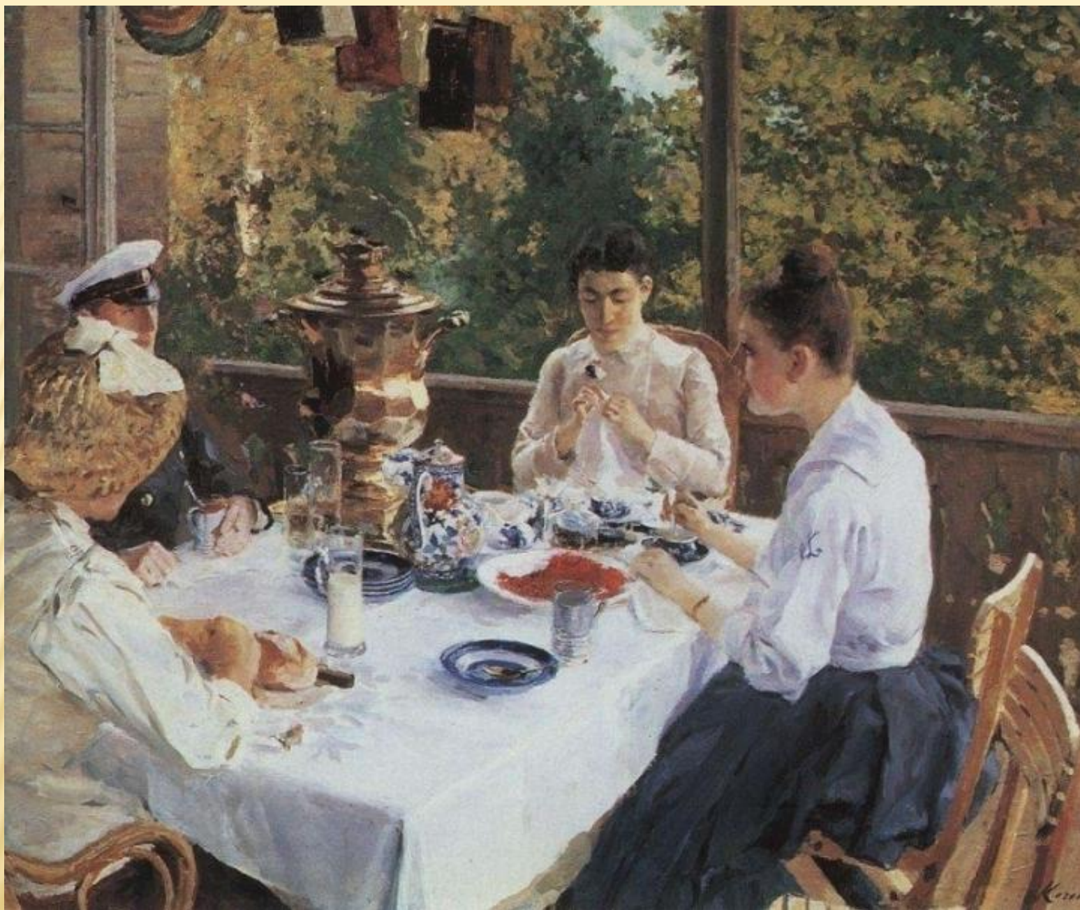
Константин Коровин «За чайным столом», 1888 год