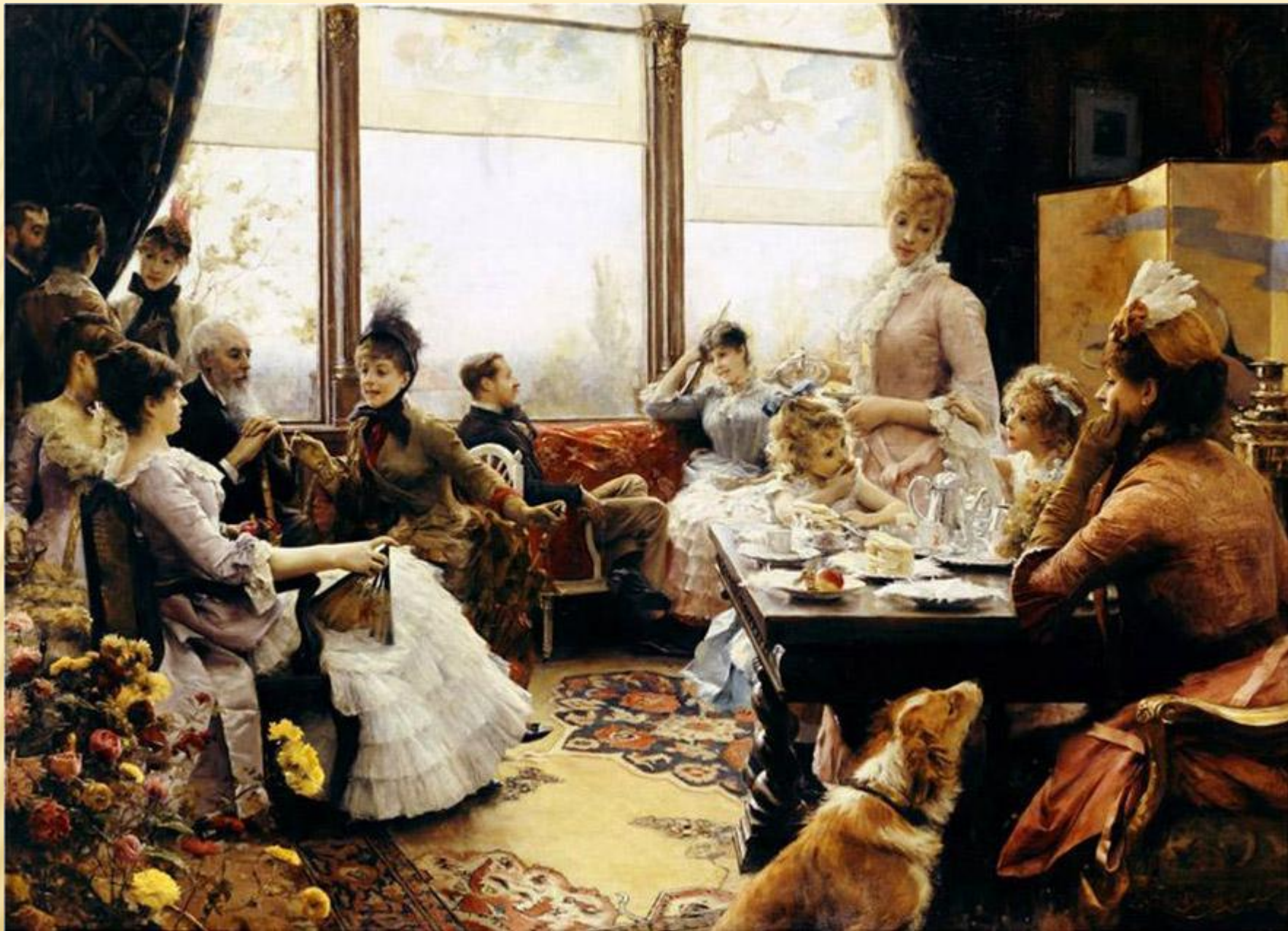
Юлий Леблан Стюарт «Пятичасовой чай»