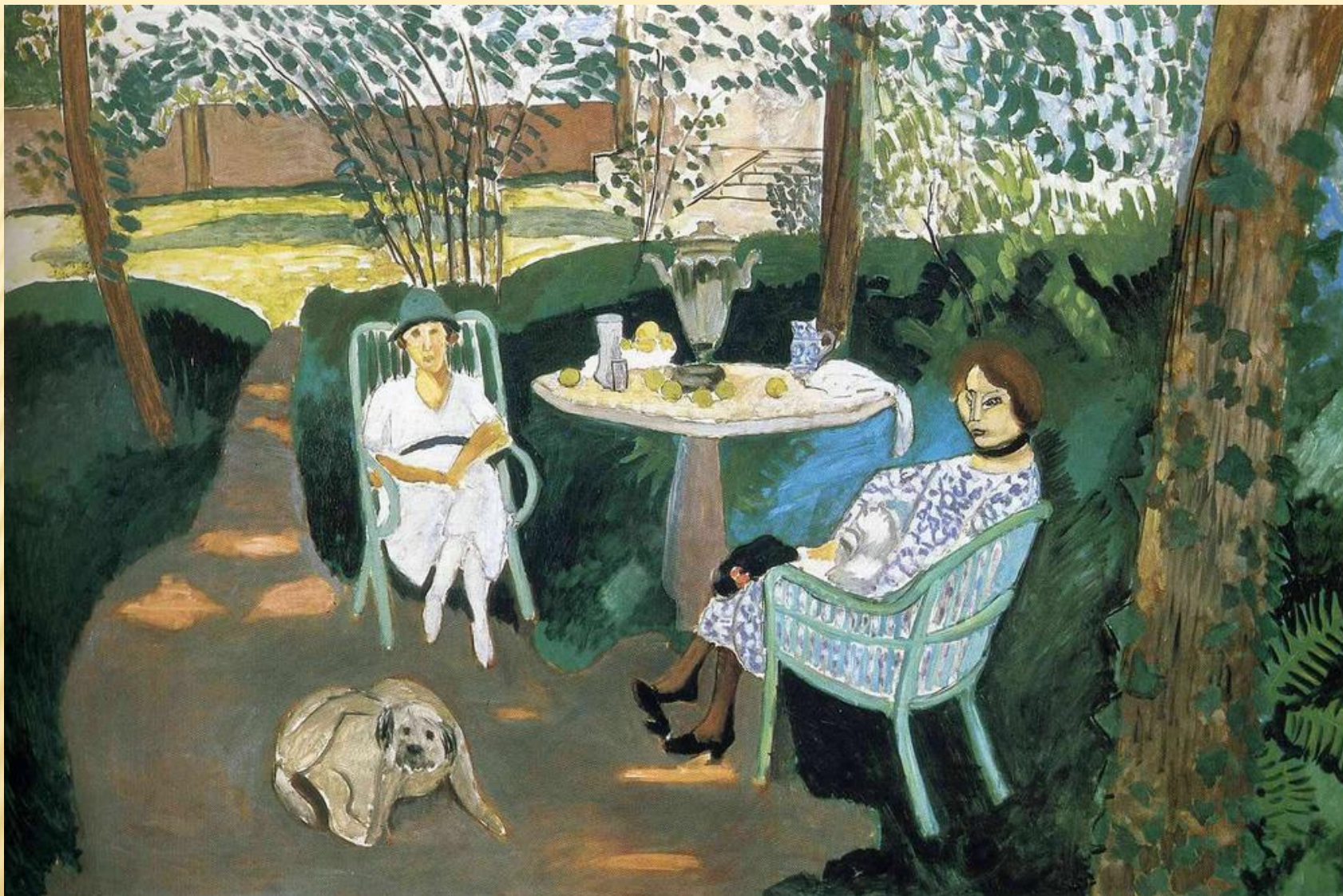
«Чай в саду», Анри Матисс