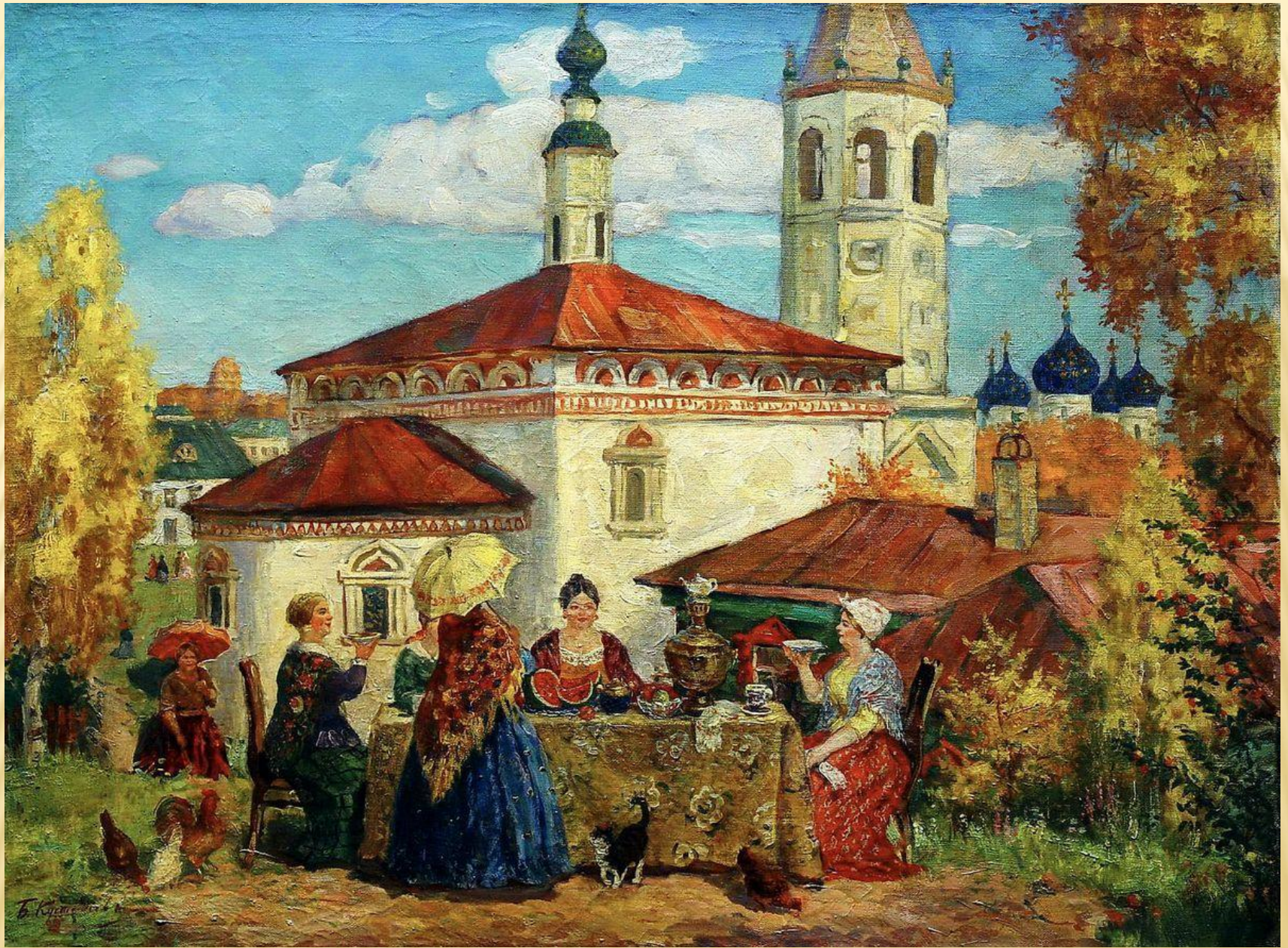
Кустодиев «Чаепитие в Мытищах»