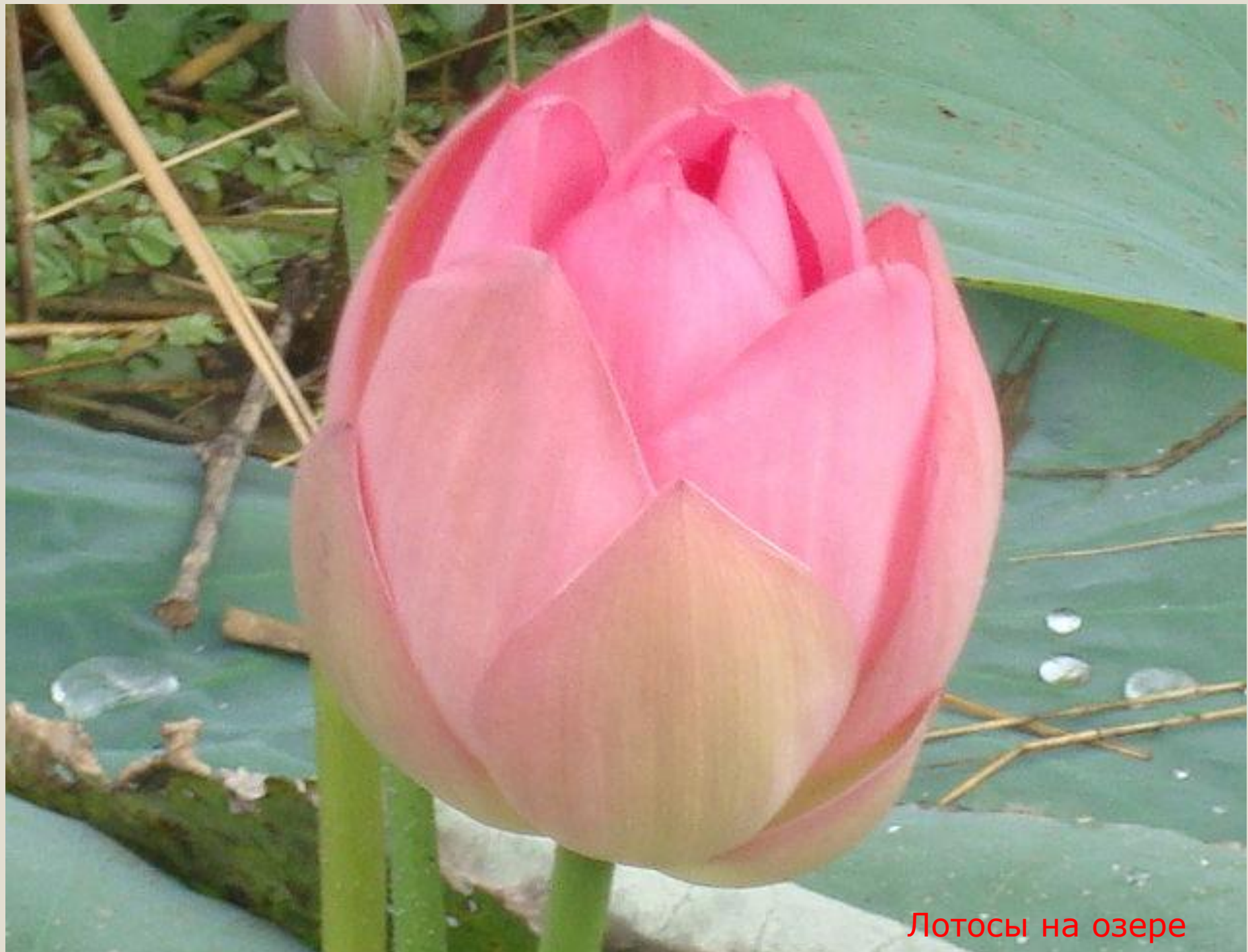
Лотосы на озере