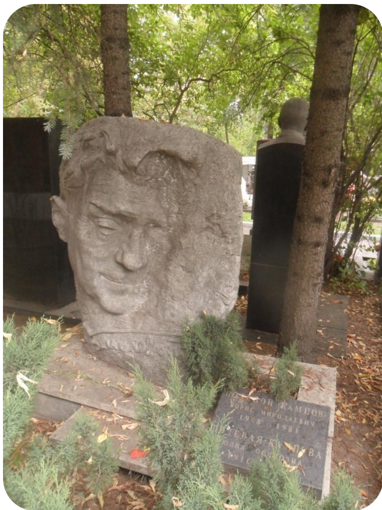
Могила Б.Н. Полевого на Новодевичьем кладбище Москвы