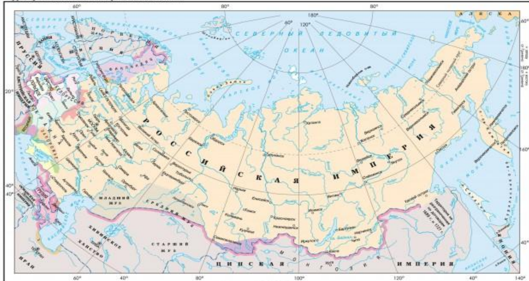
Масштаб 1:32 000 000