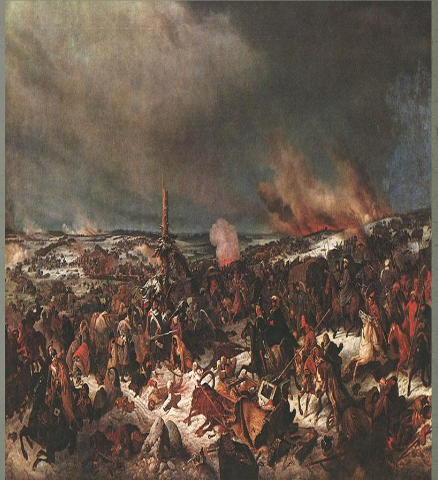
Отступление французов через Березину. Гесс, 1844 год

Попытка русской армии отрезать путь к отступлению Наполеону у переправы через р. Березину. Наполеон бежал в Париж за новой армией.