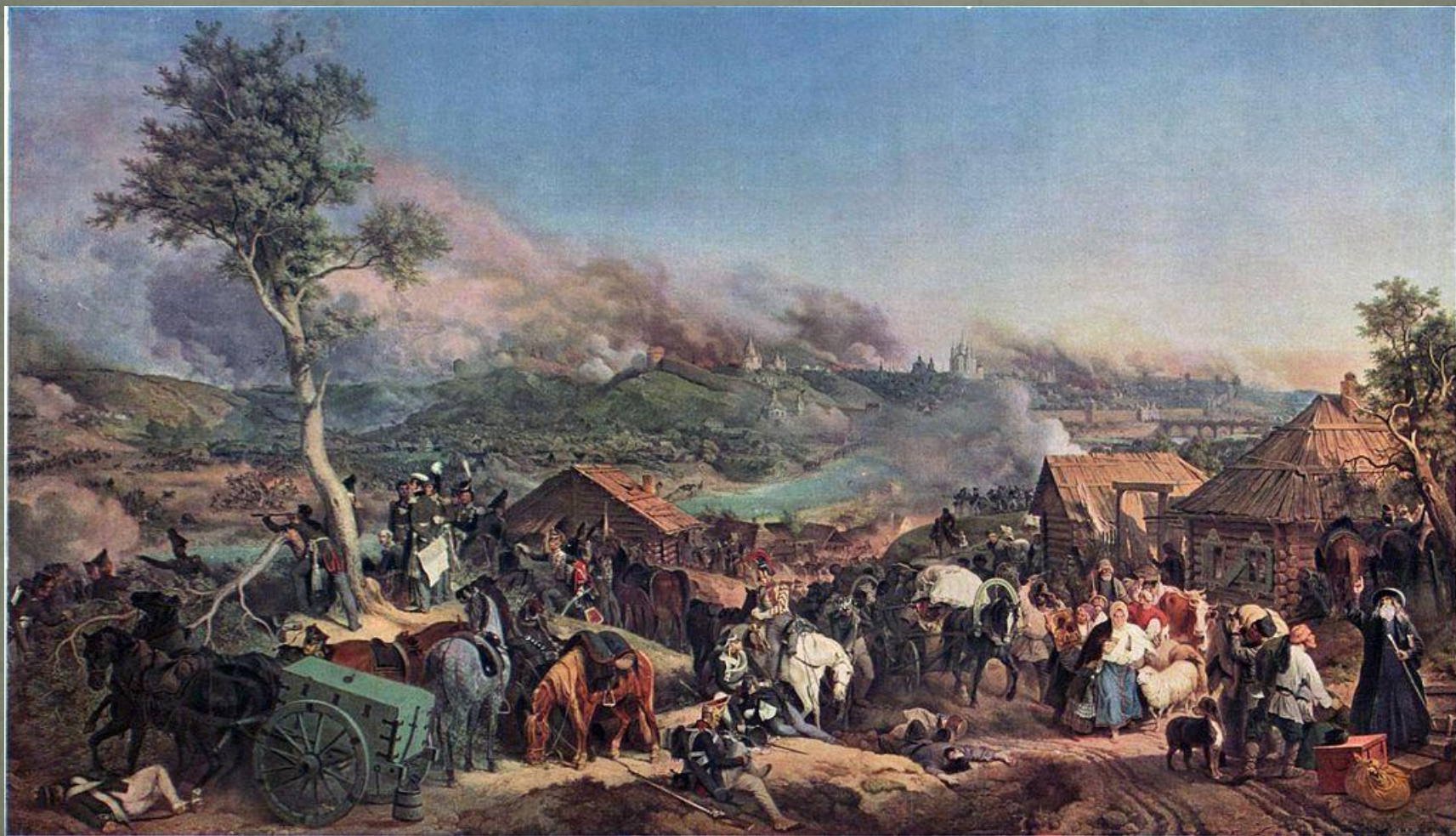
Сражение при Смоленске. Гесс, 1846 год