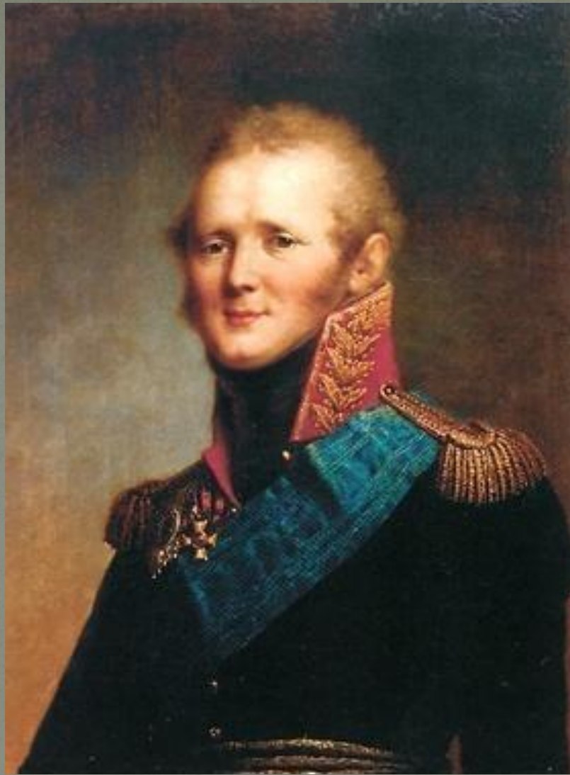
Александр I (1801-1825 г.п.)