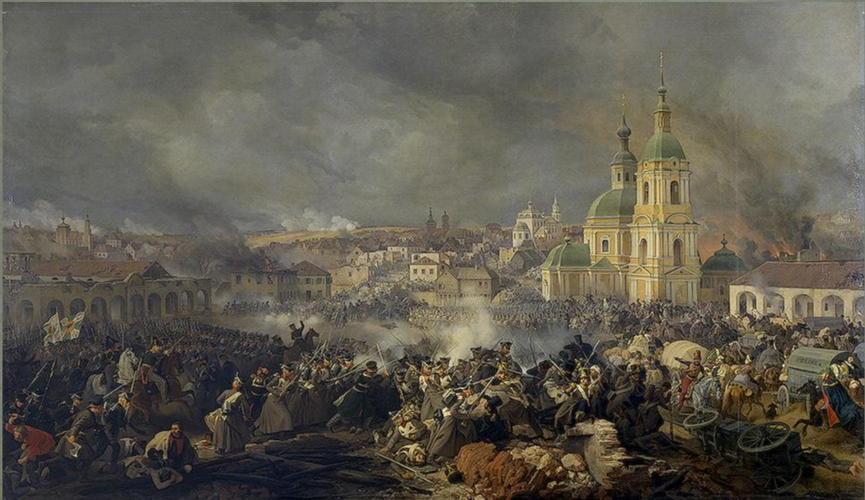
Сражение у г. Вязьмы.