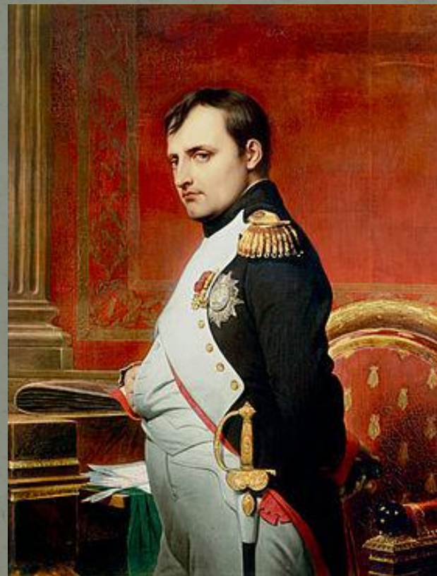
Император Наполеон I