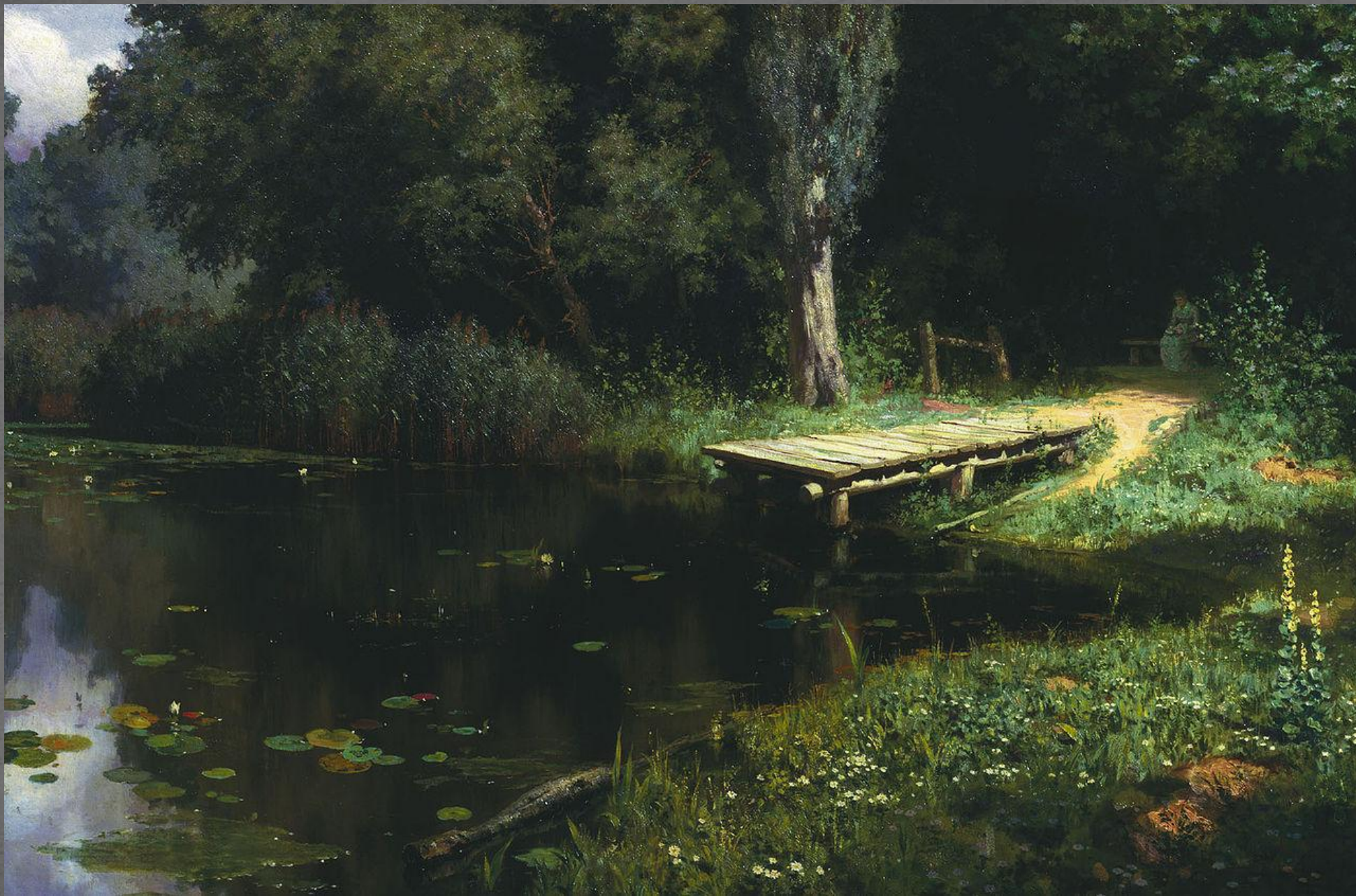
Заросший пруд. ТГ. 1879 г.