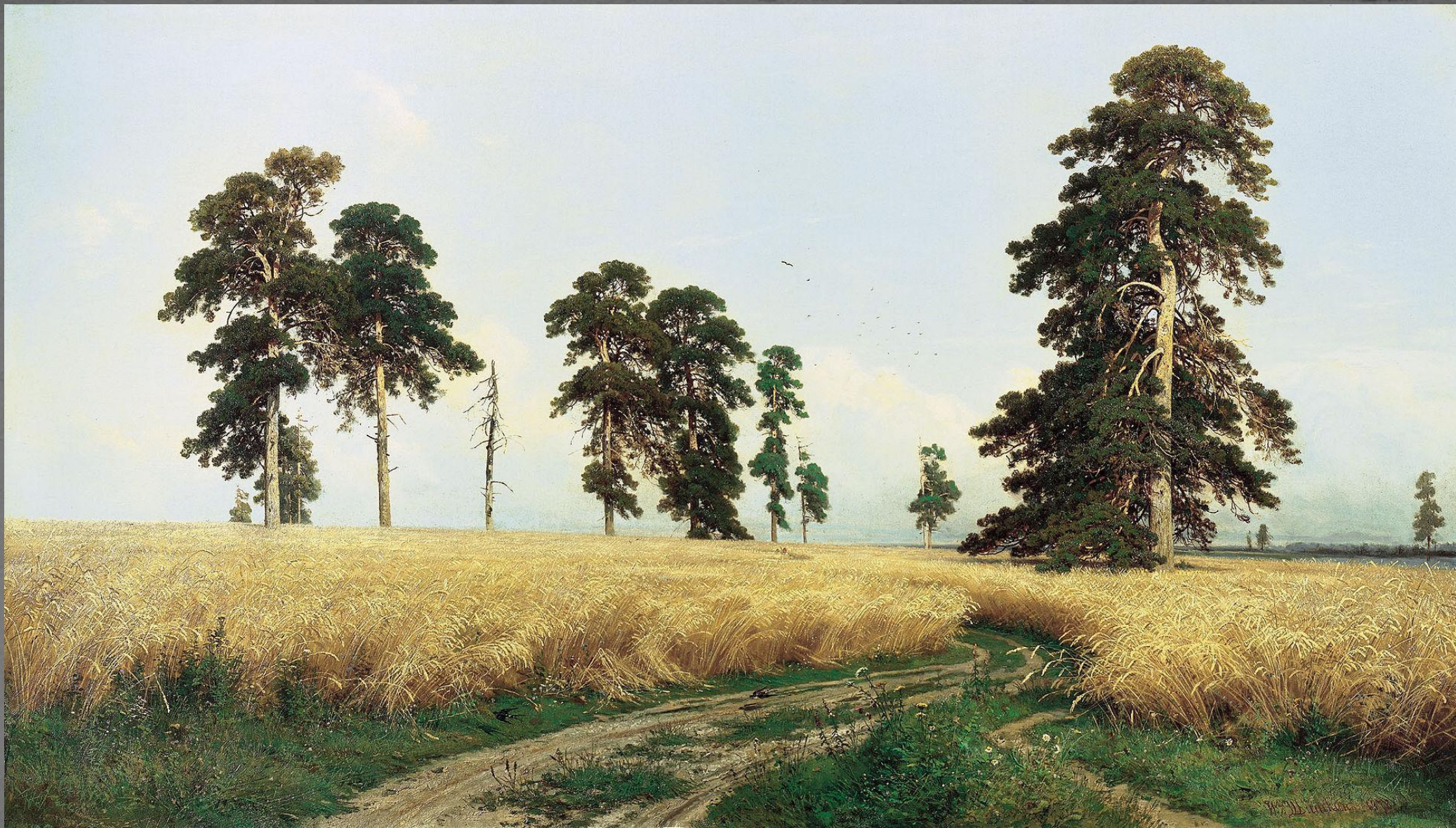
Рожь. ТГ. 1878 г.