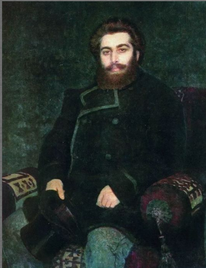
Портрет художника Архипа Ивановича Куинджи И. Е. Репин, 1877