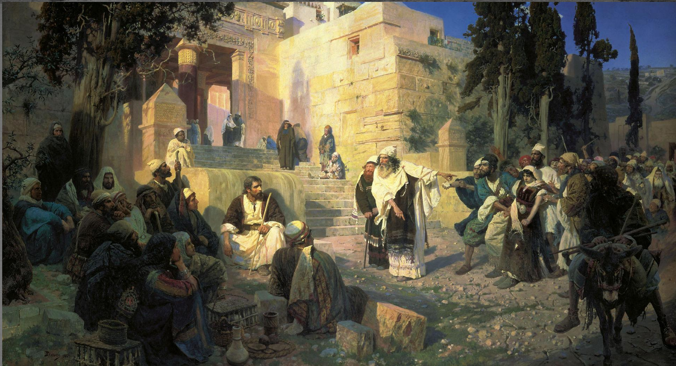
Христос и грешница. ГРМ. 1887 г.