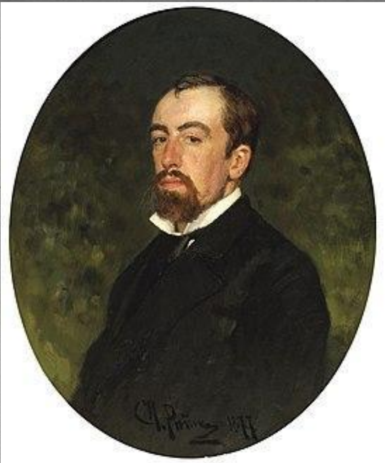
В. Д. Поленов. Портрет работы И. Репина (1877)