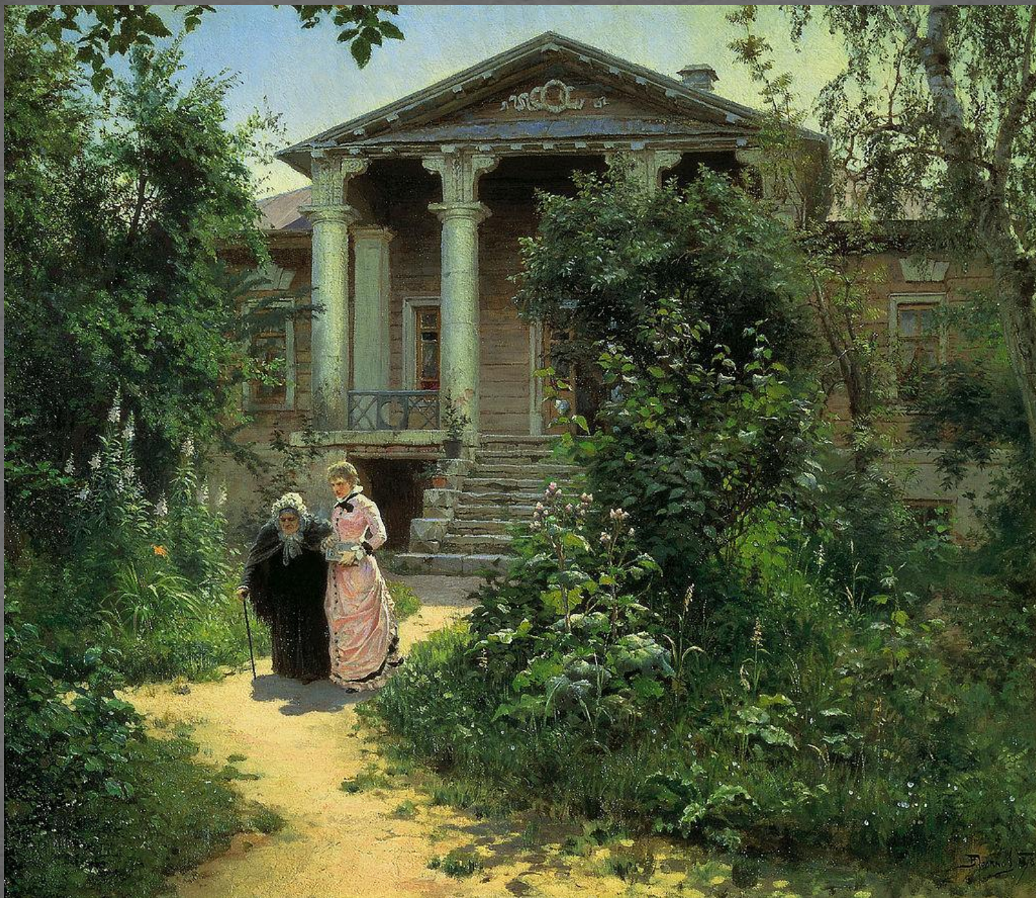
Бабушкин сад. ТГ. 1878 г.