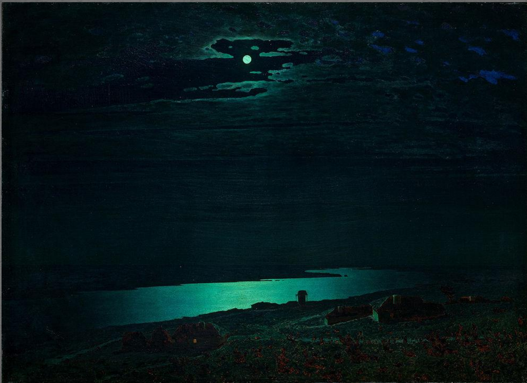
Лунная ночь на Днепре. ГРМ. 1880 г.