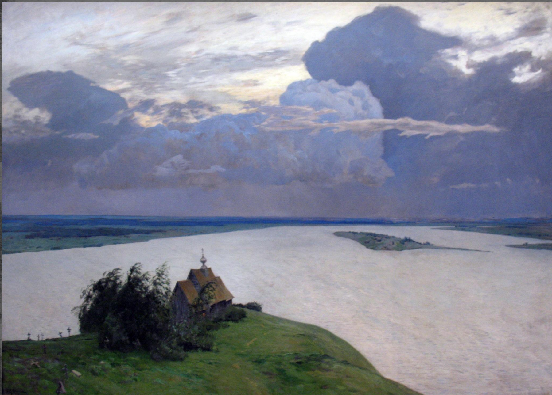
Над вечным покоем ГРМ. 1894г.