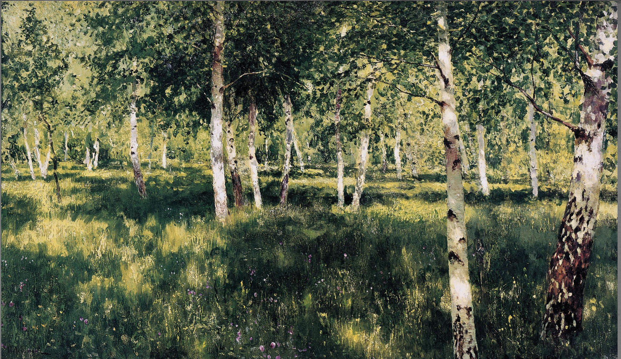
Берёзовая роща. ТГ. 1885 - 1889 гг.