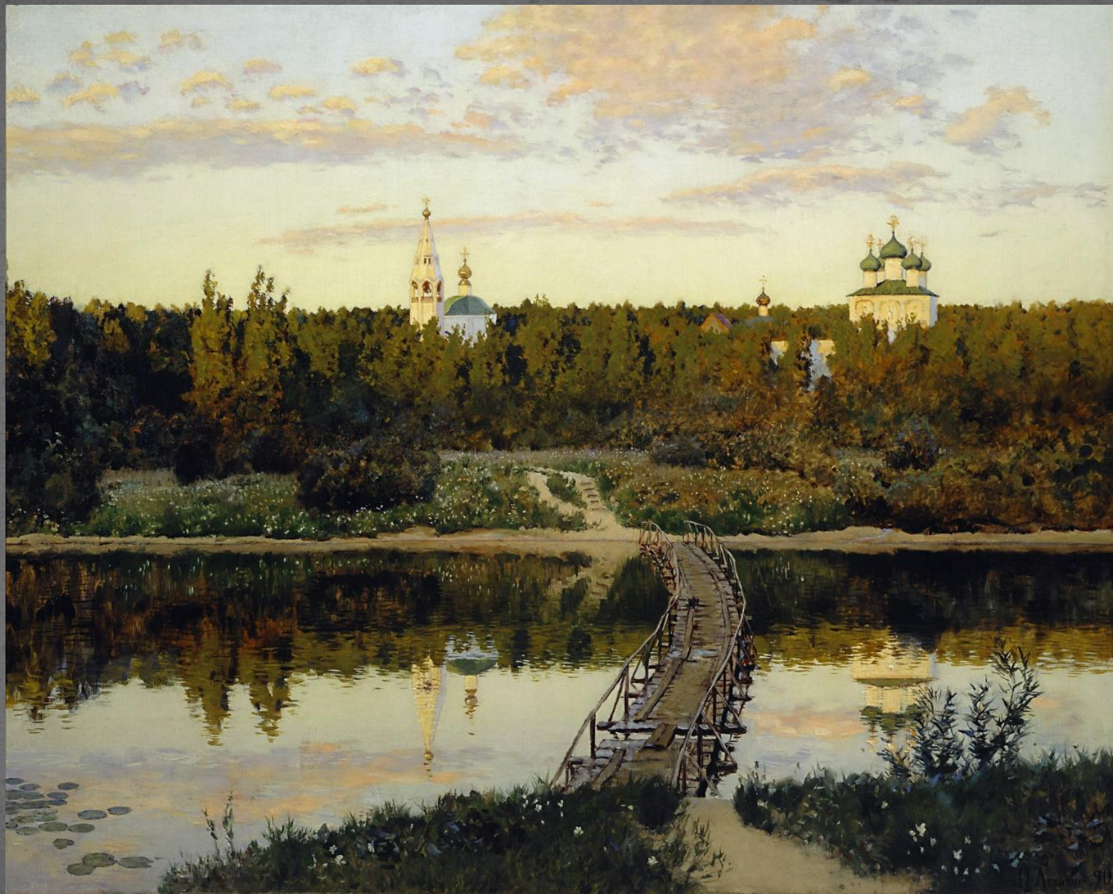
Тихая обитель. ТГ. 1890 г.