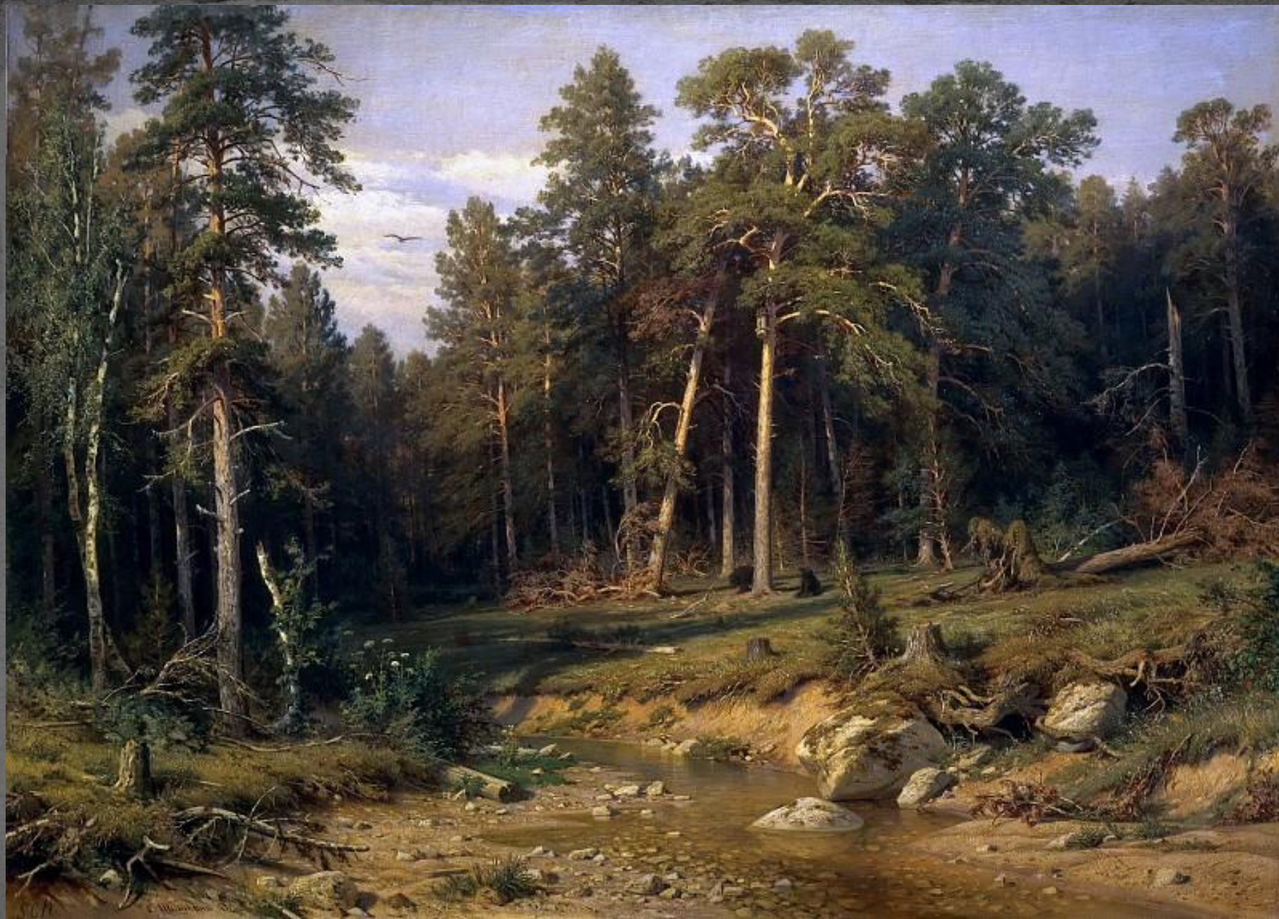
Сосновый бор. Мачтовый лес в Вятской губернии. ТГ. 1872 г.