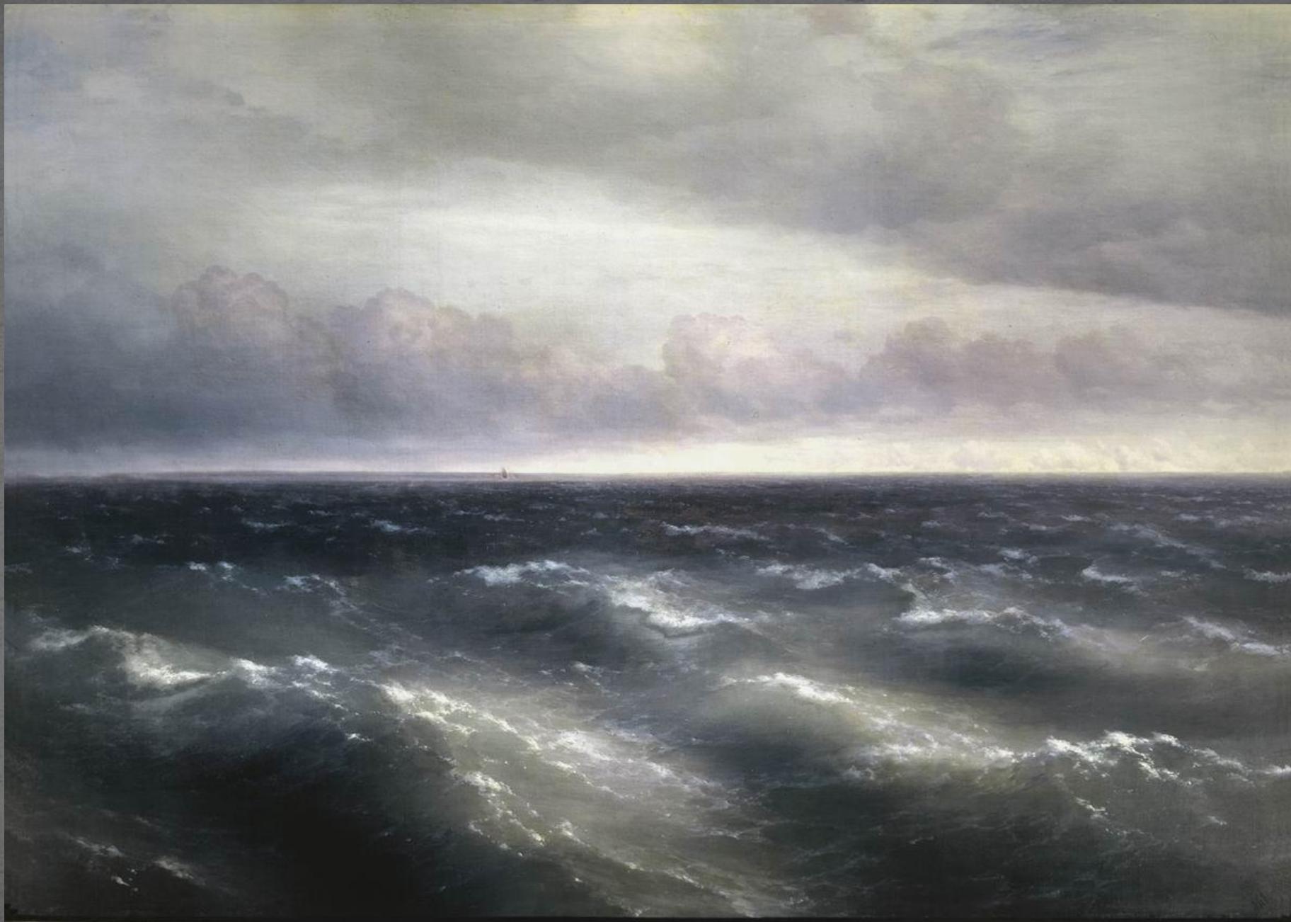
Чёрное море. ТГ. 1881 г.