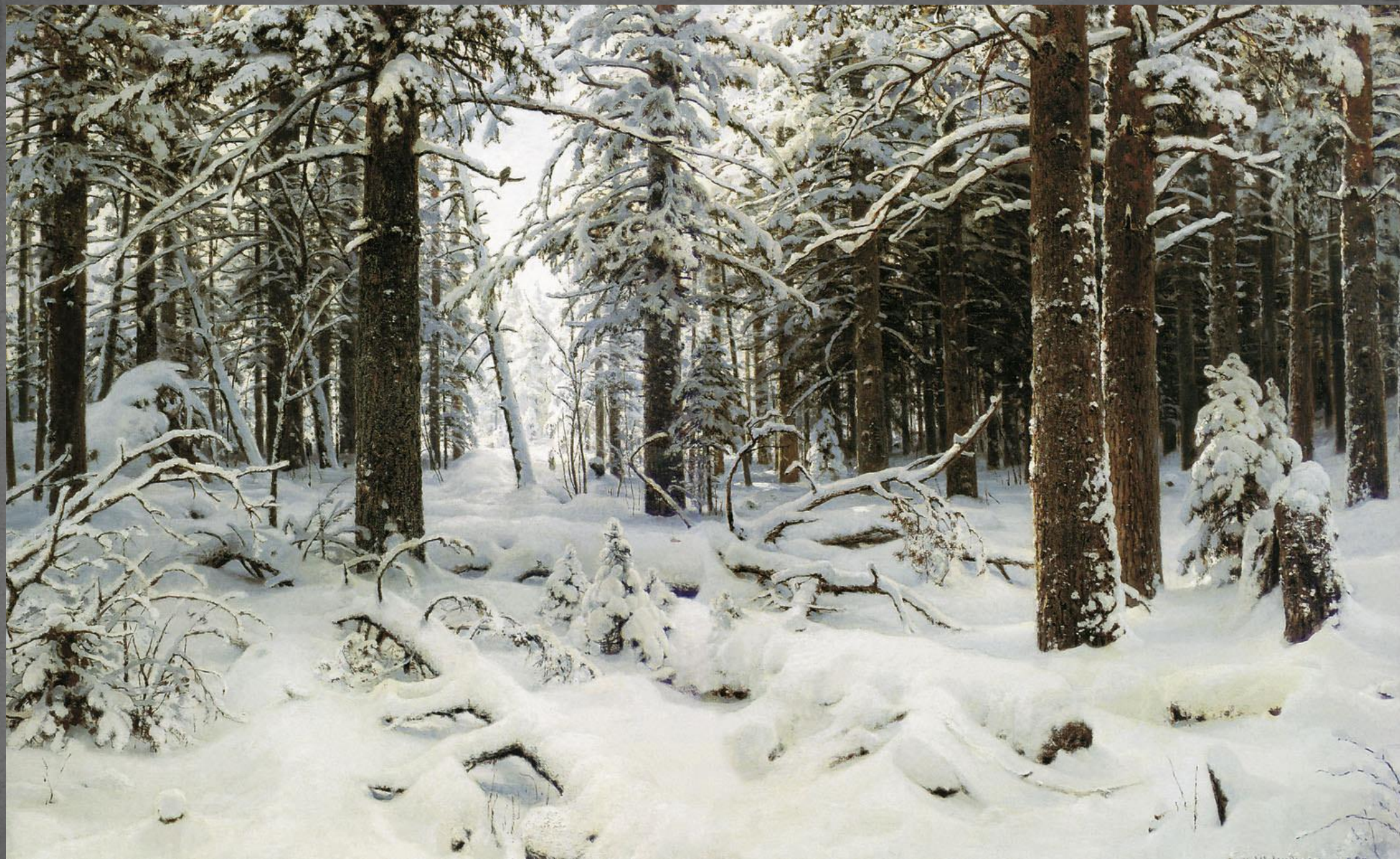
Зима. ГРМ. 1890 г.