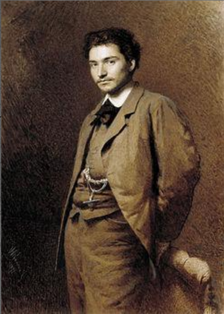
Портрет художника Ф. А. Васильева работы И. Н. Крамского. 1871