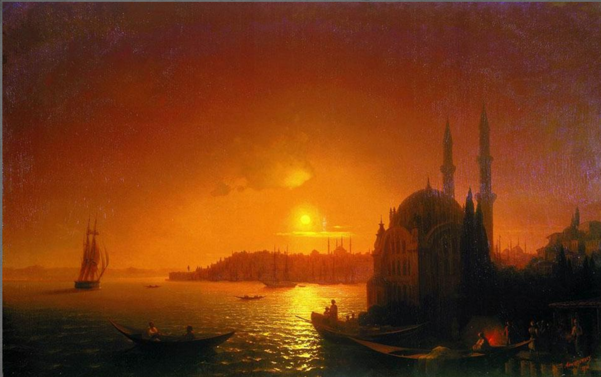
Вид Константинопол я. ГРМ. 1846 г.