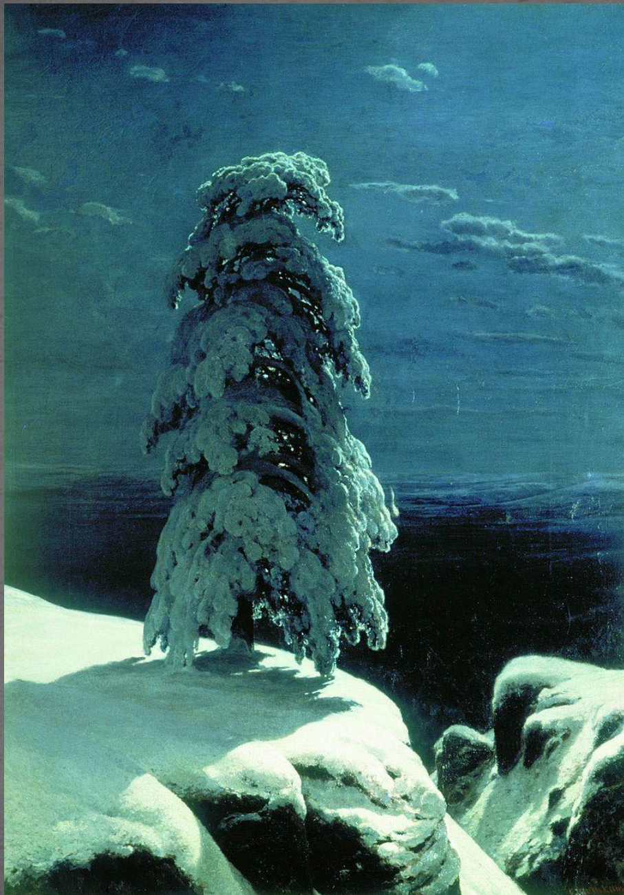
На севере диком. Киевский национальный музей русского искусства, Киев. 1891 г.