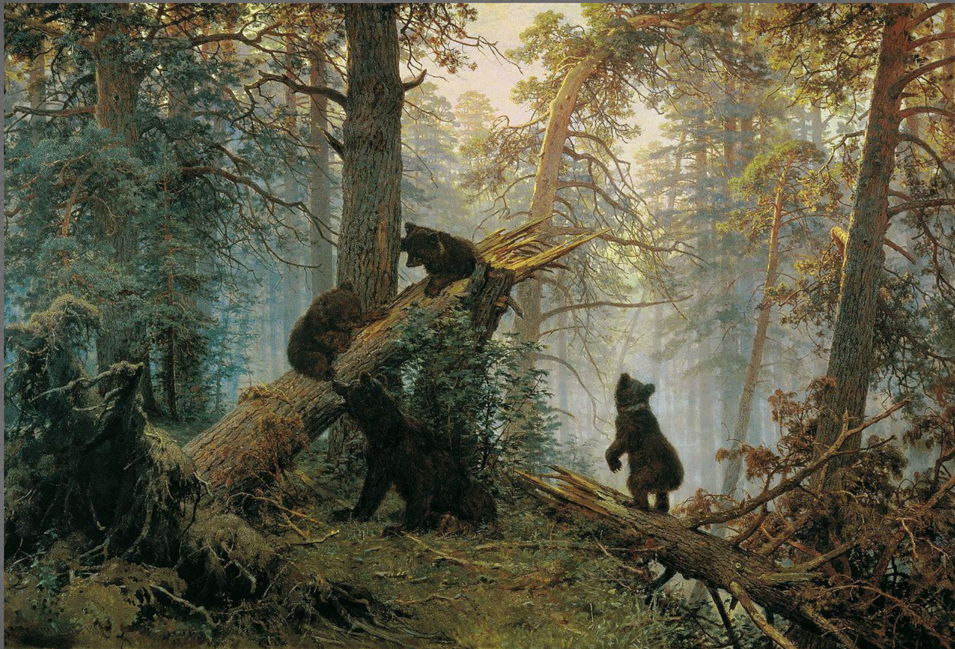
Утро в сосновом лесу. ТГ. 1889 г.