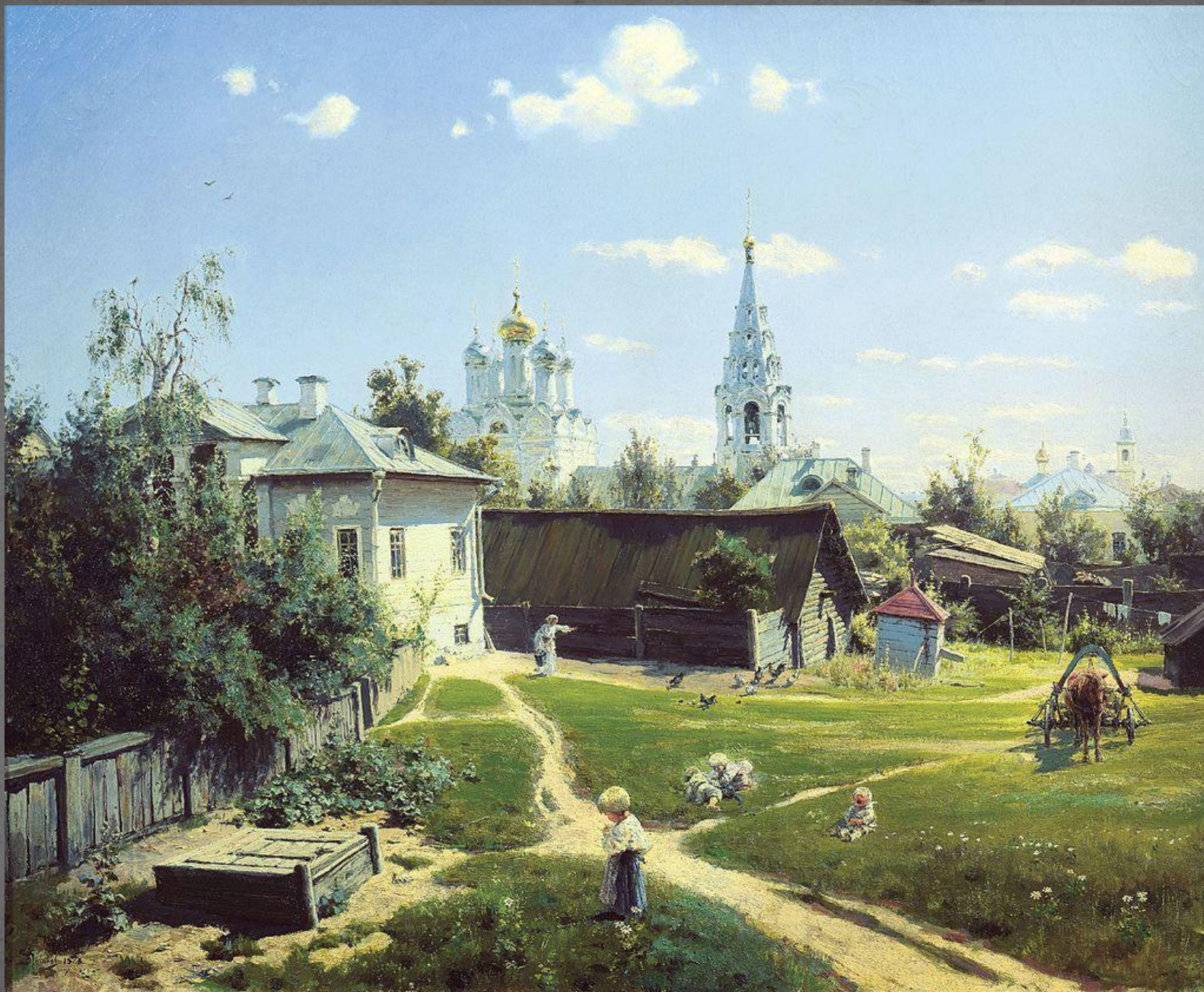
Московский дворик. ТГ. 1878 г.