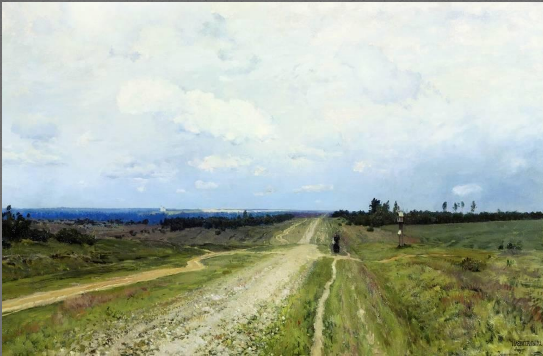
Владимирка ГРМ. 1892г.