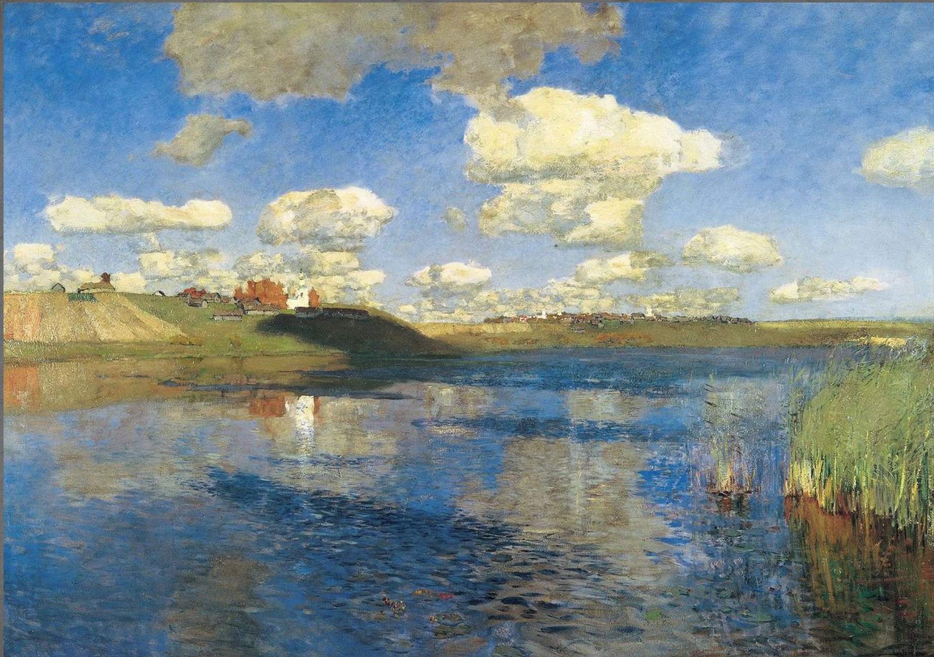
Озеро. ГРМ. 1899 - 1900 гг.