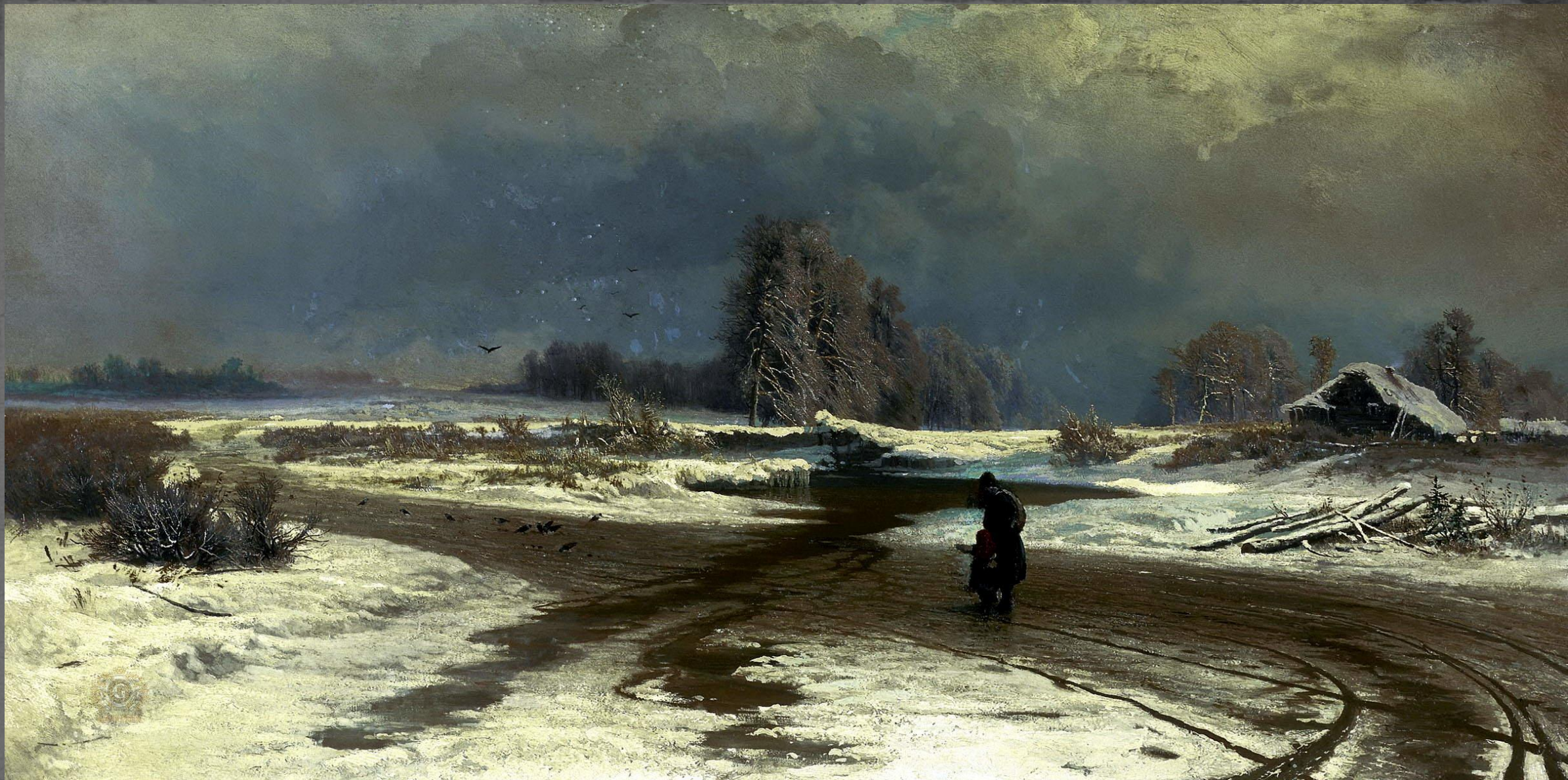
Оттепель. ТГ. 1871 г.