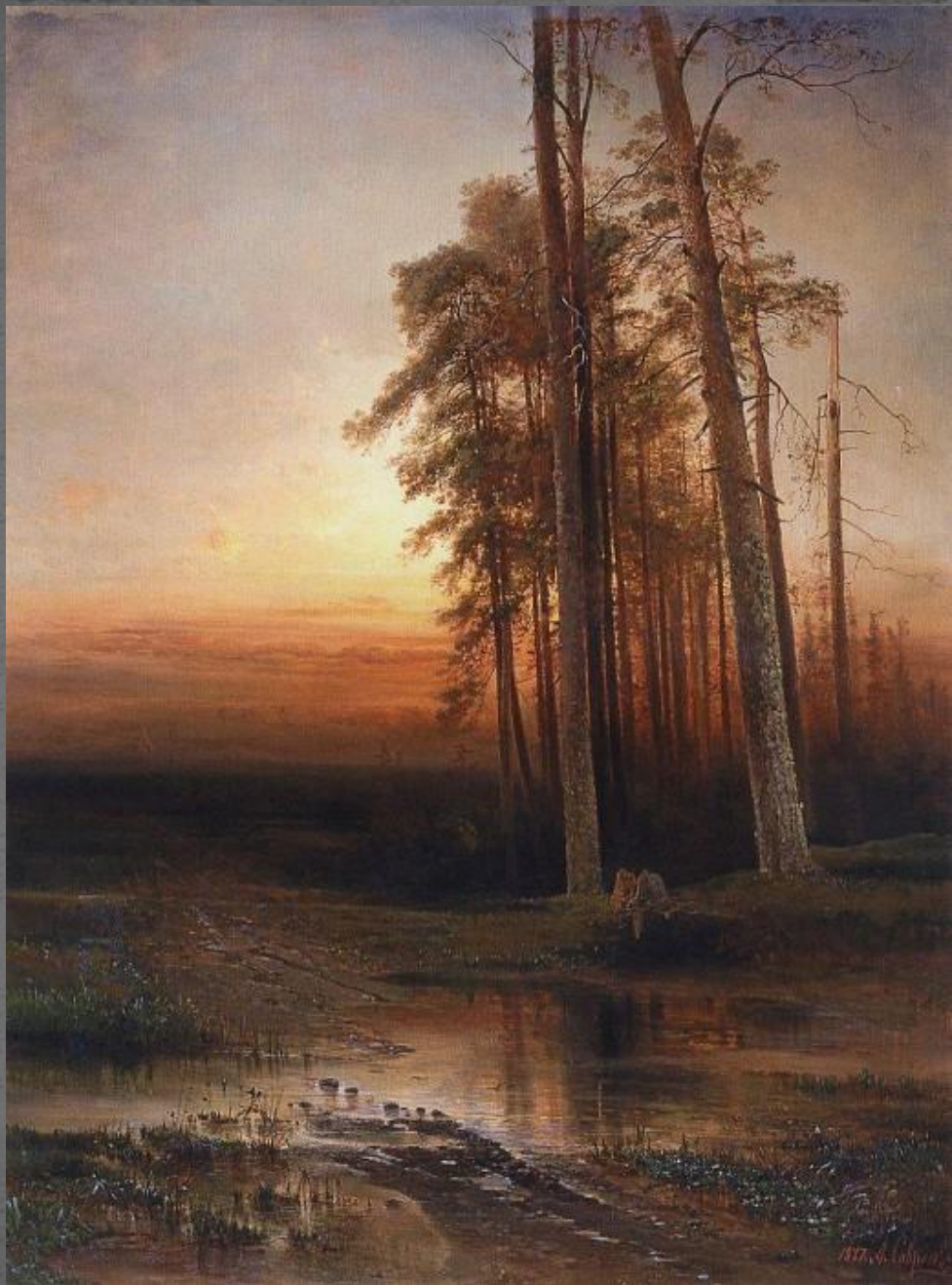
Вечер. 1877 г.