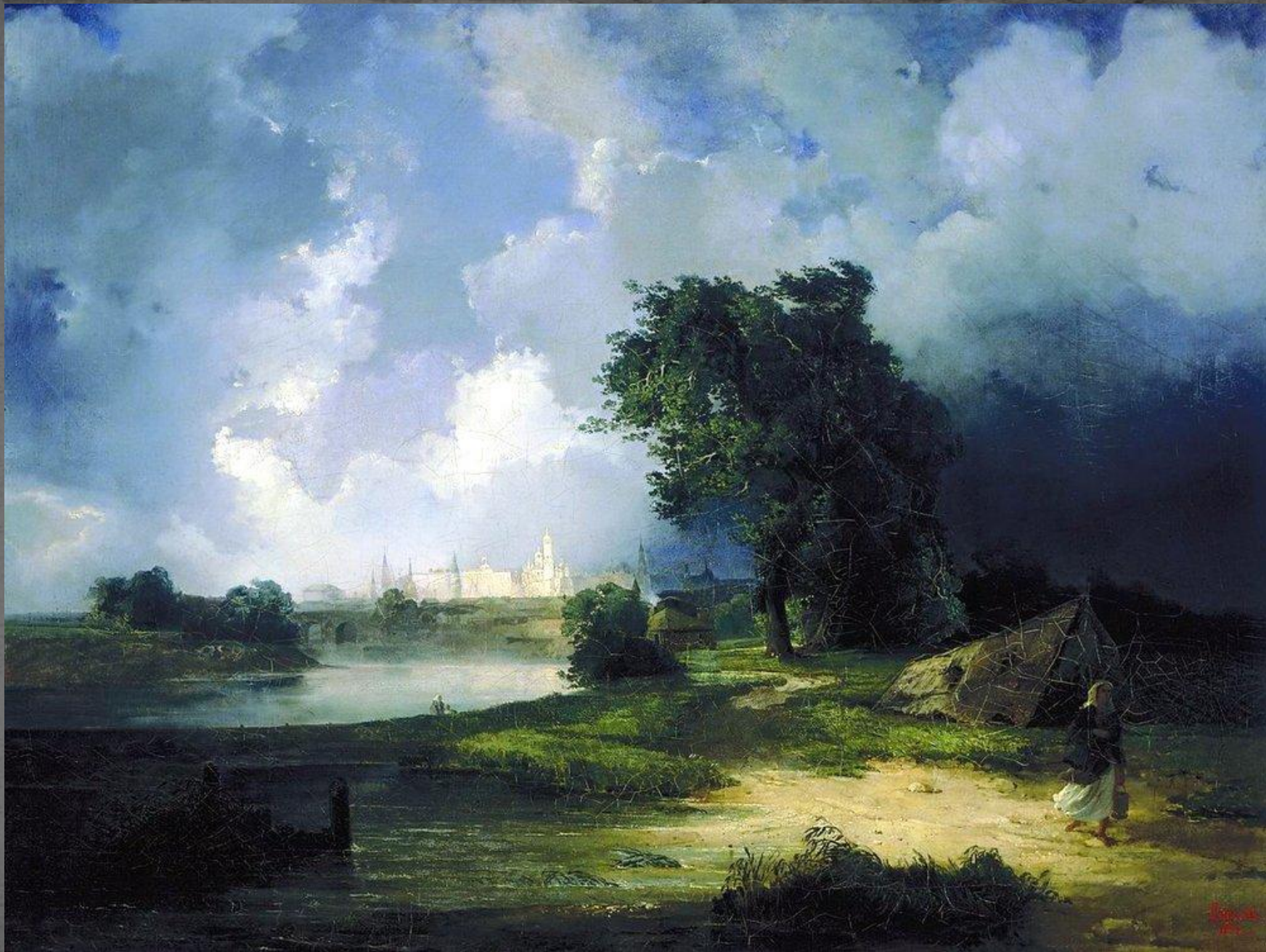
Вид на Кремль с Крымского моста в ненастную погоду. 1851 г.