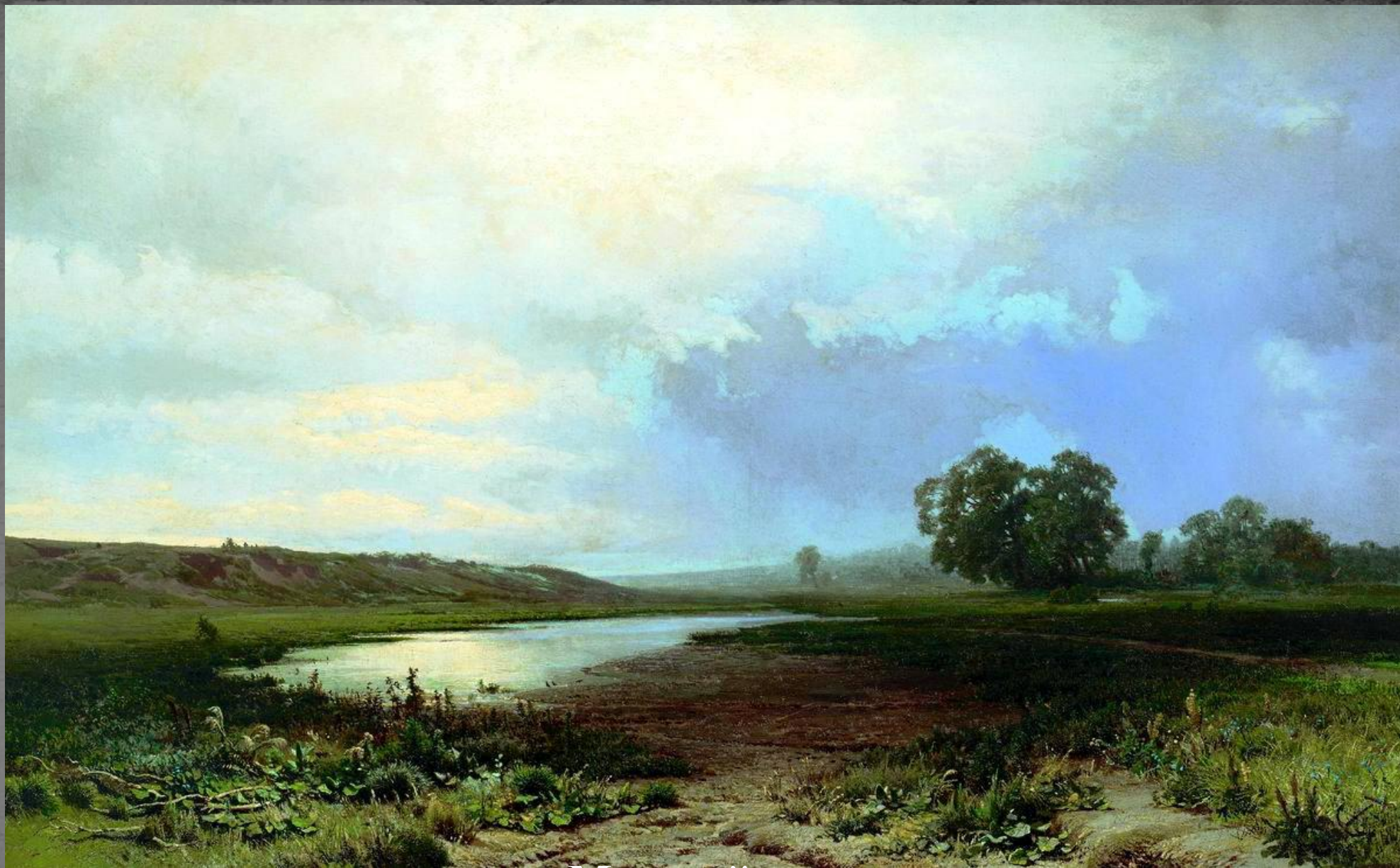
Мокрый луг. ТГ. 1872 г.