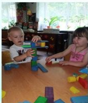
Первая младшая группа