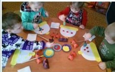
Младше- средняя группа