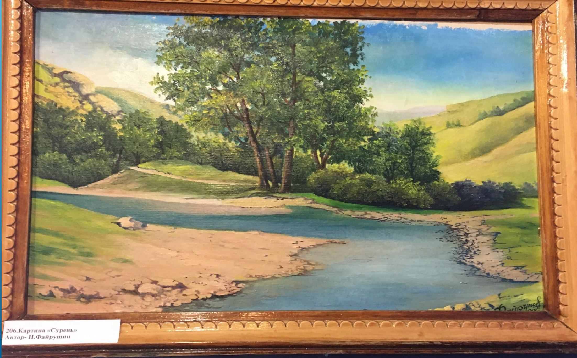
206. Картина «Сурень» Автор- Н.Файрушин