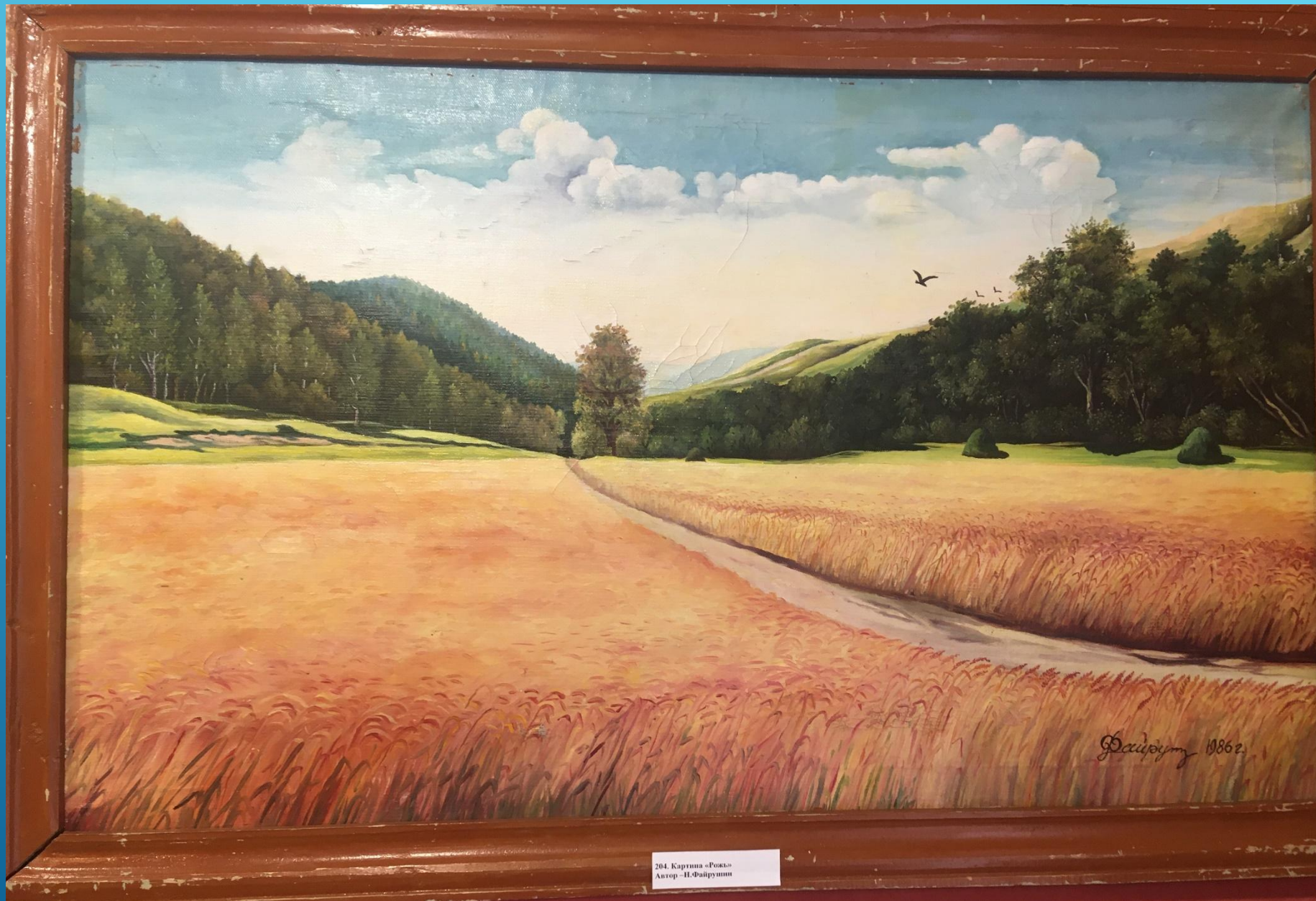
204. Картина «Роща» Автор - Н.Файрузова