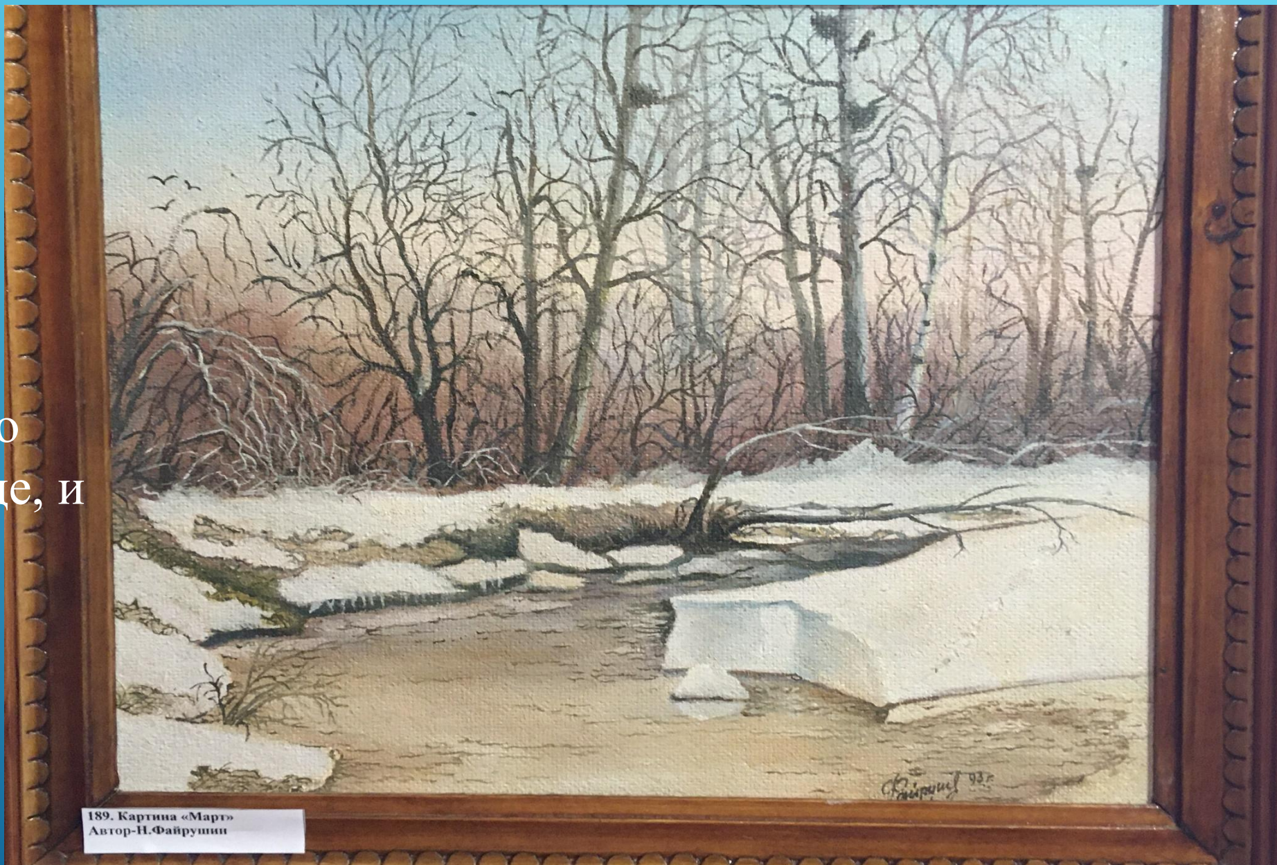
189. Картина «Март» Автор-Н.Файрусии

«Вечер», «Дождь», «Ранняя осень», «Начало марта»- в каждой из них отражение какого-то мгновения в природе, и каждая из них вызывает особое восхищение.