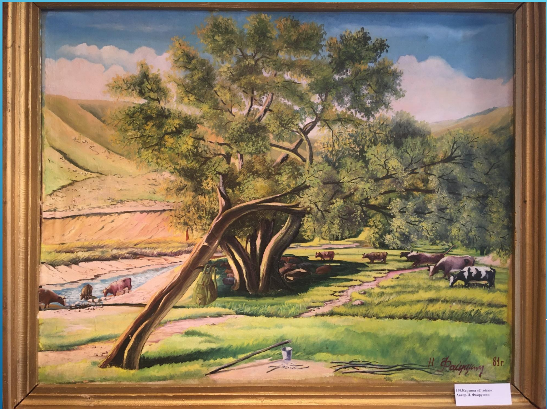
199. Картина «Стойло» Автор-Н. Файрузов