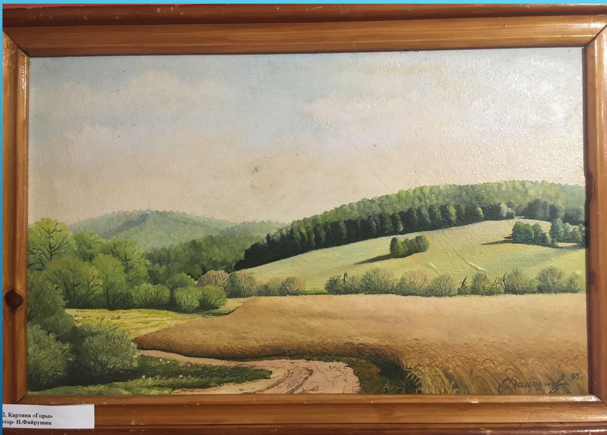
2. Картина «Горь» Автор- Н.Файрушин