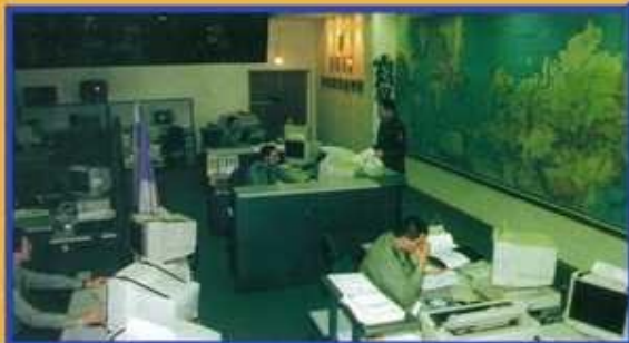
Сбор, обработка данных и информации о радиационной и химической обстановке в зонах заражения (загрязнения)