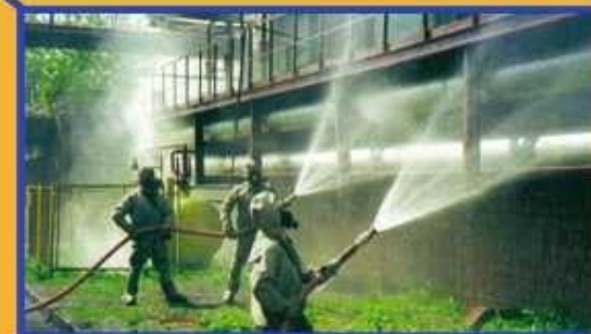
Специальная обработка и обеззараживание участков местности, дорог, объектов, зданий и сооружений