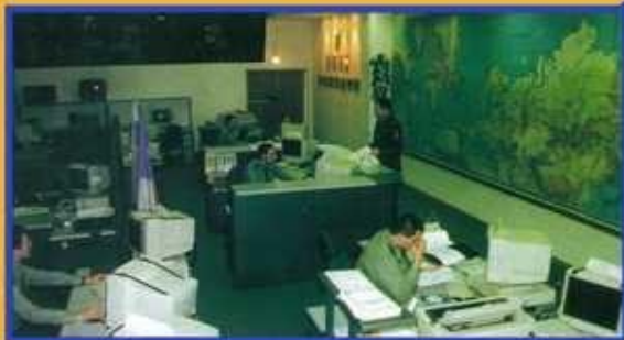
Сбор, обработка данных и информации о радиационной и химической обстановке в зонах заражения (загрязнения)