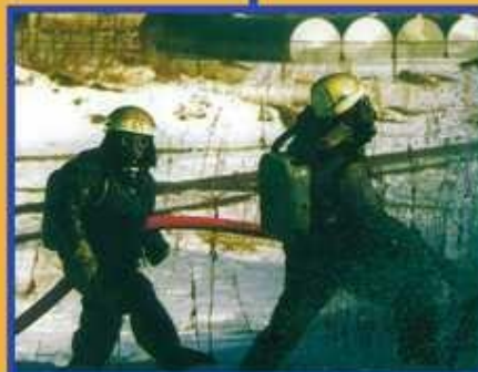
Применение средств радиационной и химической защиты