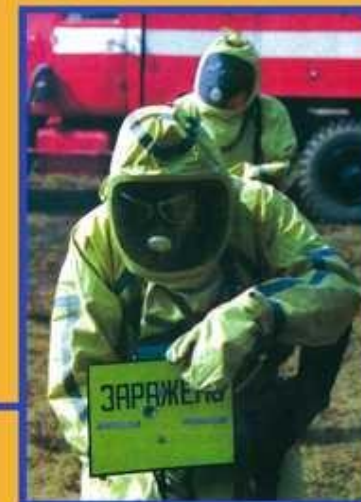
Выбор и соблюдение режимов защиты людей в условиях радиоактивного и химического заражения