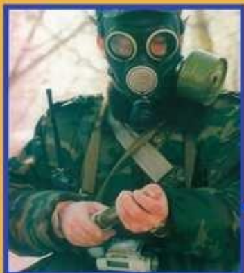
Радиационная и химическая разведка и контроль

Радиационная и химическая защита - это комплекс мероприятий по предупреждению и ослаблению воздействия на людей ионизирующих излучений радиоактивных веществ и опасных химических веществ