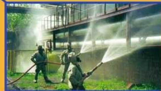
Специальная обработка и обеззараживание участков местности, дорог, объектов, зданий и сооружений