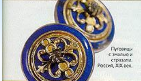
Пуговицы с эмалью и стразами. Россия, XIX век.