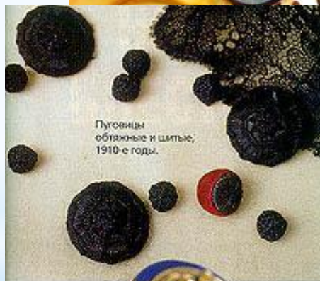
Пуговицы обязные и шпатыс, 1910-е годы.