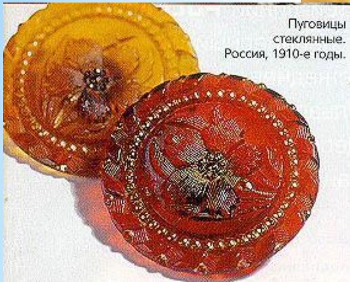
Пуговицы стеклянные. Россия, 1910-е годы.