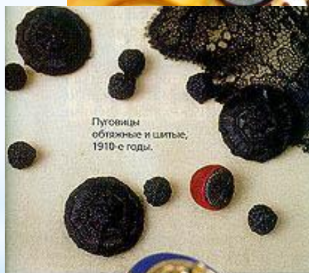
Пуговицы обязные и шптыль, 1910-е годы.