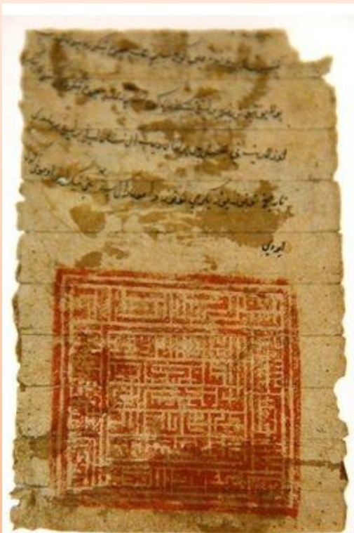
Золотоордынский ярлык на тюркском языке