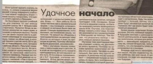
Публикации о работе научного общества «Эврика» в районной газете «Наша жизнь»