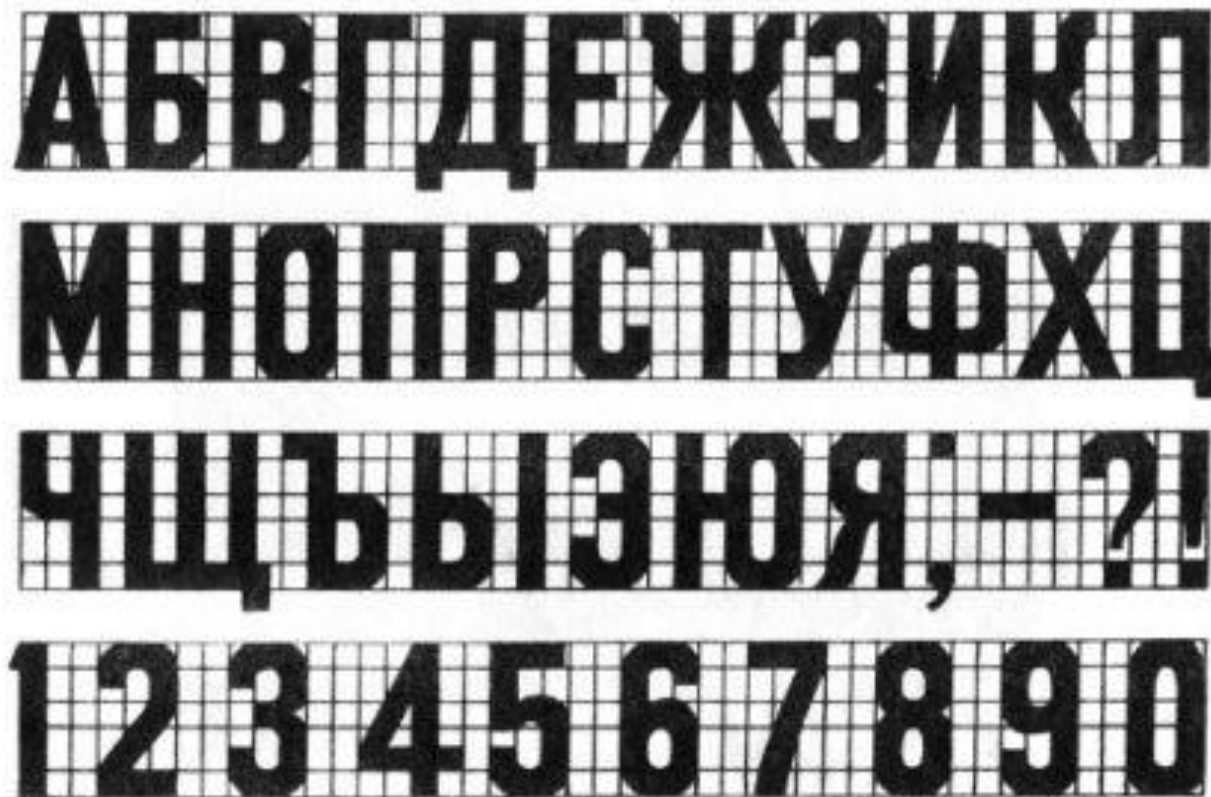
Разновидность плакатного шрифта с горизонтальными линиями выше середины