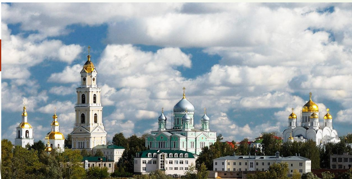
Свято-Троицкий Серафимо-Дивеевский монастырь