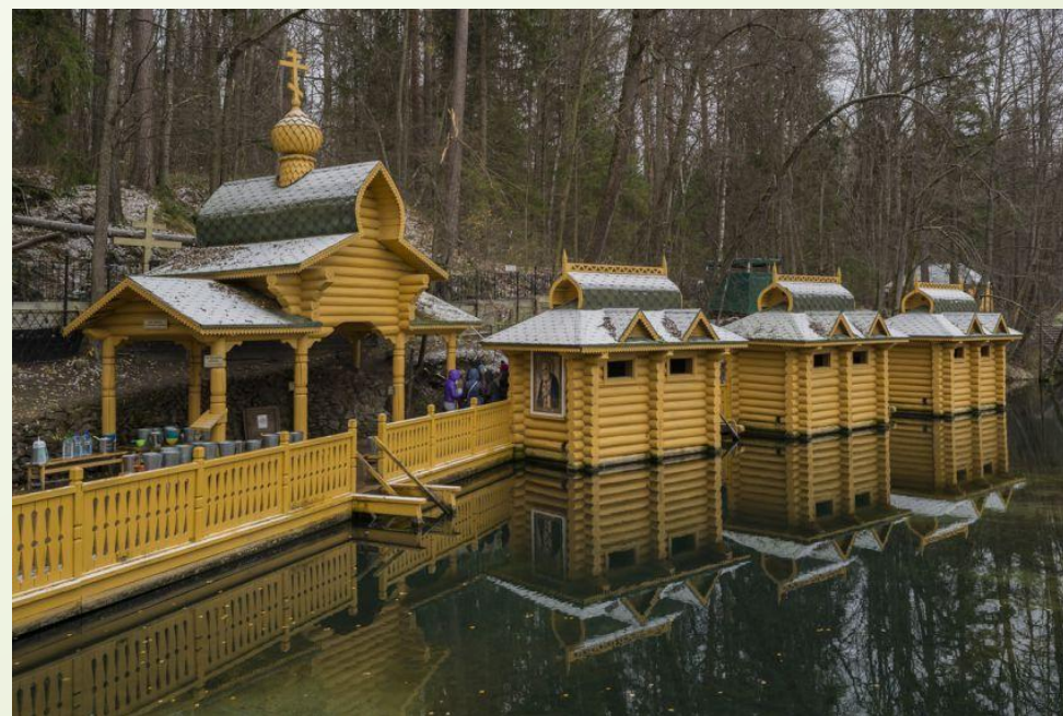
Часовня Серафима Саровского на источнике преп. Серафима