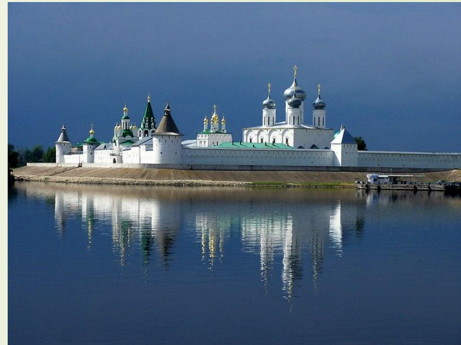
Паломничество в Свято-Троицкий Макарьевский монастырь