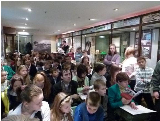
Музей «Разночинный Петербург»

До финала дошли 35 команд (31 школа) из 9 районов города. В игре приняли участие 250 школьников 5-10 классов