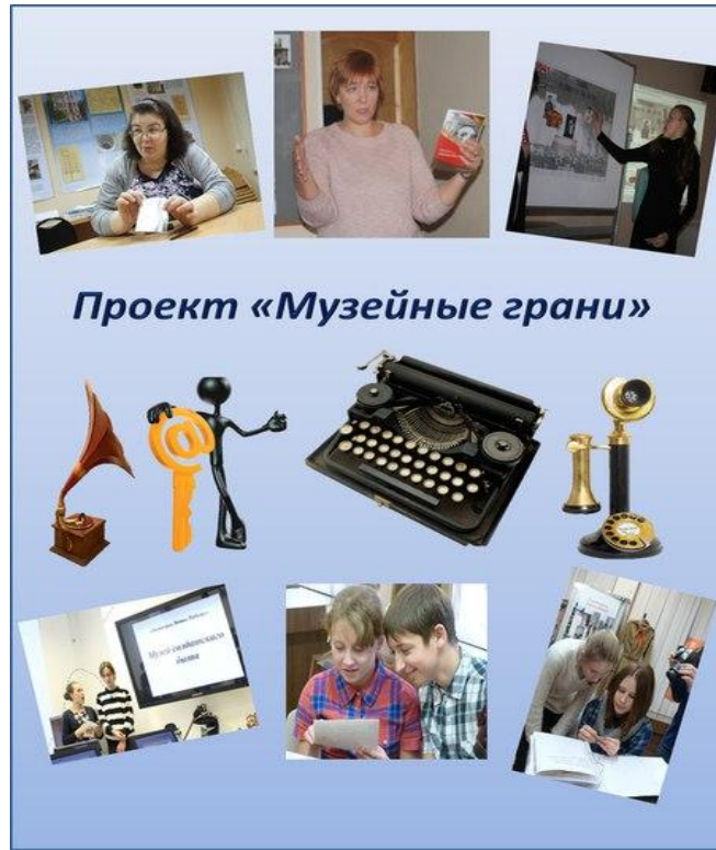
Проект «Музейные грани»

Сентябрь 2015 года – февраль 2016 года - открытая городская музейно-историческая игра «Петербург. Культура. Слово». Участвовали музеи, в которых представлена тематика, связанная с литературой и книгопечатанием