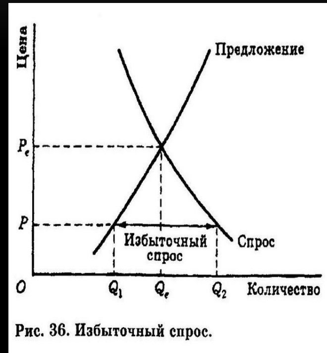
Рис. 36. Избыточный спрос.