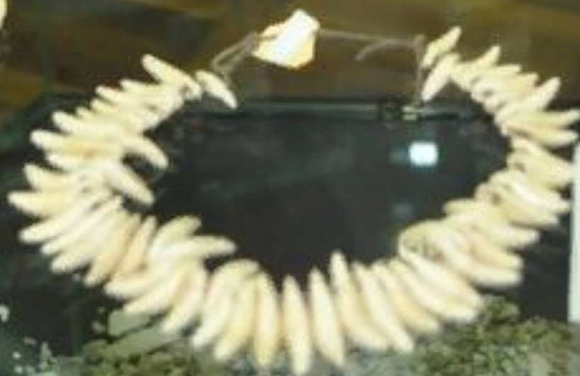
Ожерелье из продолговатых раковин [12 000 лет назад]