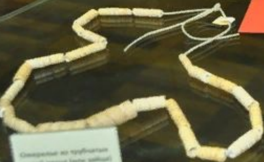
Ожерелье из раковин восточного [1, 2, 3, 4, 5] [12 000 лет назад]