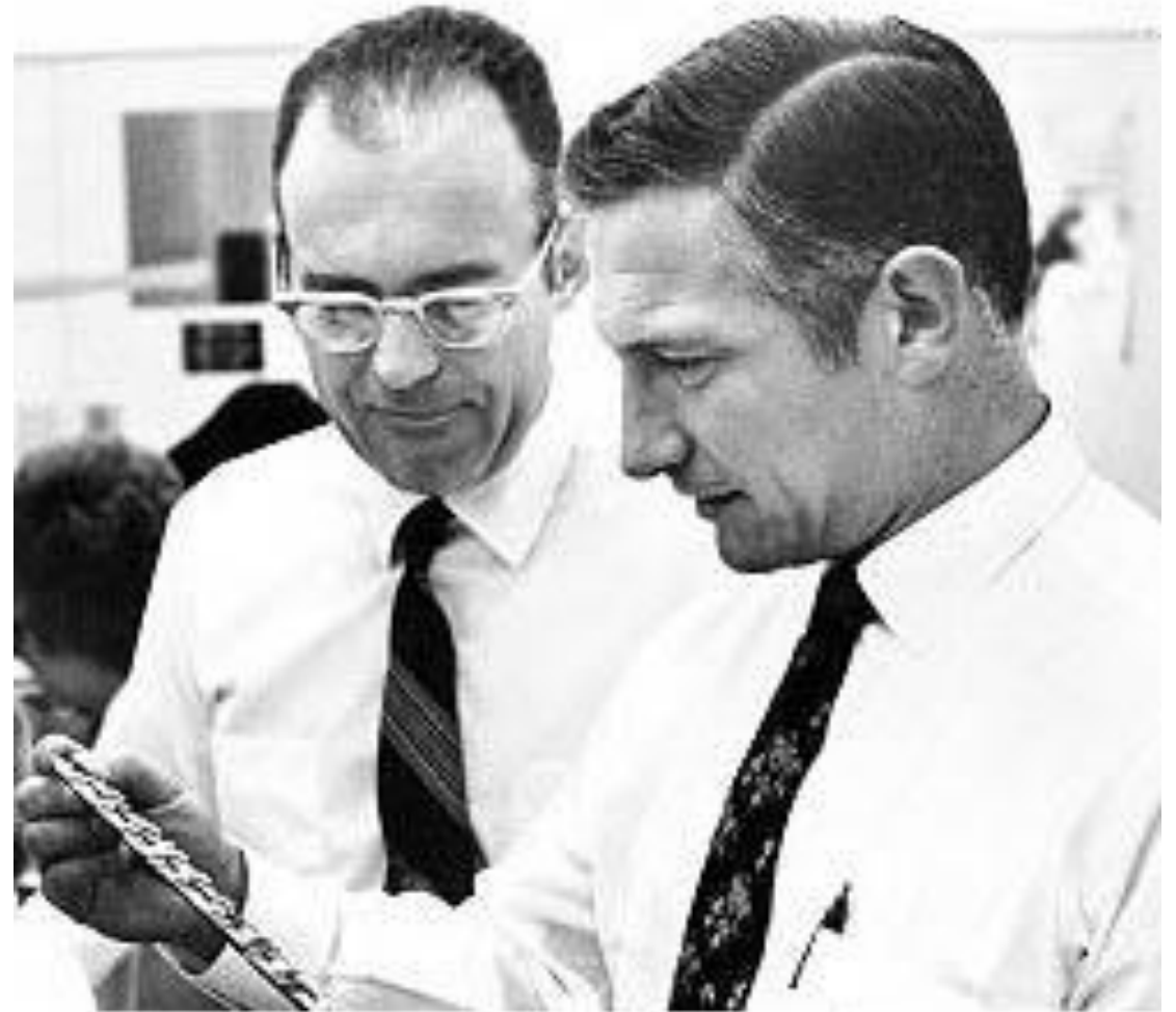
Гордон Мур (слева) и Роберт Нойс

Компанию основали Роберт Нойс и Гордон Мур 18 июля 1968 года после того, как ушли из компании Fairchild Semiconductor. Вскоре к ним присоединился Энди Гроув, разработавший и внедривший метод корпоративного управления OKR, эффективно используемый в менеджменте. Бизнес-план компании, распечатанный Робертом Нойсом на печатной машинке, занимал одну страницу. Представив его финансисту, ранее помогавшему создать Fairchild, Intel получила стартовый кредит в $2,5 млн.