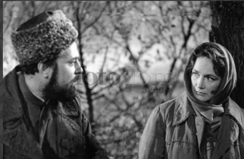
1910-11 04.04.2010 Кадр из фильма «Цыган», 1967. На фото: Евгений Матвеев и Людмила Хитяева