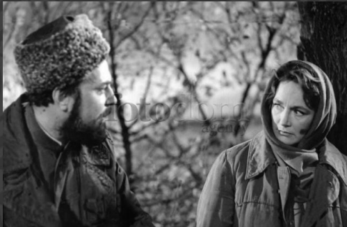
www.Moskva.ru 1910-11 04-05 Кадр из фильма «Цыган», 1967. На фото: Евгений Матвеев и Людмила Хитяева