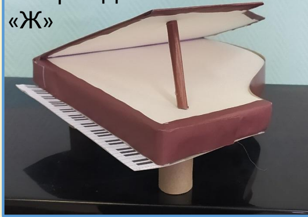
Тетерин Данил 1 «Ж»