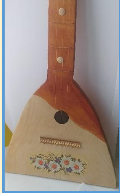
Кузнецов а Дарья 3 «Д»