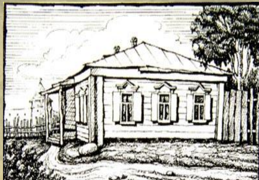
Дом в Зарайске, где родился В.В. Виноградов.