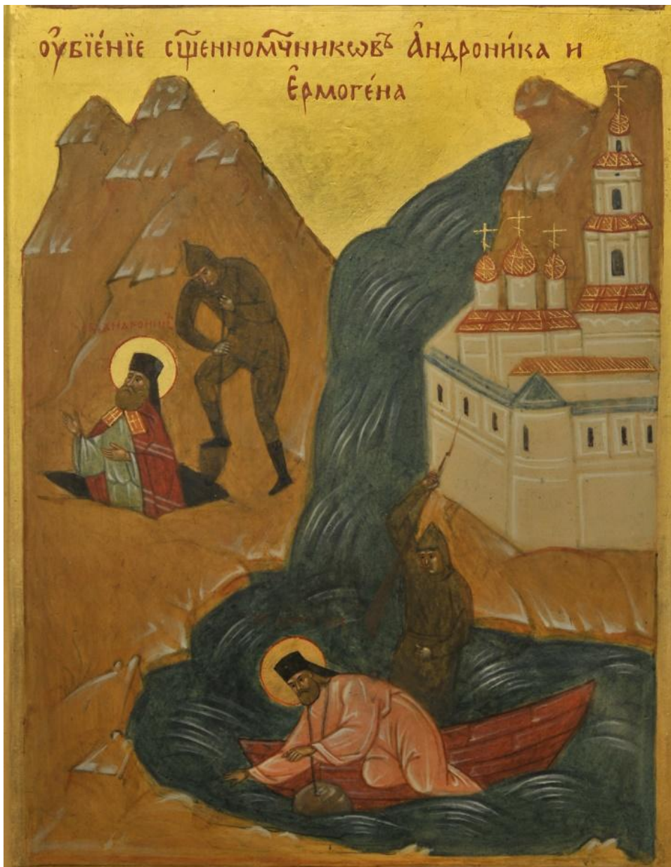
Икона собора новомучеников (2000). Клеймо № 4.

Свщмч. АНДРОНИК (Владимир Никольский), архиепископ Пермский и Соликамский (бывш. Киотский)