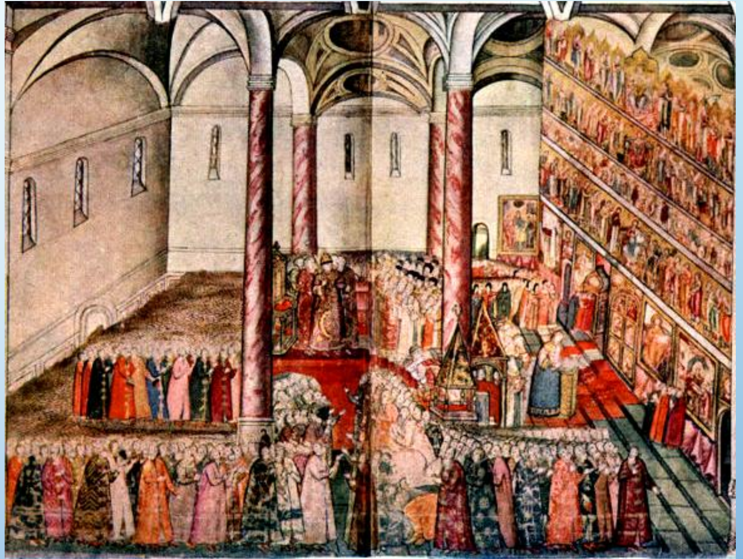
Венчание на царство Царя Михаила Фёдоровича в Успенском соборе