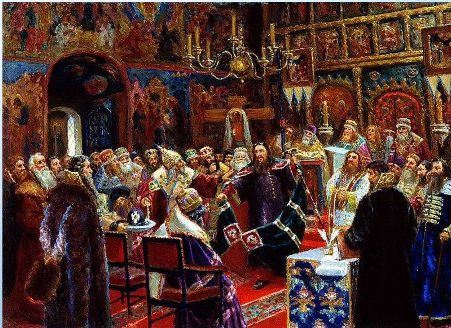
Суд над патриархом Никоном (С. Д. Милорадович, 1885 год)