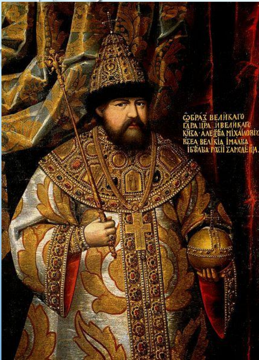
Алексей Михайлович Романов.