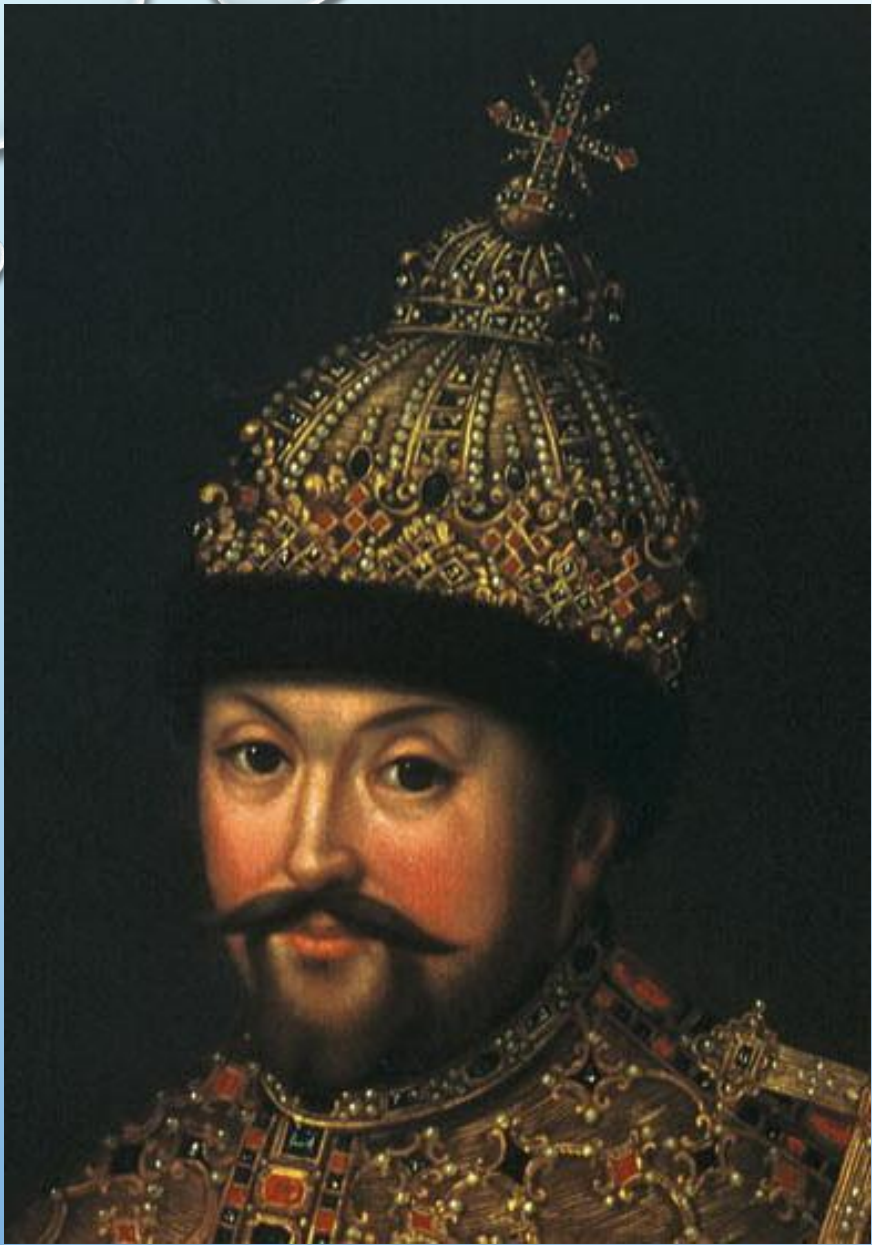
Михаил Фёдорович Романов