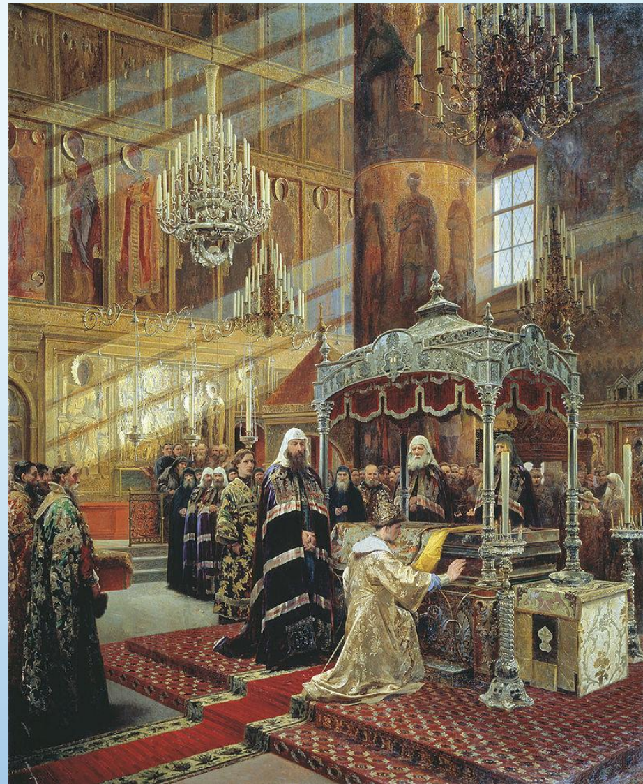
Алексей Михайлович и Никон перед гробницей святителя Филиппа