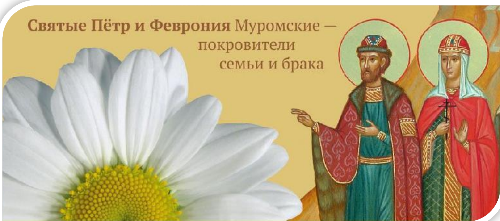
Святые Пётр и Феврония Муромские — покровители семьи и брака

До 2008 года дату памяти Петра и Февронии чтили только православные христиане. В церквях проводили торжественные богослужения и молебны. Сейчас этот праздник на государственном уровне внесен в календарь событий России. Он считается Днем семьи, любви и верности.