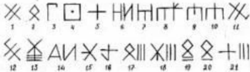
Коми пасы (родовые знаки), которые Стефан использовал для создания пермской азбуки «Анбур»