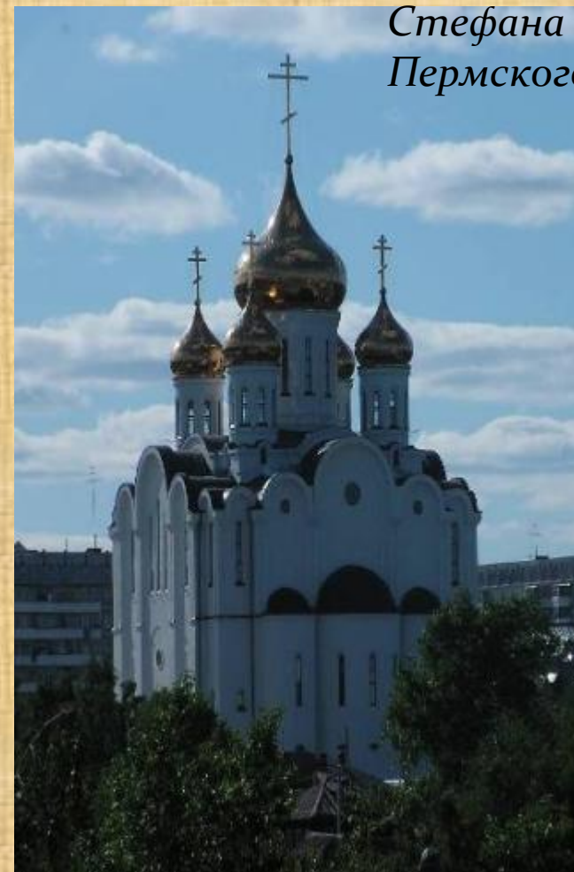
Собор Стефана Пермского.