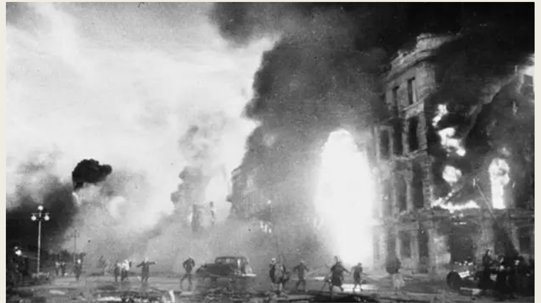
Сталинград в огне, 23 августа 1942 года.