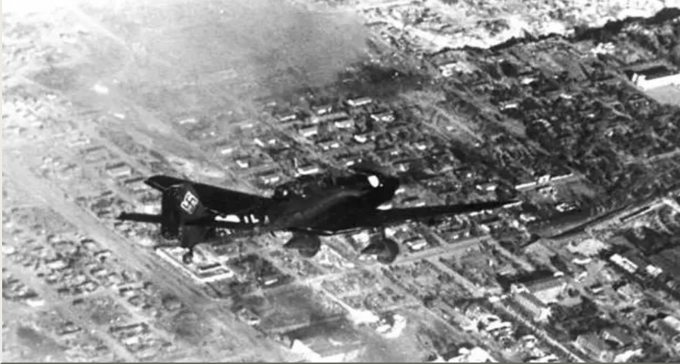
Пикирующий бомбардировщик в небе над Сталинградом.

Город полыхал, задыхаясь от дыма, захлебываясь кровью. Щедро сдобренная нефтью, горела и Волга, отрезая людям путь к спасению.