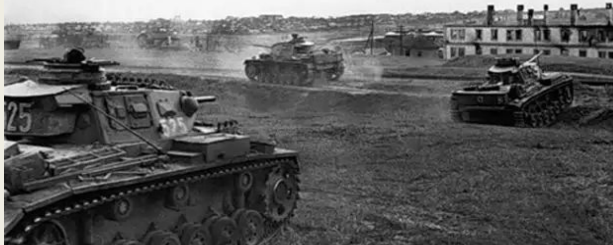
24-я танковая дивизия вермахта в пригороде Сталинграда.

Город полыхал, задыхаясь от дыма, захлебываясь кровью. Щедро сдобренная нефтью, горела и Волга, отрезая людям путь к спасению.