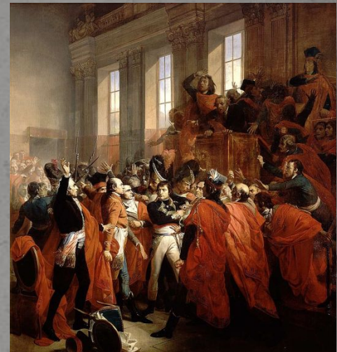
Генерал Бонапарт в Совете пятисот