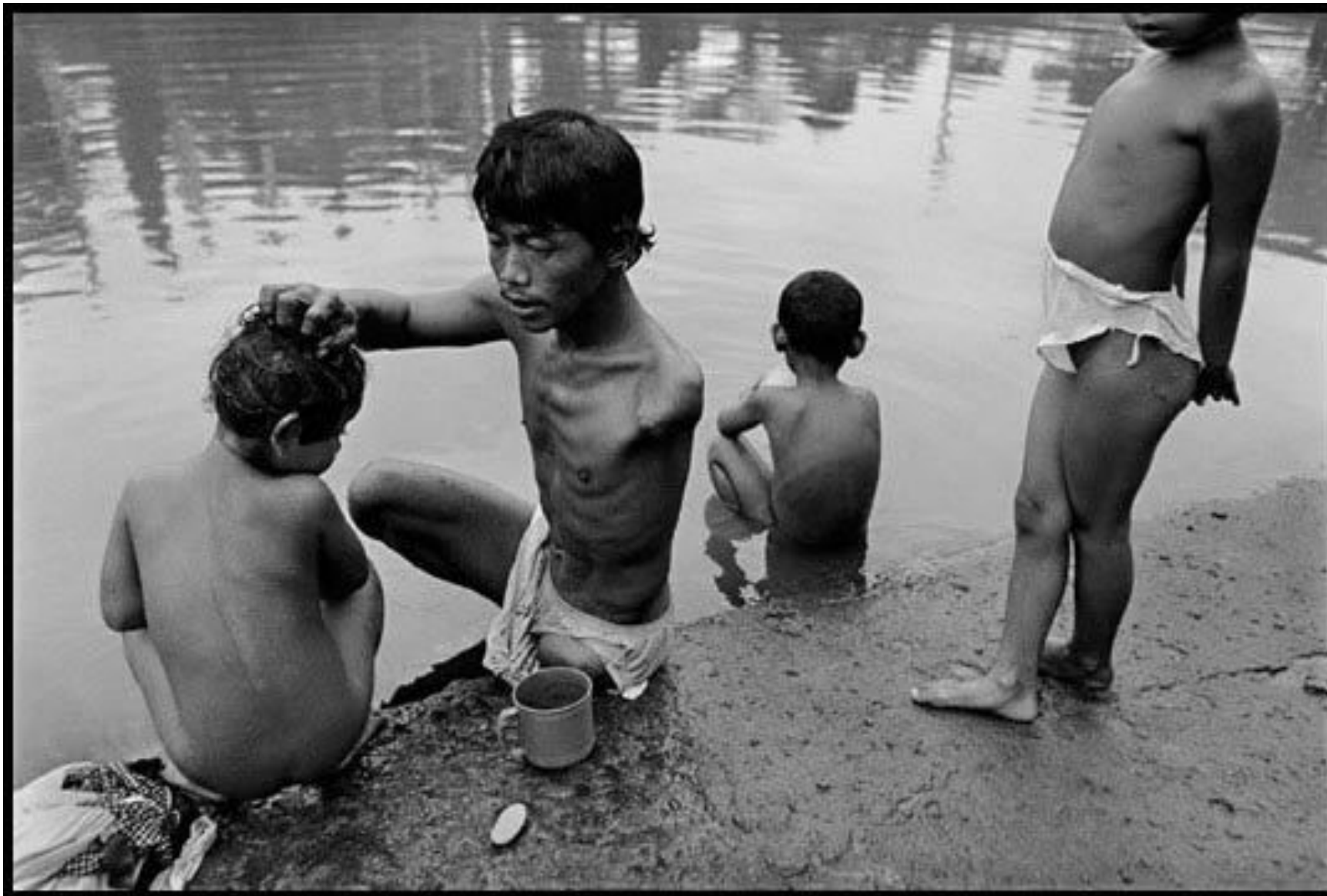
Индонезия, 1998 год