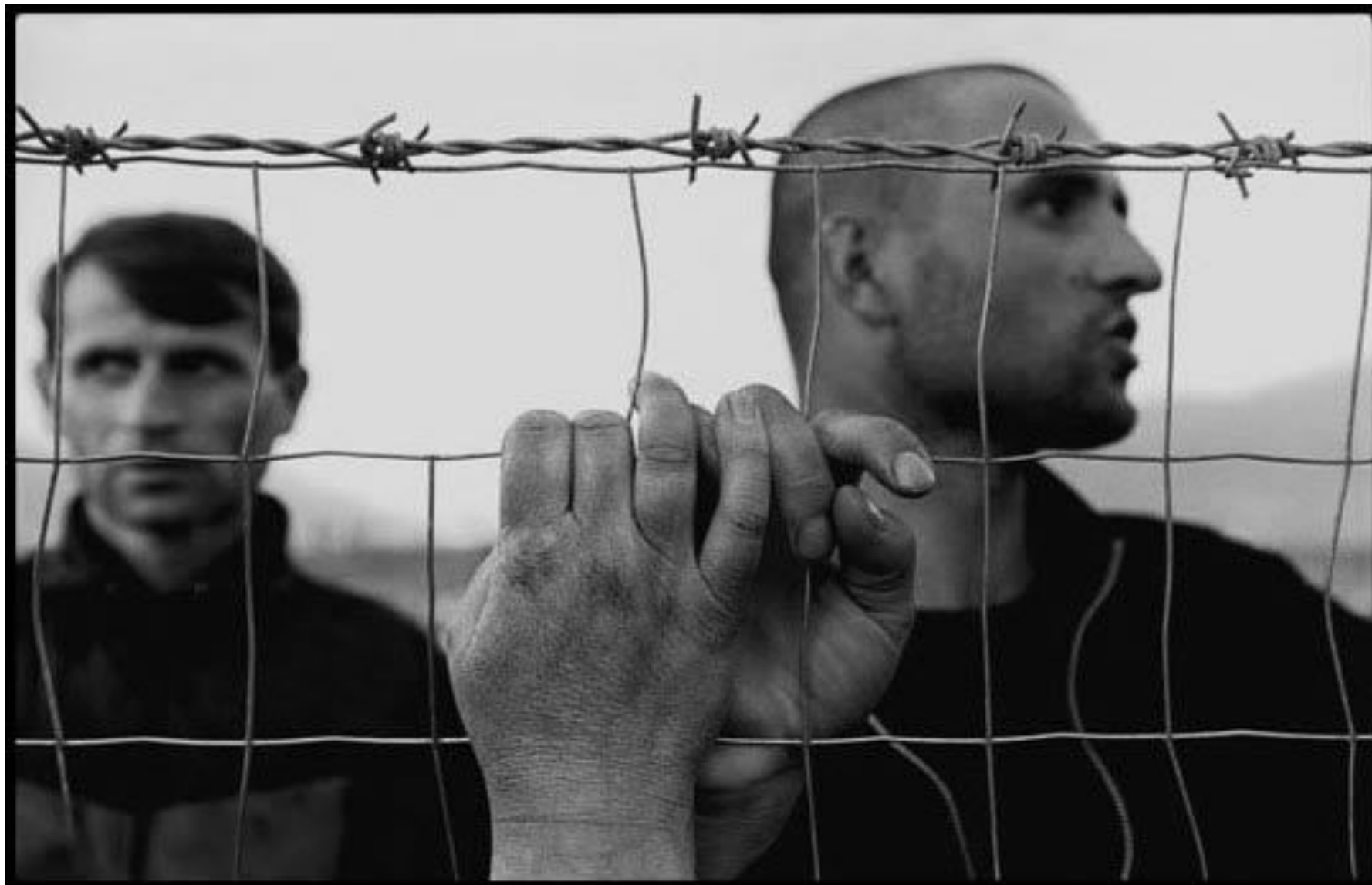
Албания, 1999 год