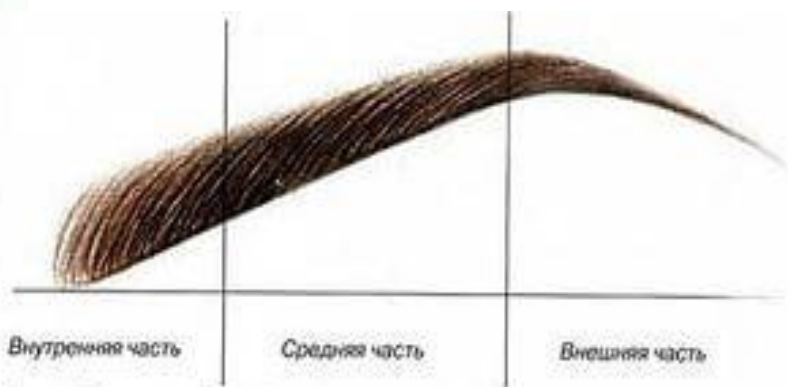
Рис. 1. Строение бровей