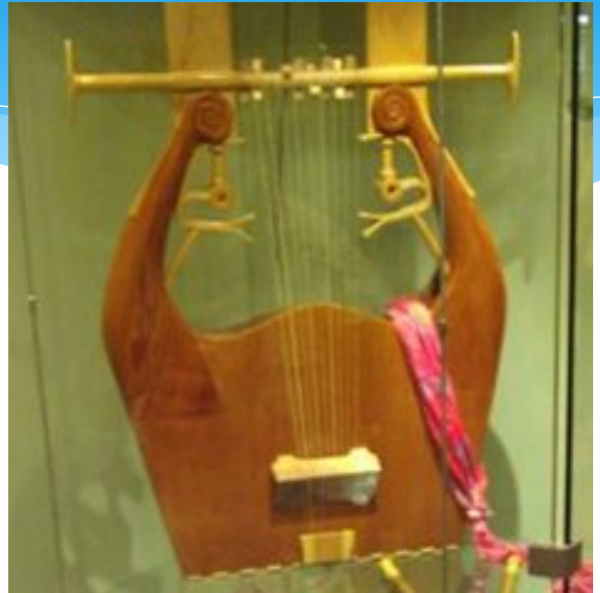
Кифара – подвиd лиры