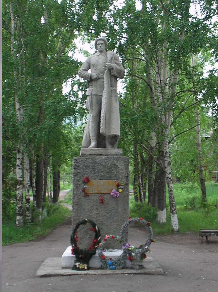
Памятник Даниилу Звереву