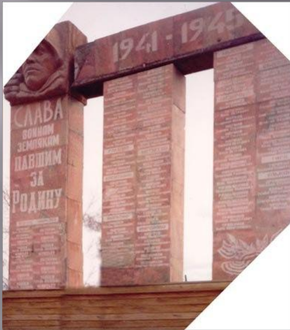
Мемориал односельчанам, погибшим в Великой Отечественной войне с. Верхне-Марково