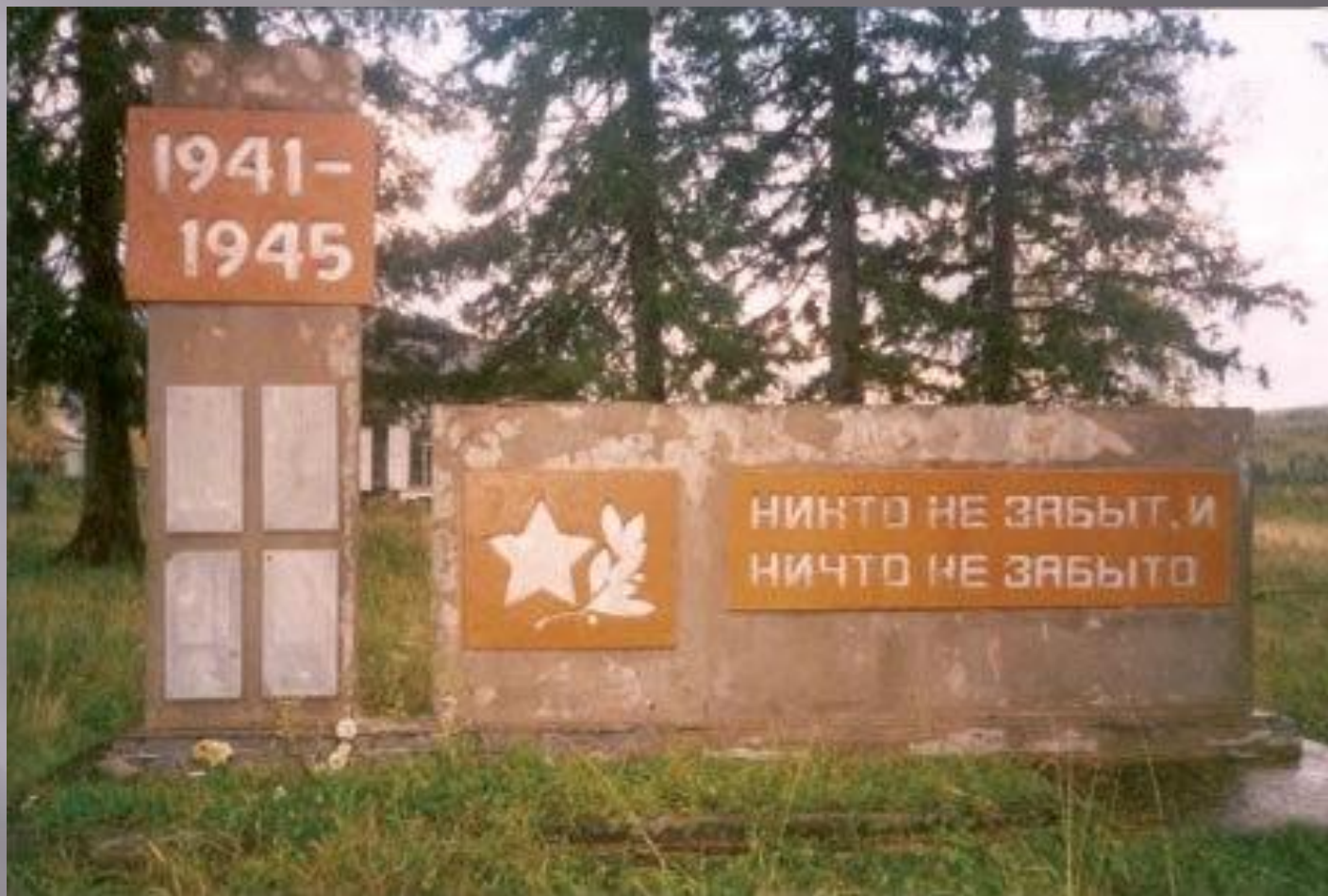
Мемориал односельчанам, павшим на полях сражений, в годы Великой Отечественной войны с. Орлинга