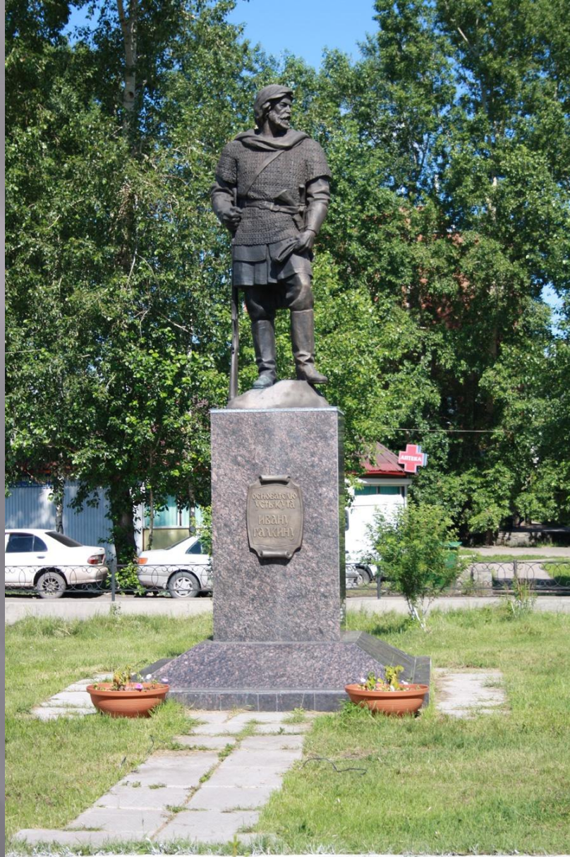
Памятник основателю Ивану Галкину