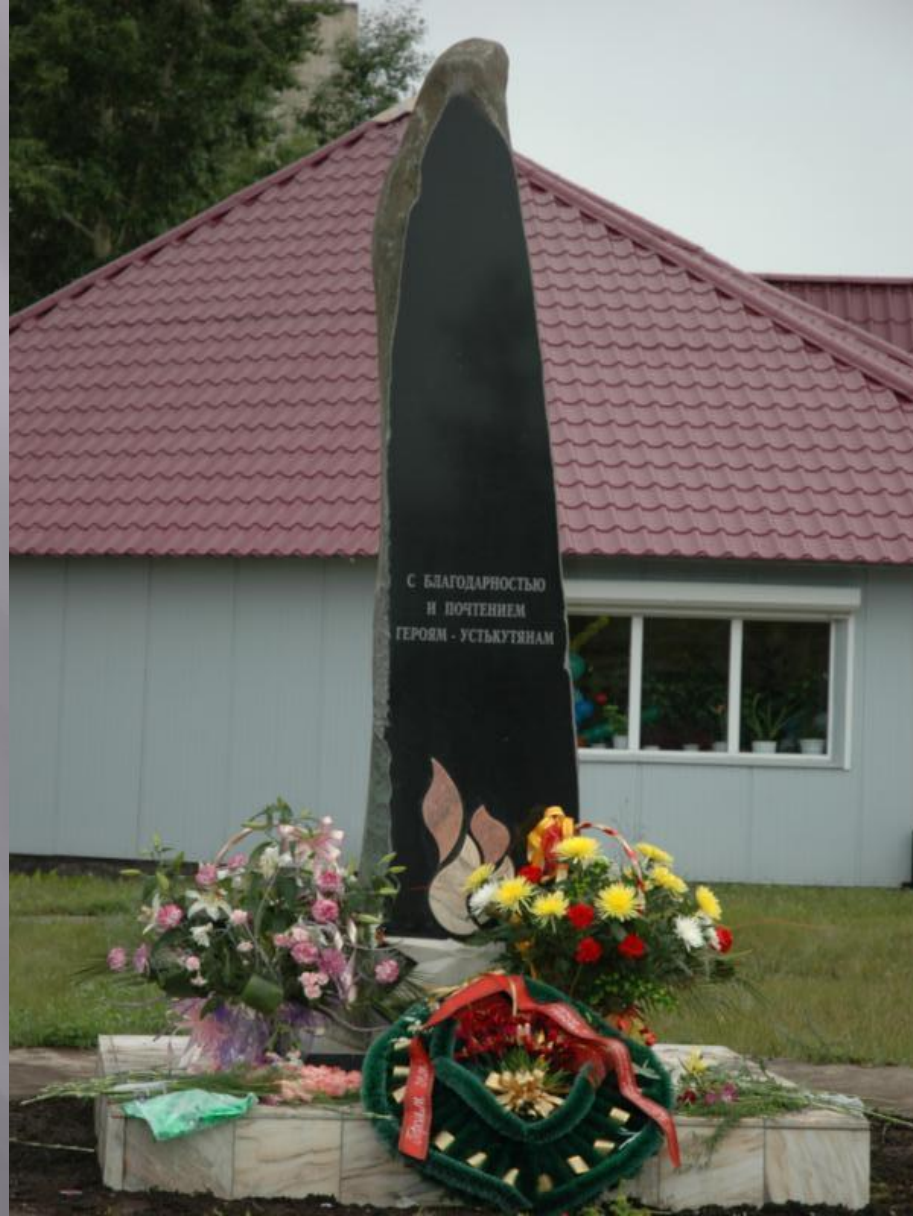
Стелла героям героям Великой Отечественной войны