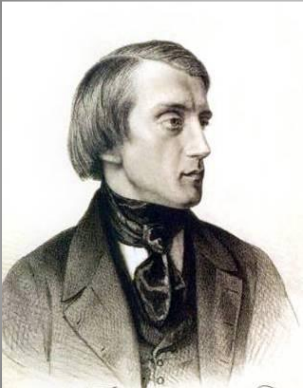
Виссарион Григорьевич Белинский