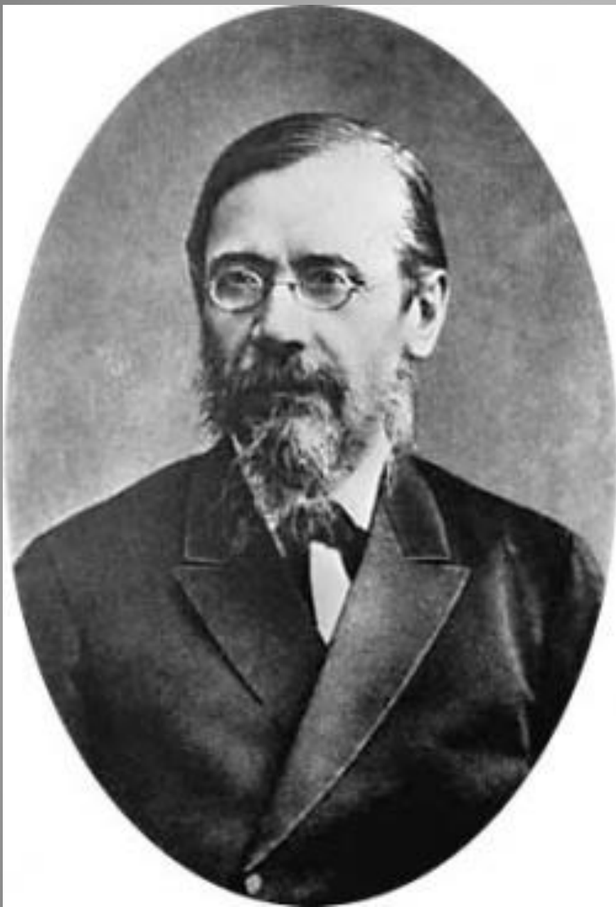
Василий Осипович Ключевский