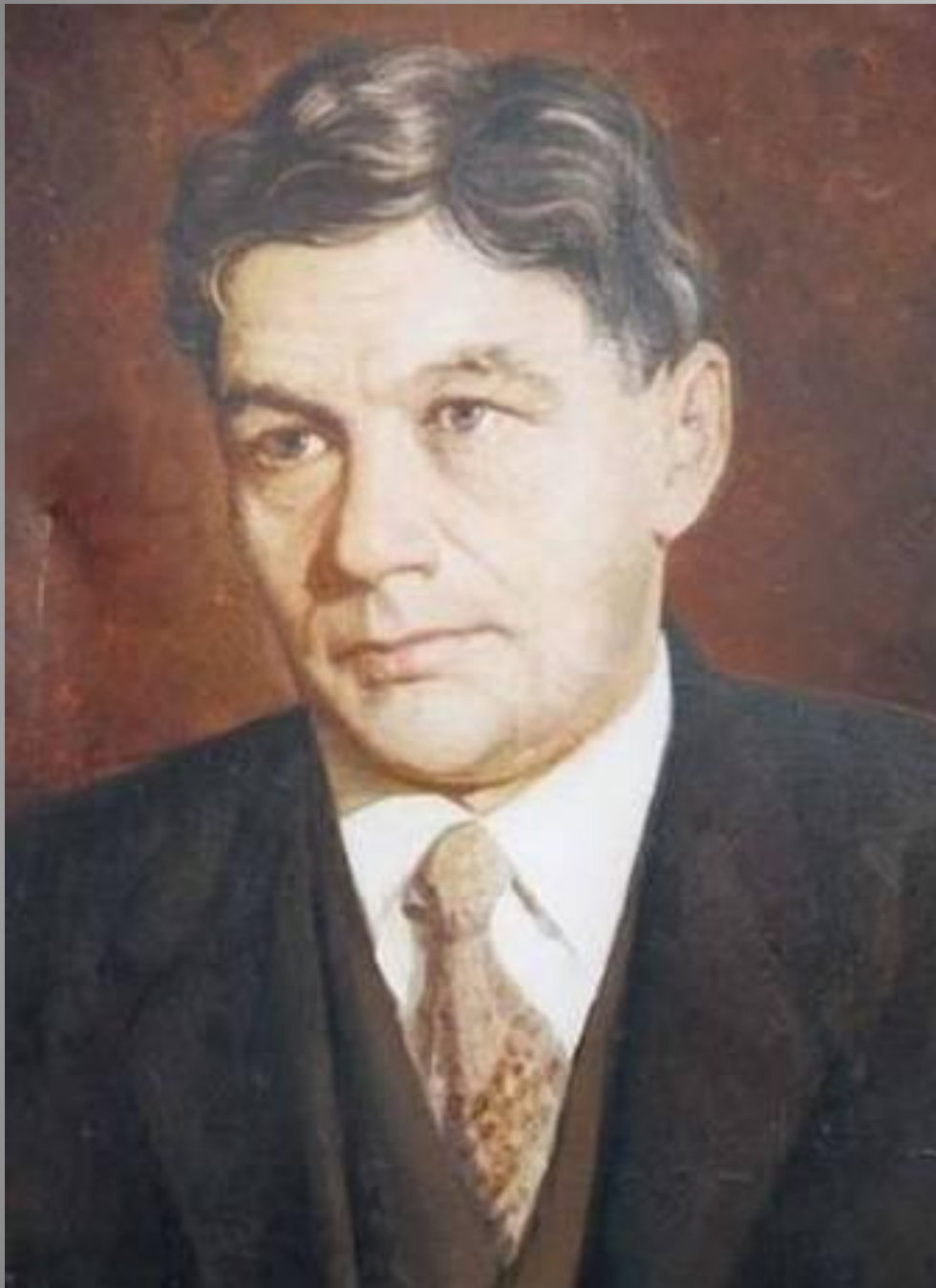
Александр Георгиевич Малышкин