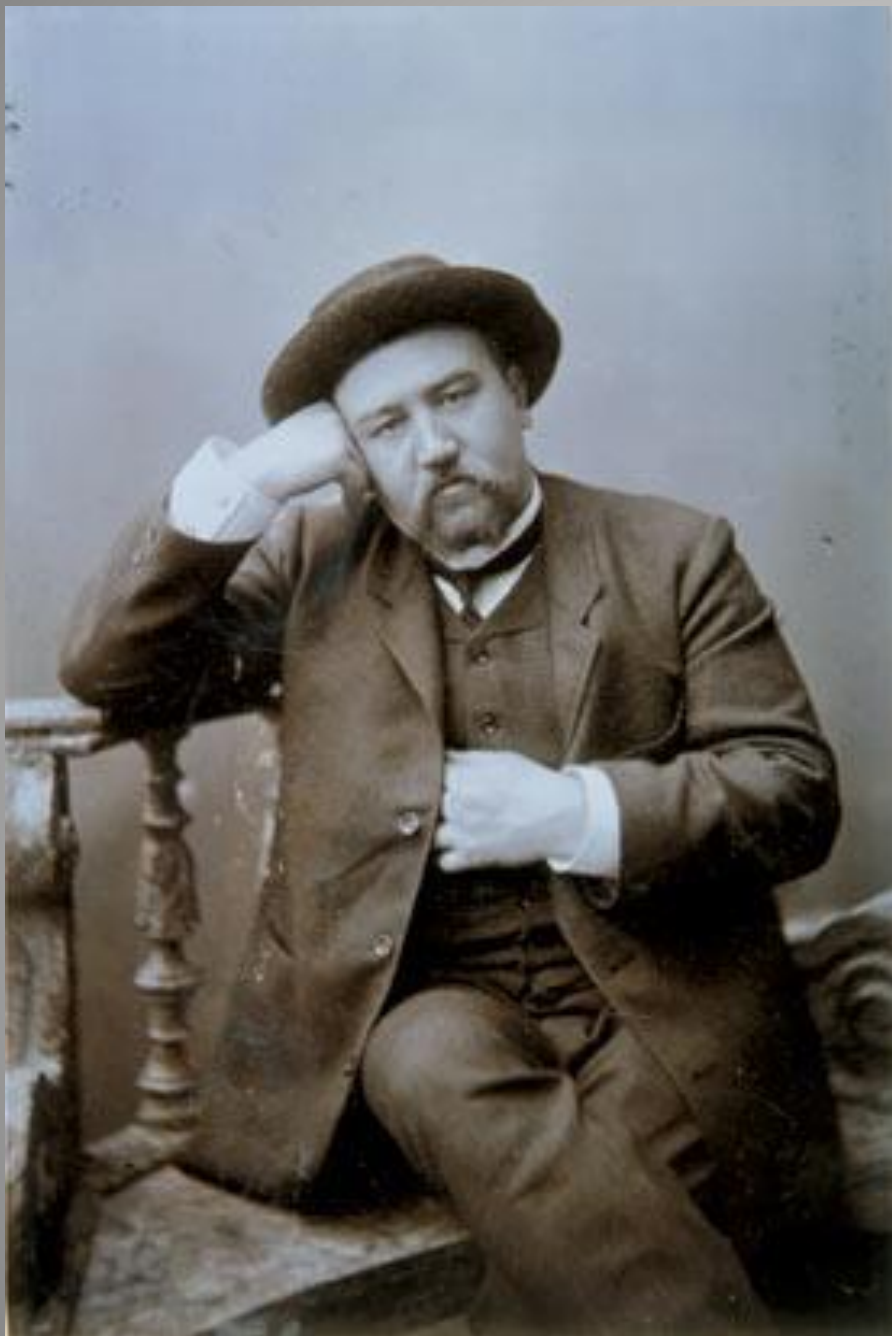
Александр Иванович Куприн