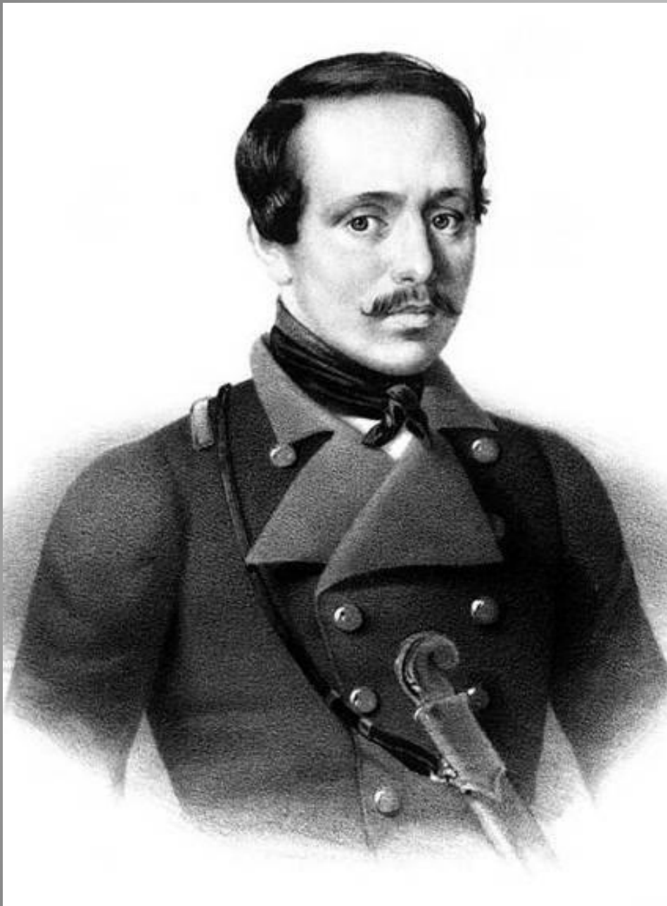
Михаил Юрьевич Лермонтов