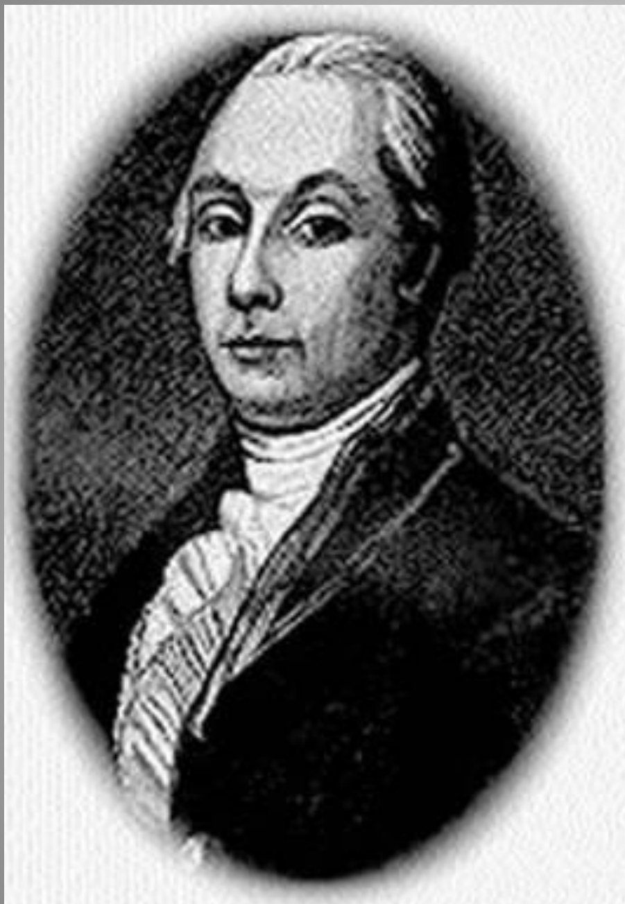
Александр Николаевич Радищев