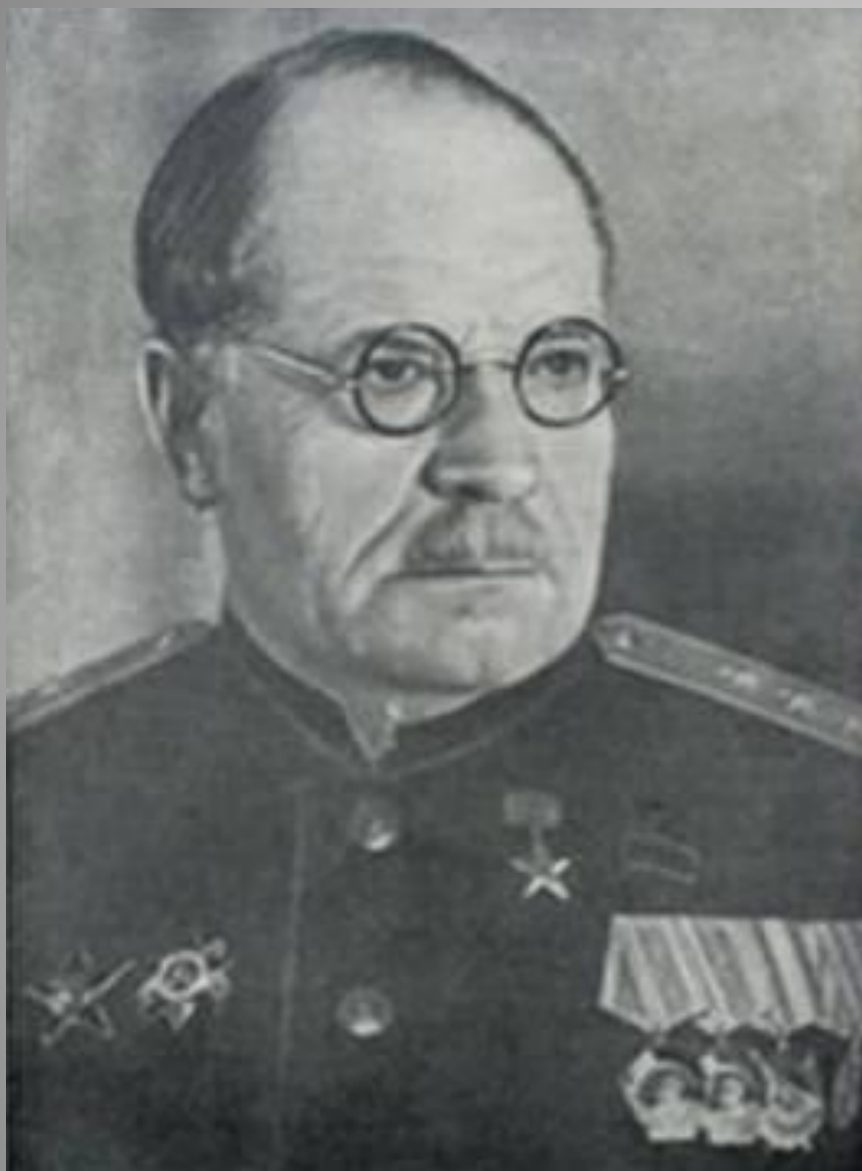
Николай Нилович Бурденко