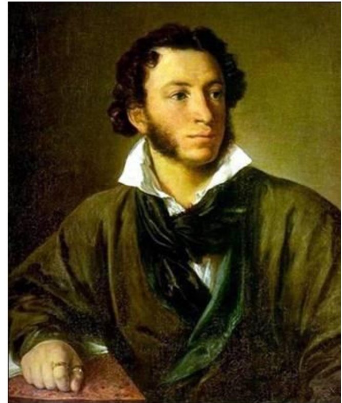
Василий Тропинин Портрет А.С. Пушкина