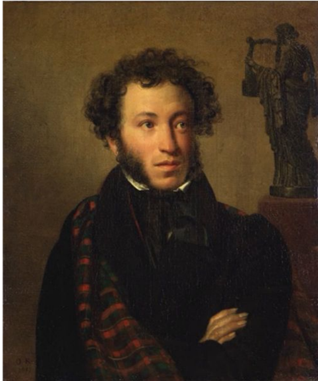
Орест Кипренский Портрет А.С.Пушкина