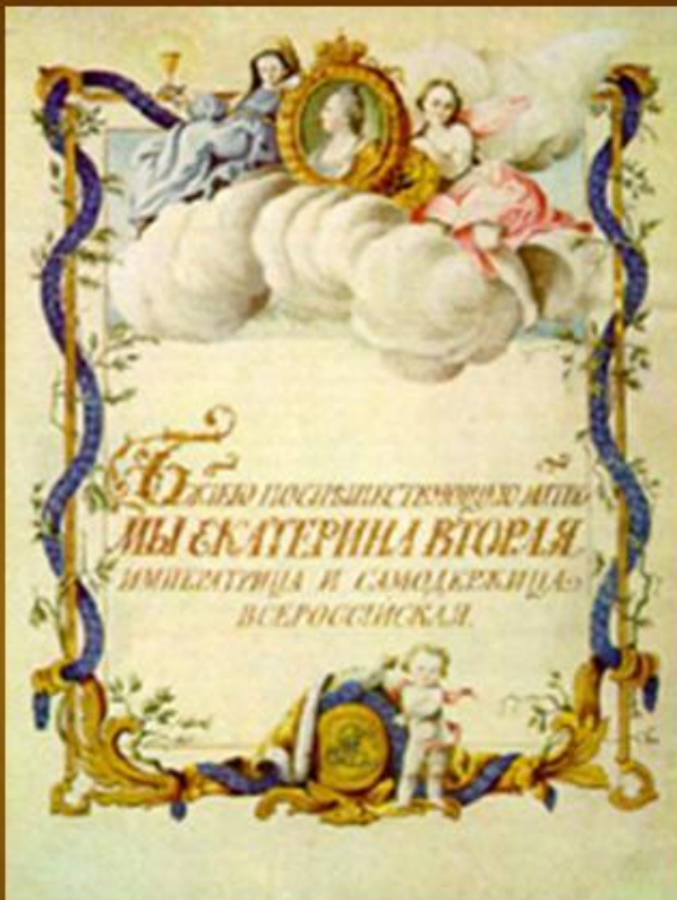
Титульный лист жалованной грамоты Екатерины II