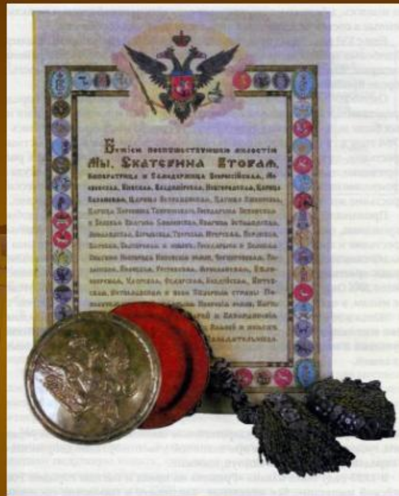
"Жалованная грамота дворянству", подписанная Екатериной II в 1785 году.