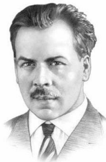
ВАВИЛОВ Николай Иванович 1887-1943