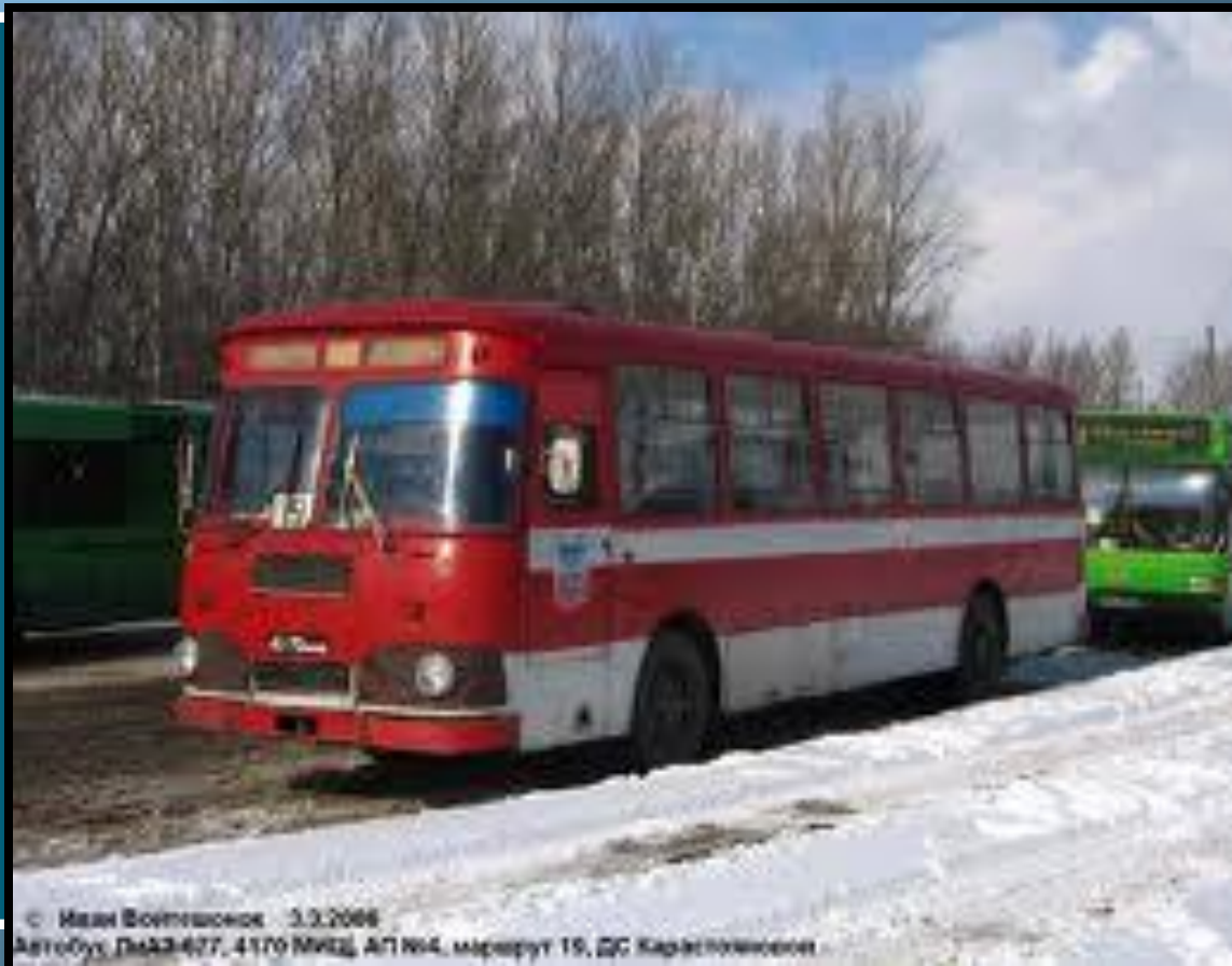
3.3.2006 Автобус ЛиАЗ-677, 4170 ММЗ, АП №4, маршрут 19, ДС Барнаулэнерго