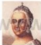
Екатерина II 1762-1796 гг. "просвещенный абсолютизм" 1762-1773 гг.

(в 30.07.1767 г. - в Москве; с февр. 1768 г. - в Санкт-Петербурге)