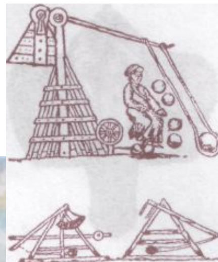
Метательная машина монголов