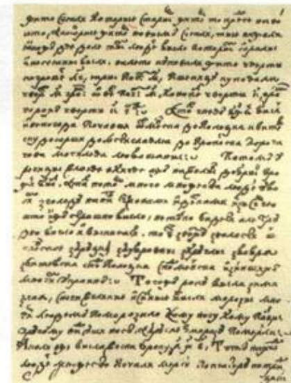
Старонка Барколабаўскага летапісу.