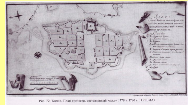
Рис. 72. Быхов. План крепости, составленный между 1778 и 1780 гг. (РГБИА)