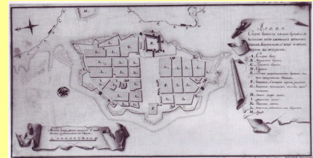
Рис. 72. Быхов. План крепости, составленный между 1778 и 1780 гг. (РГБИА)