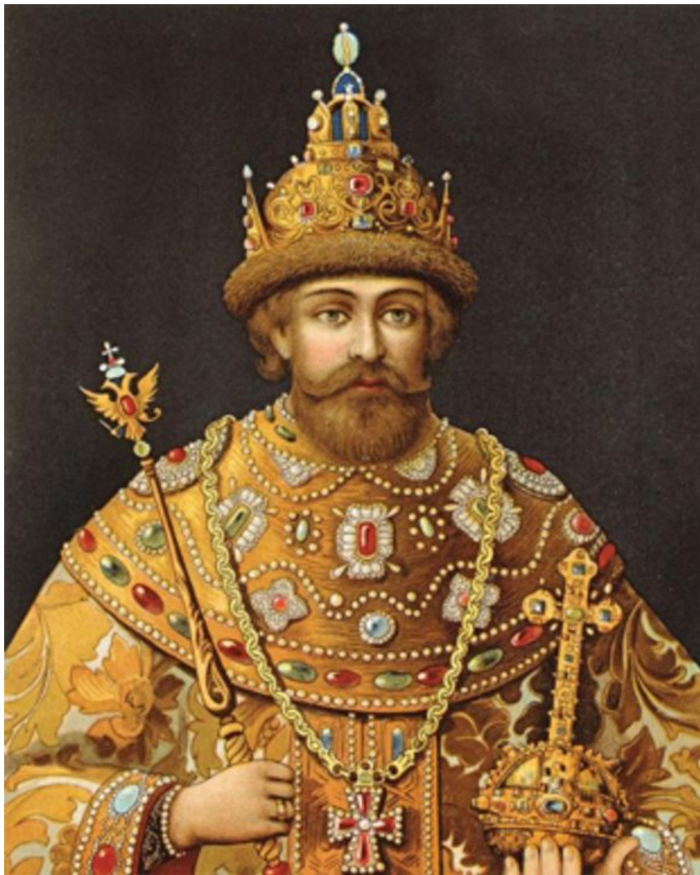
Царь Михаил Романов