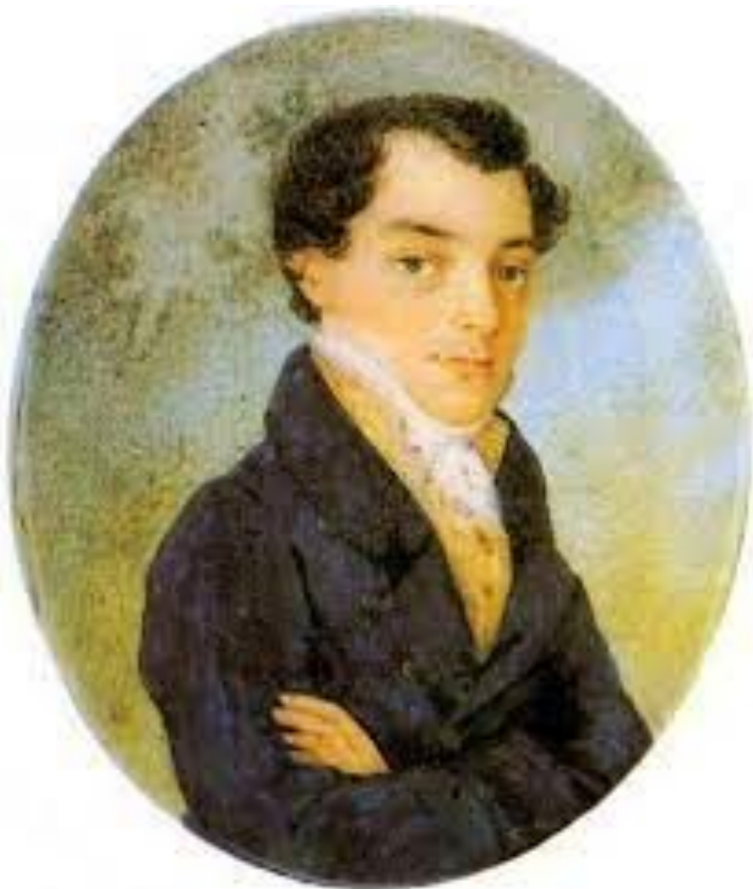
Кондратий Фёдорович Рылов