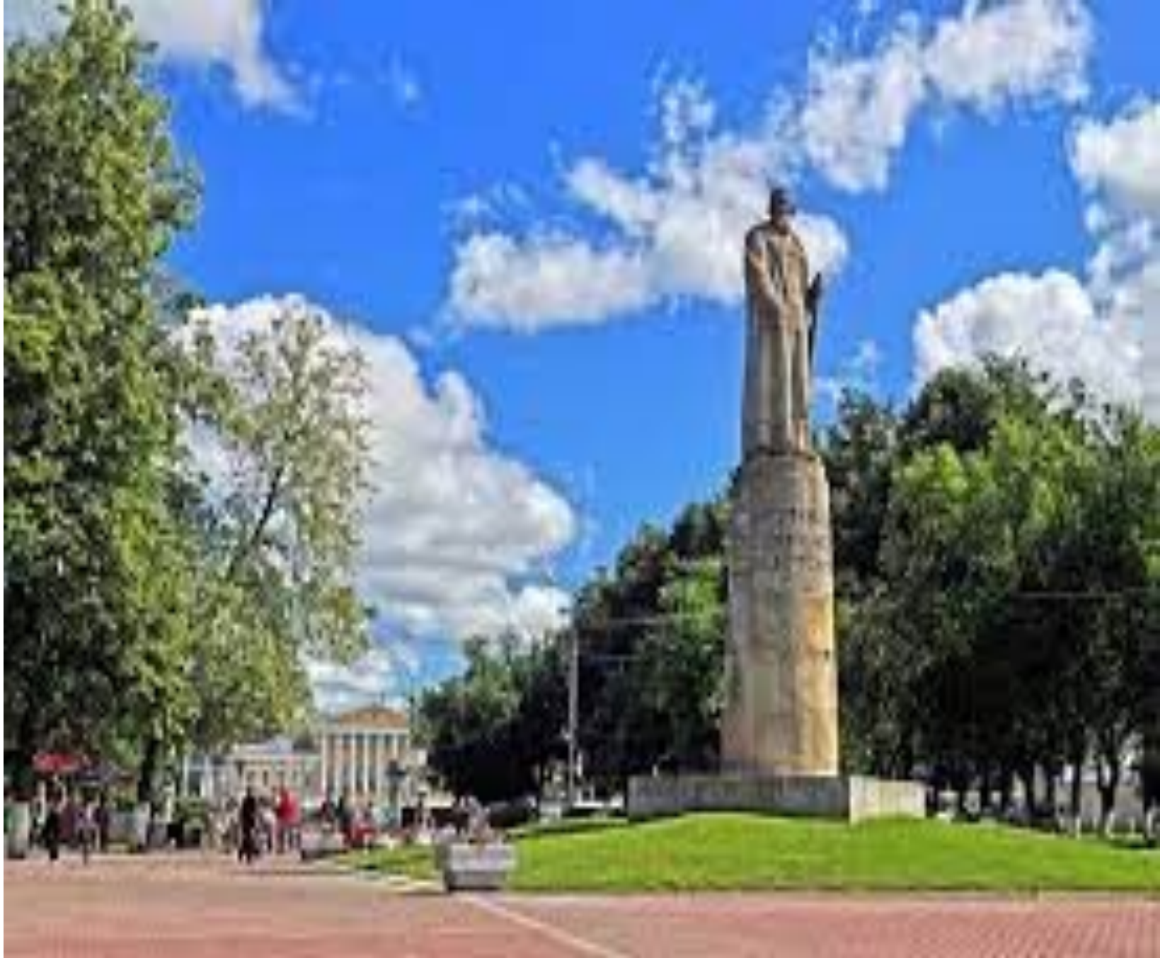
Современный памятник Ивану Сусанину в Костроме