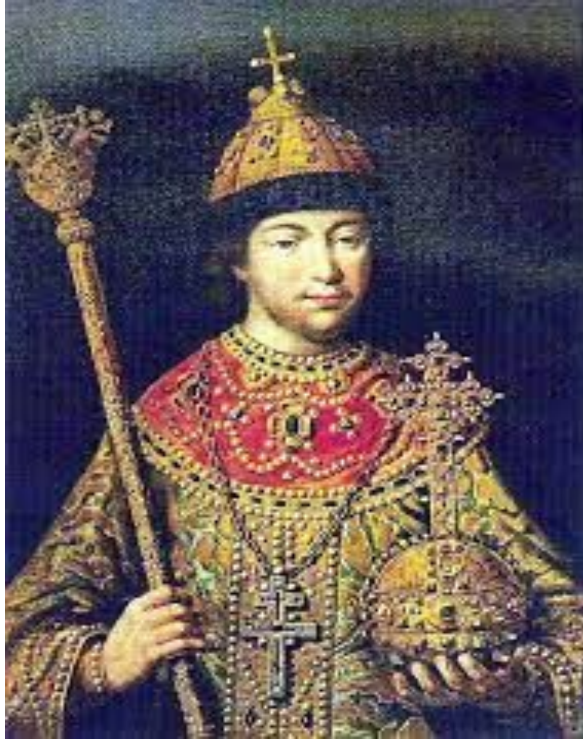
Царь Михаил Романов