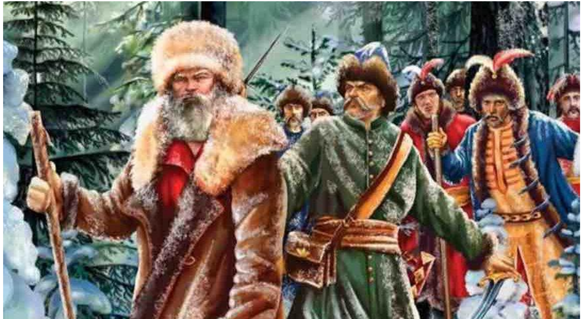
Иван Сусанин и поляки