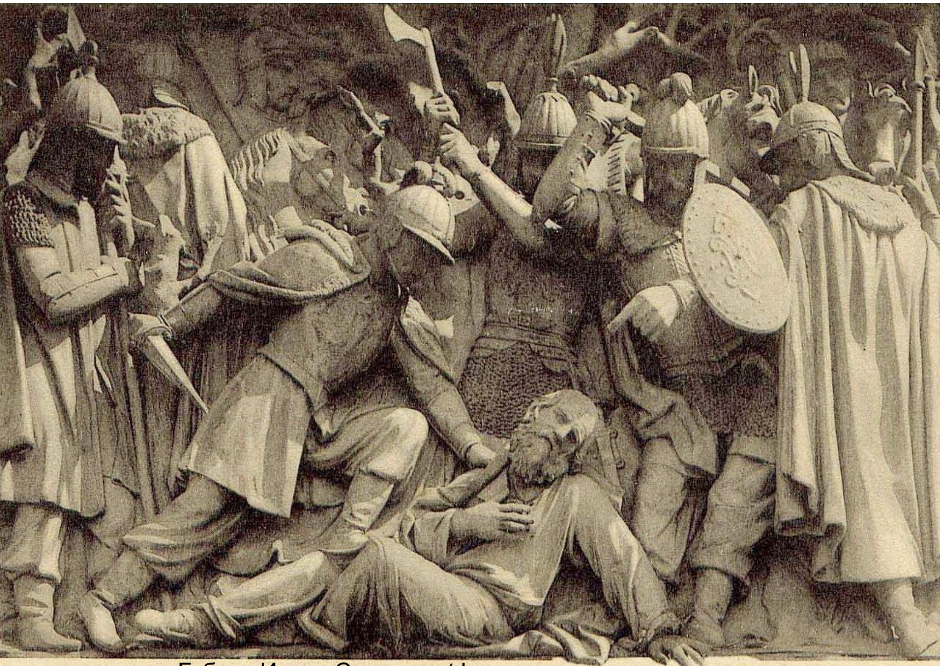
Гибель Ивана Сусанина (фрагмент памятника)