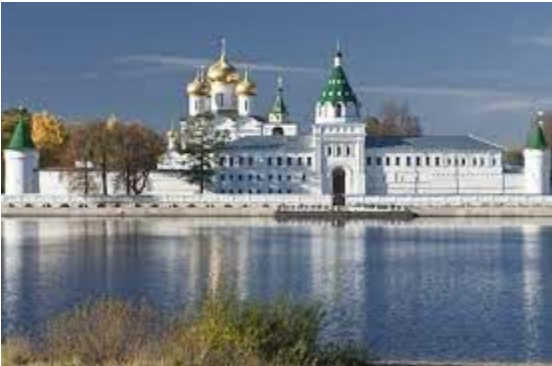
Свято-Троицкий Ипатьевский мужской монастырь города Костромы