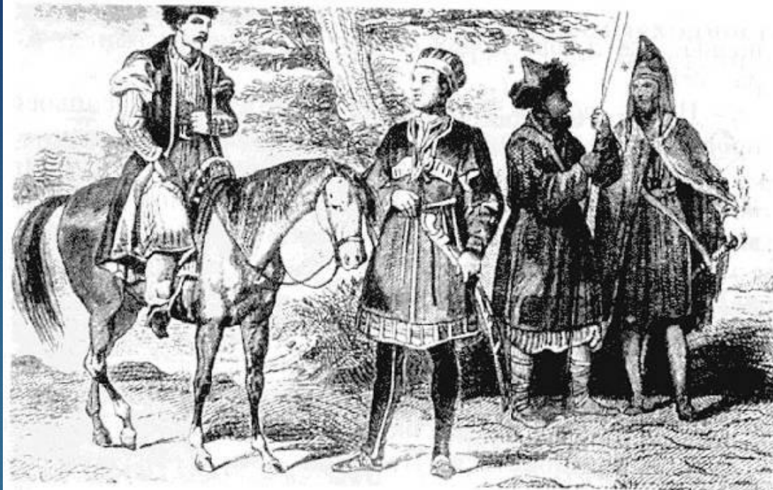
Татарские народные типы. Гравюра XIX века