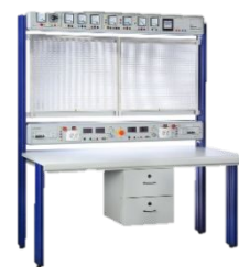
Лабораторный стенд для подготовки электромонтажников и электромонтеров