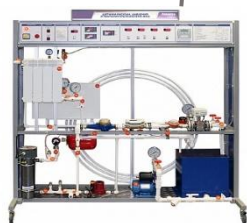
Лабораторный стенд "Датчики расхода, давления и температуры в системе ЖКХ"