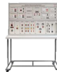
Лабораторный стенд «Рабочее место электромонтажника»