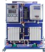
Лабораторный стенд «Энергосберегающие технологии в сфере ЖКХ»