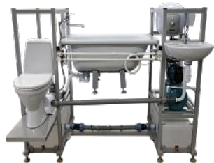
Лабораторный стенд "Монтаж сантехнического оборудования"