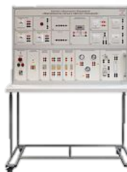
Лабораторный стенд «Рабочее место электромонтажника»