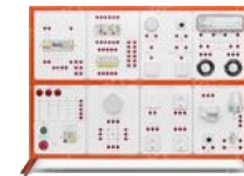
Лабораторный стенд «Электромонтаж в жилых и офисных помещениях»