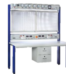
Лабораторный стенд для подготовки электромонтажников и электриков