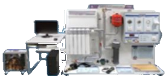
Лабораторный комплекс «Энергоаудит в сфере ЖКХ»