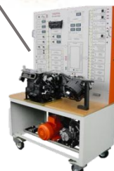
Лабораторный стенд «Электрооборудование»