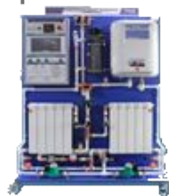
Лабораторный стенд «Энергосберегающие технологии в сфере ЖКХ»