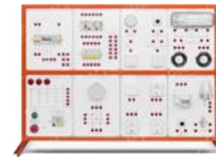
Лабораторный стенд «Электромонтаж в жилых и офисных помещениях»