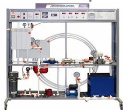
Лабораторный стенд "Датчики расхода, давления и температуры в системе ЖКХ"