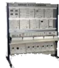
Учебный стенд «Силовая электротехника»