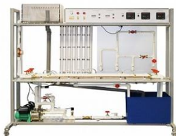
Типовой комплект учебного оборудования «Гидравлические сопротивления водопроводной арматуры»