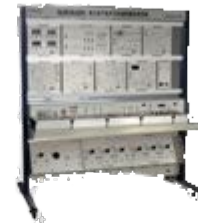
Учебный стенд «Силовая электротехника»