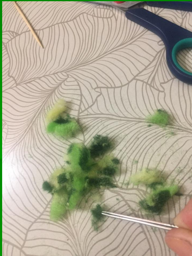
Нарезаем шерсть мелкими кусочками