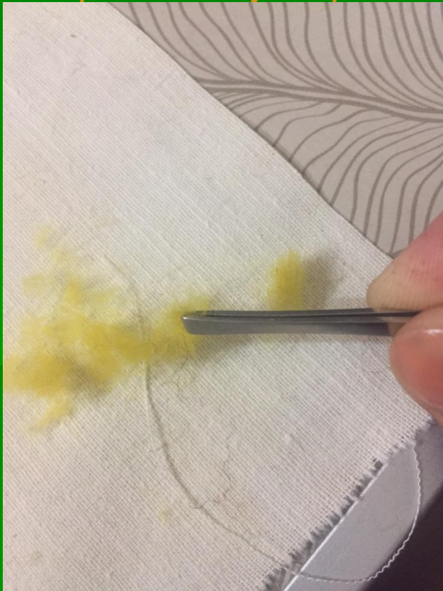
Нарезаем жёлтую шерсть