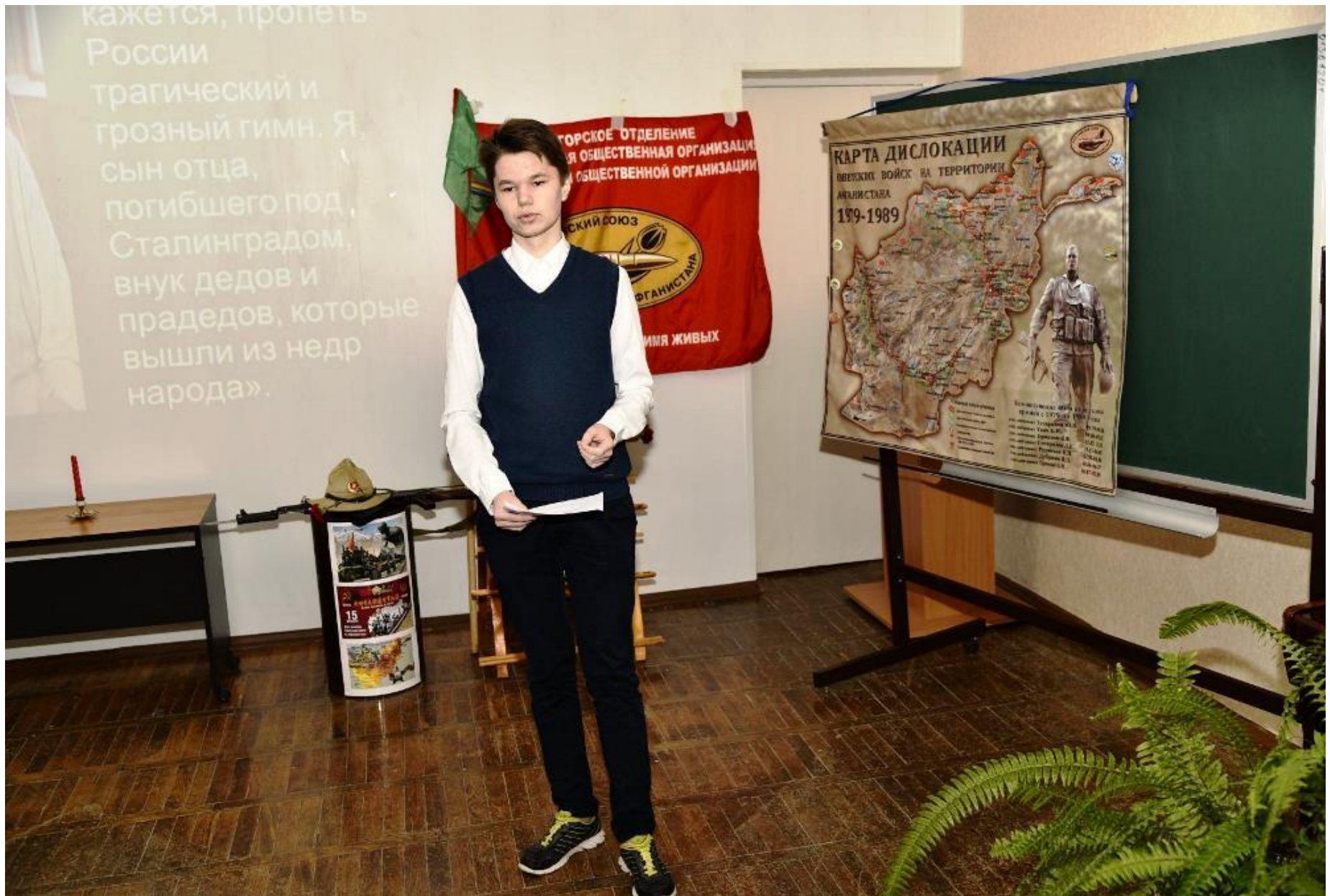
Гимназия № 1 конференция по книге «Седой солдат»