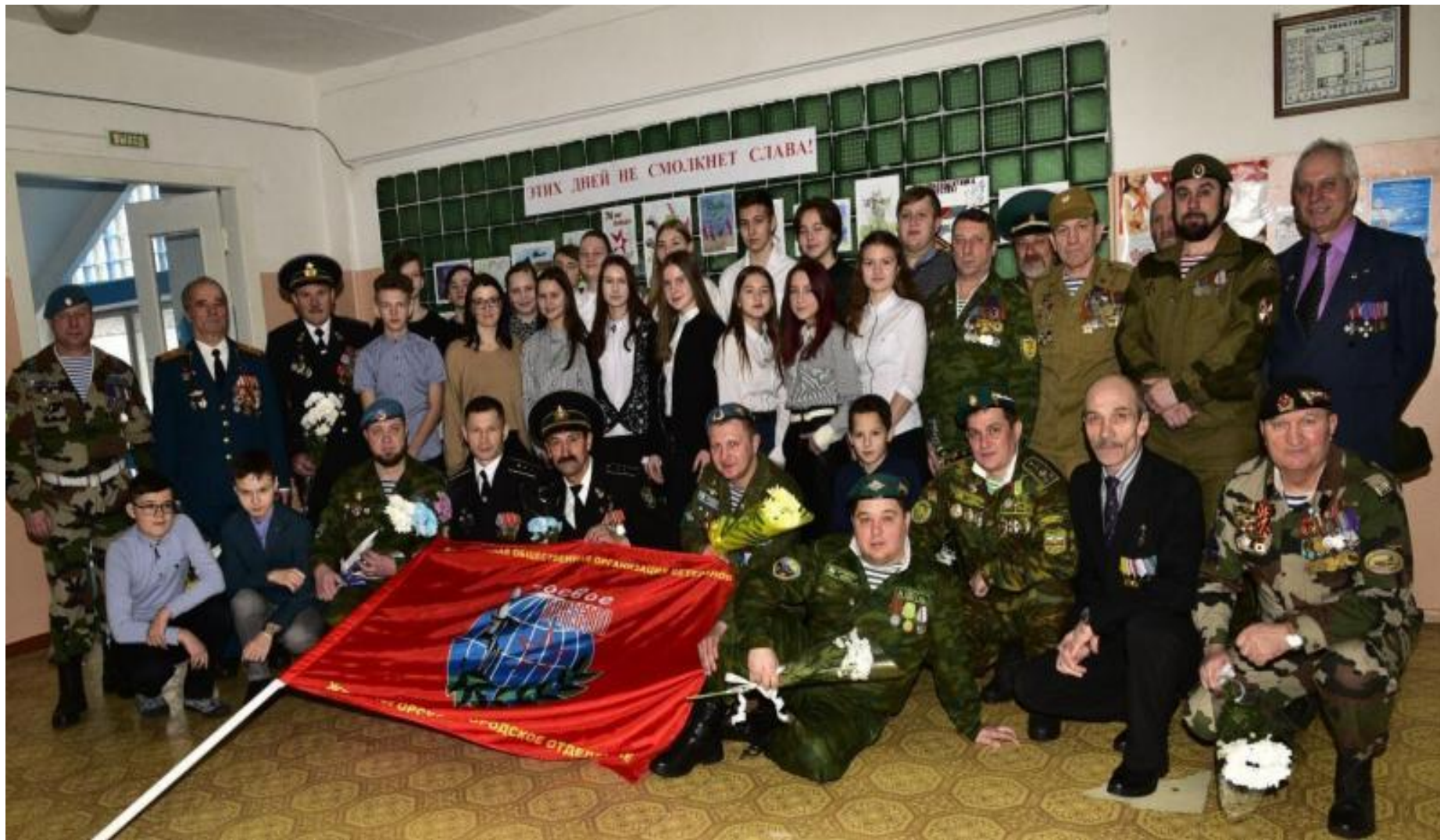
«Ветеранский десант» 14 февраля 2020 г. Уроки мужества в Средней школе № 3