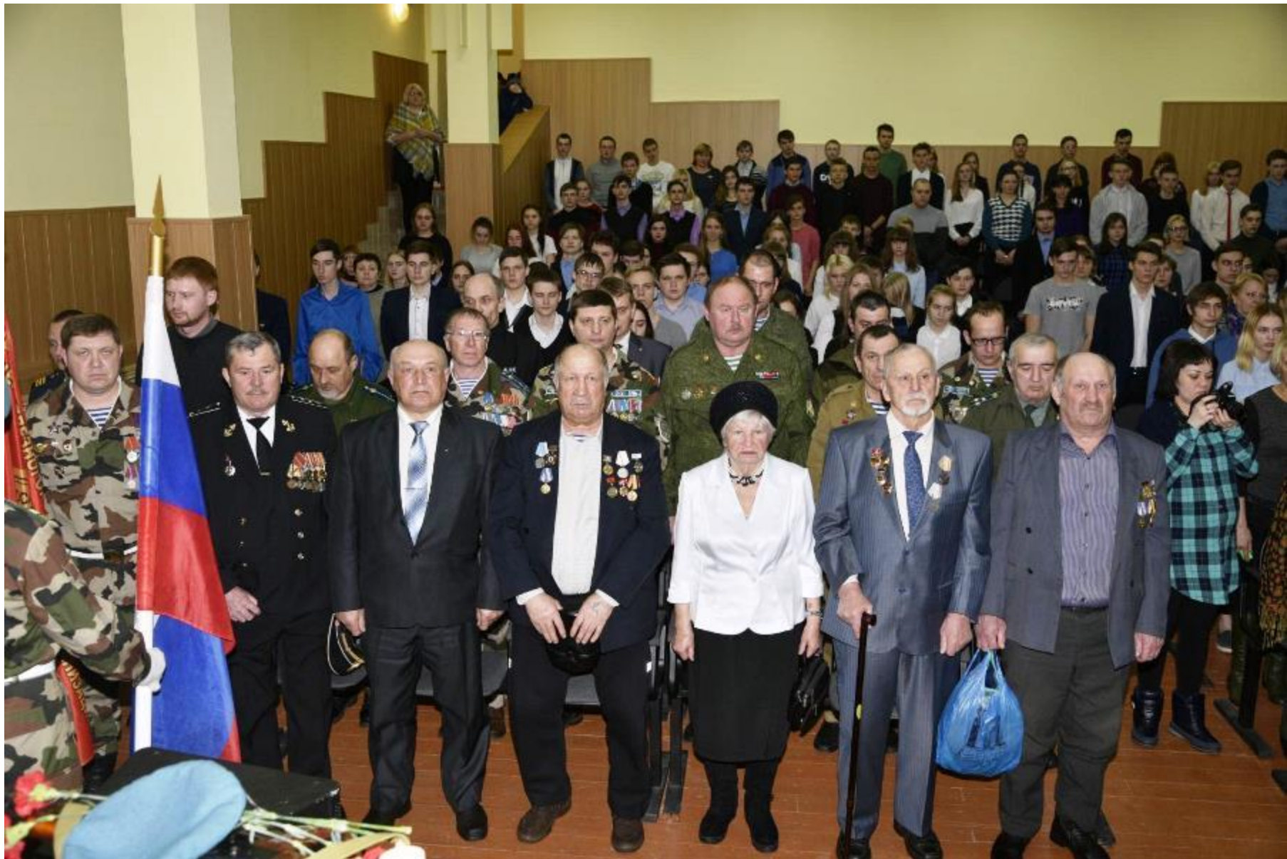
13 школа «День памяти Псковских десантников «Рота уходит на небо...»