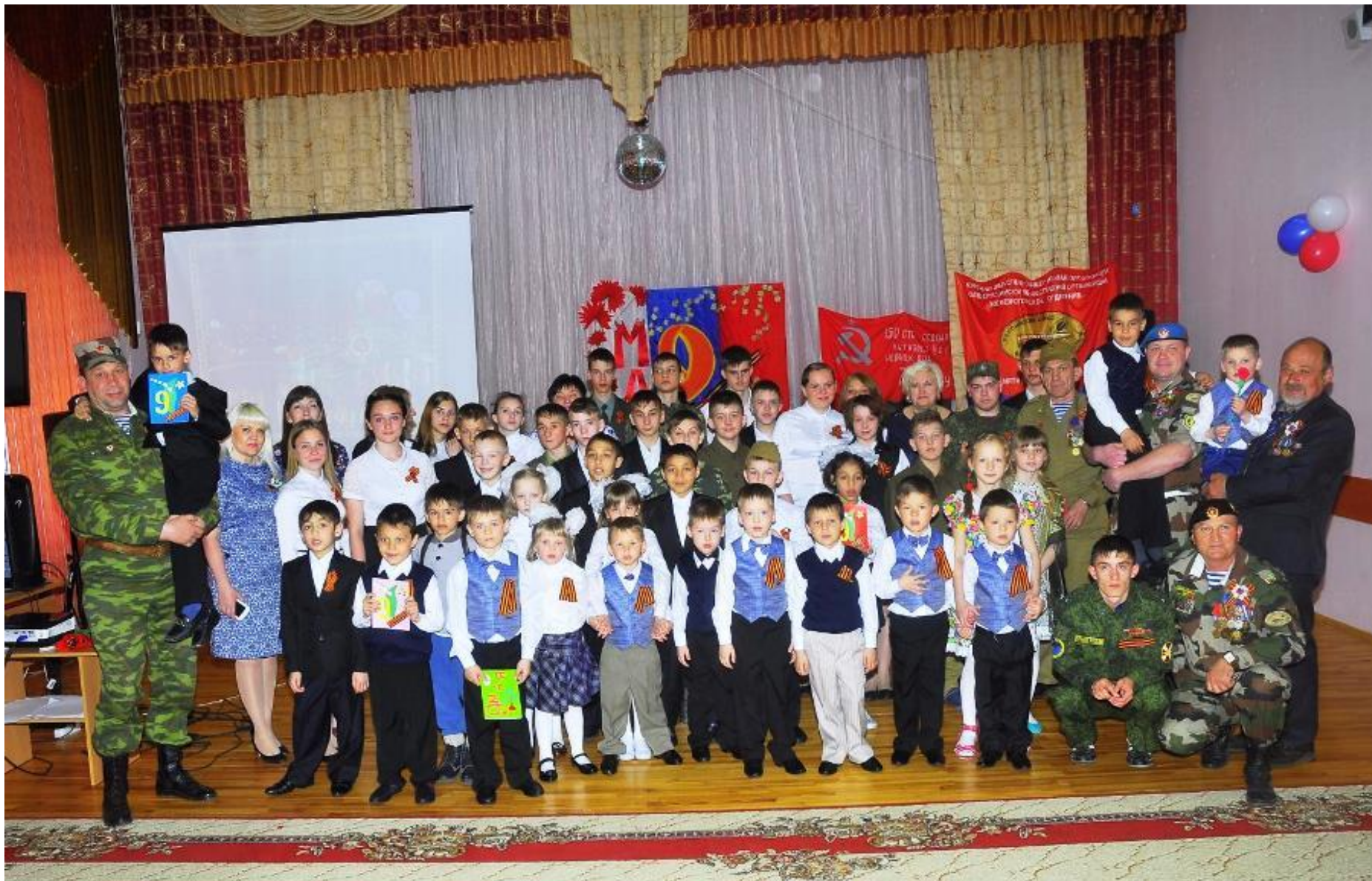
Традиционная поездка в Новоандросовский детский дом