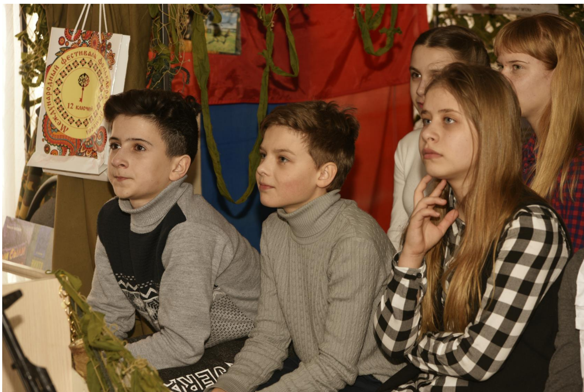
Экскурсия в «Музей воинской славы»