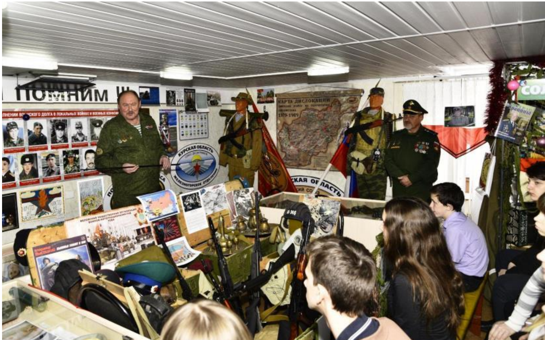
Тема экскурсии «Армия СССР в Афганистане»