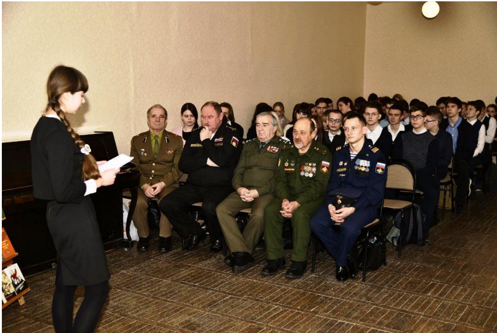
Конференция по книге «Седой солдат»