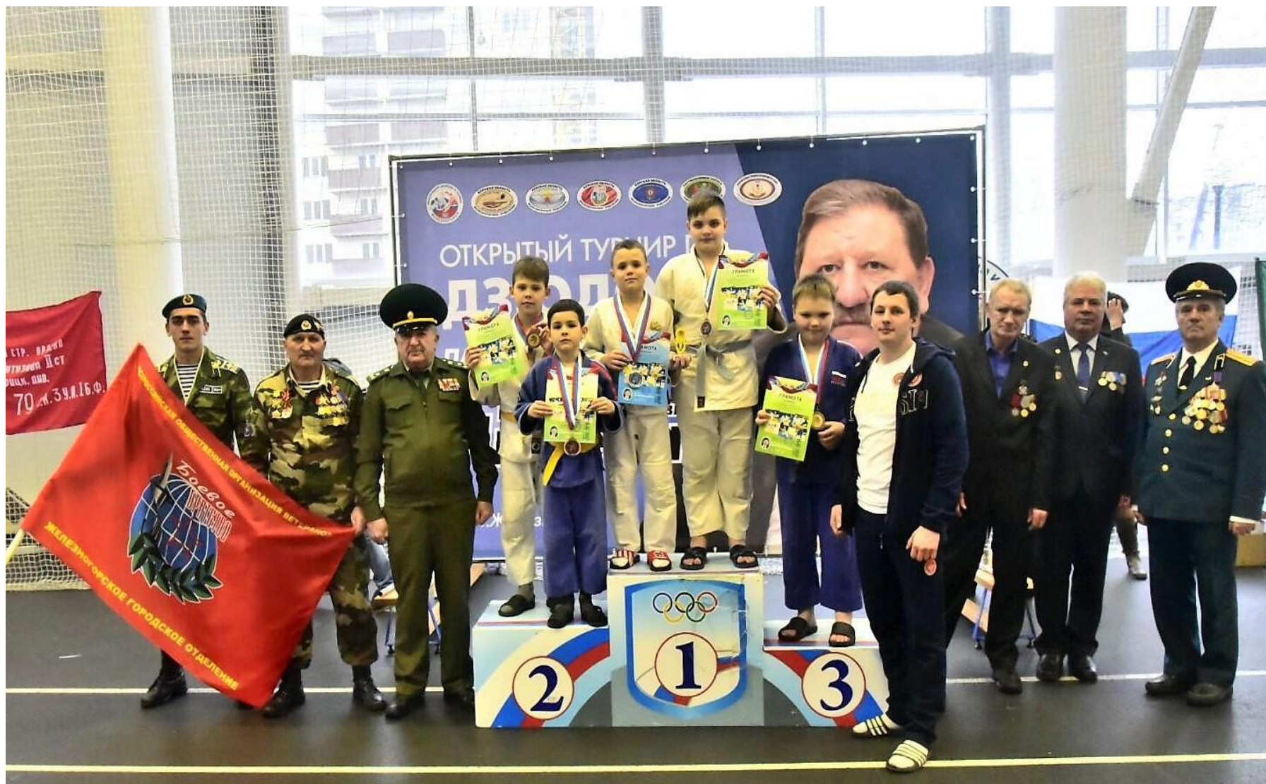
Открытый 5 юношеский турнир по дзюдо - 21 февраля 2020 г.