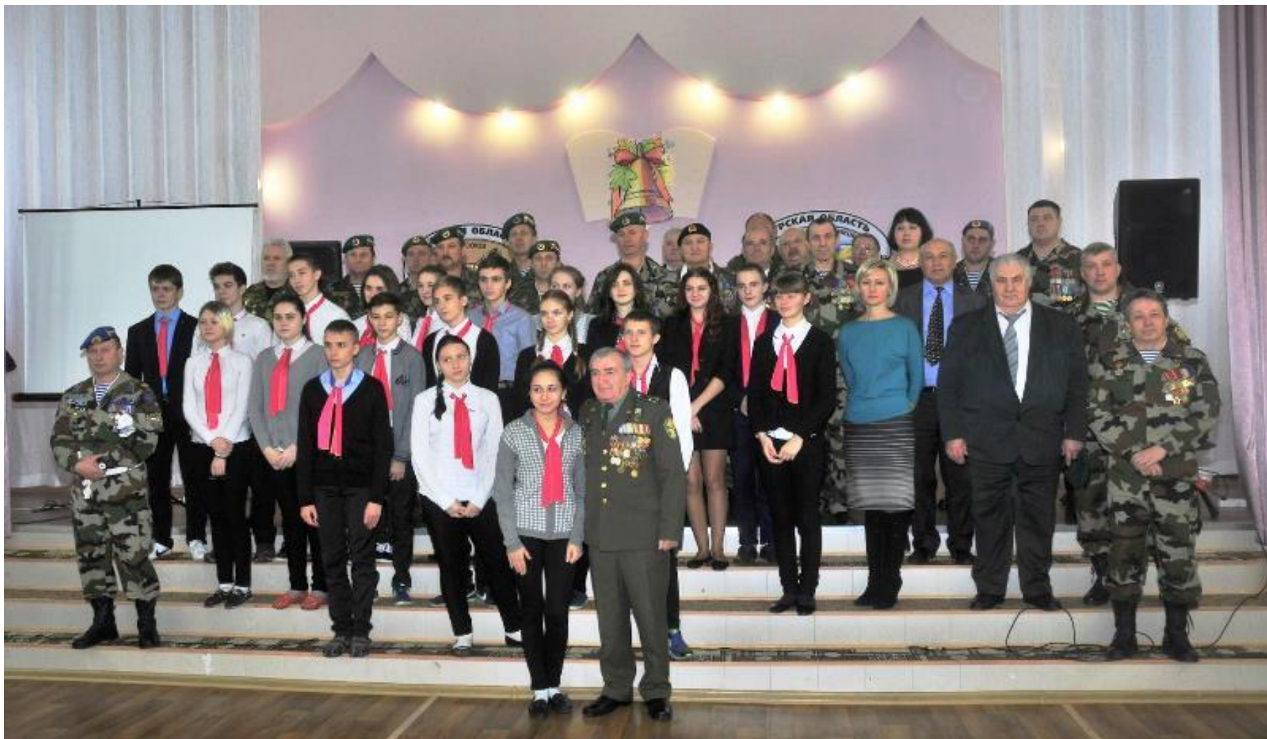
7 школа 2020 г.