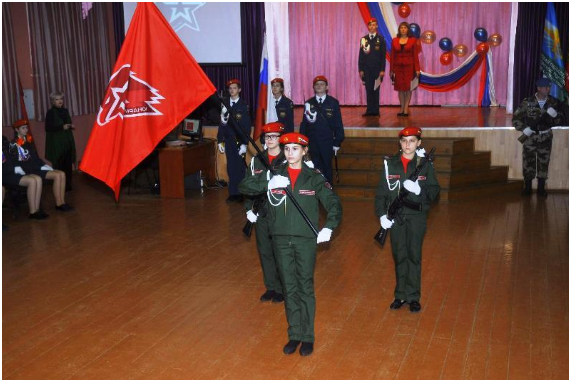
Железногорский отряд «ЮНАРМИЯ» СОШ № 8