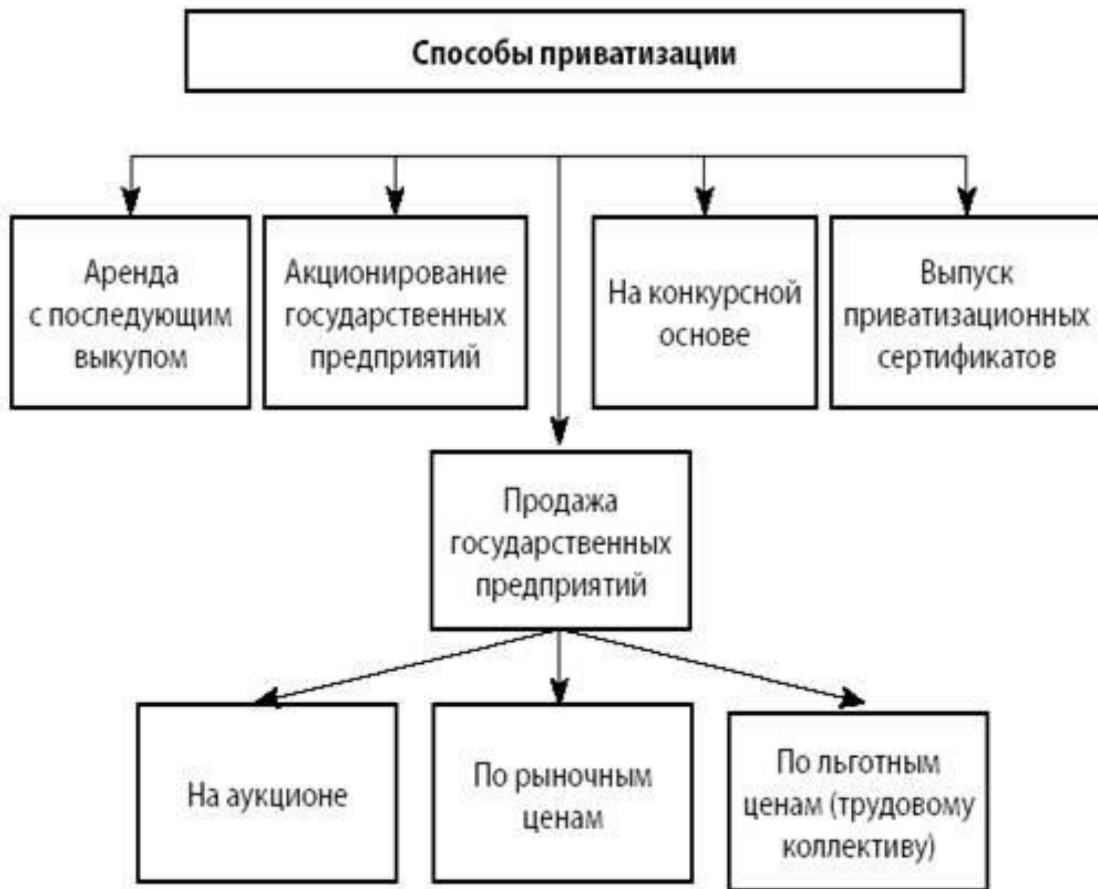
Схема 4.12. Способы приватизации