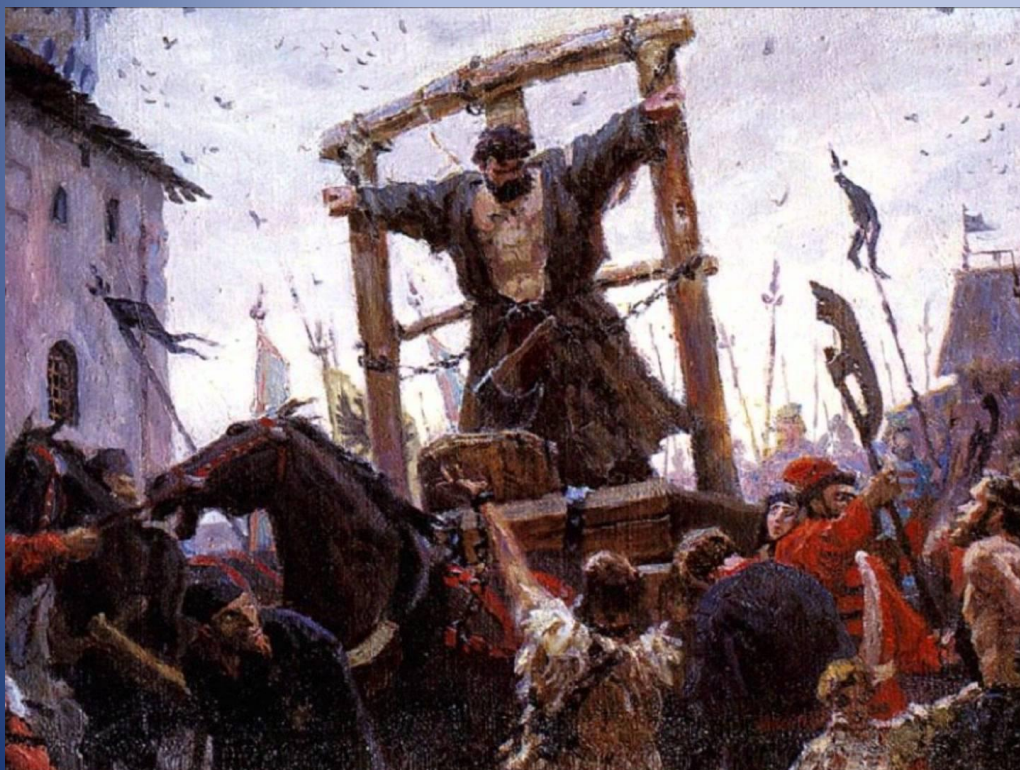
"Разина везут!" Эскиз к картине "Степан Разин".