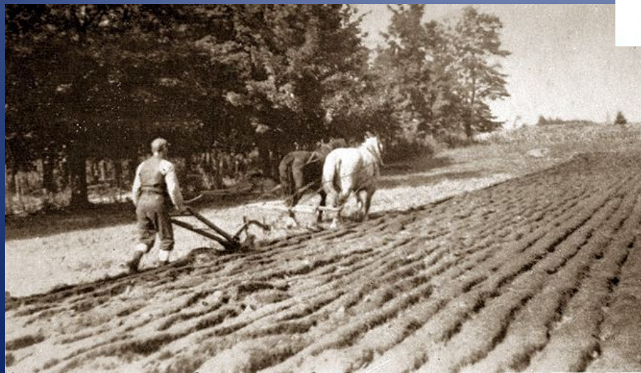
Isle D'Orléans Ploughman