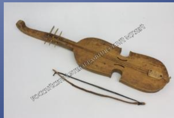
Сигудэк. Создатель – С. Налимов