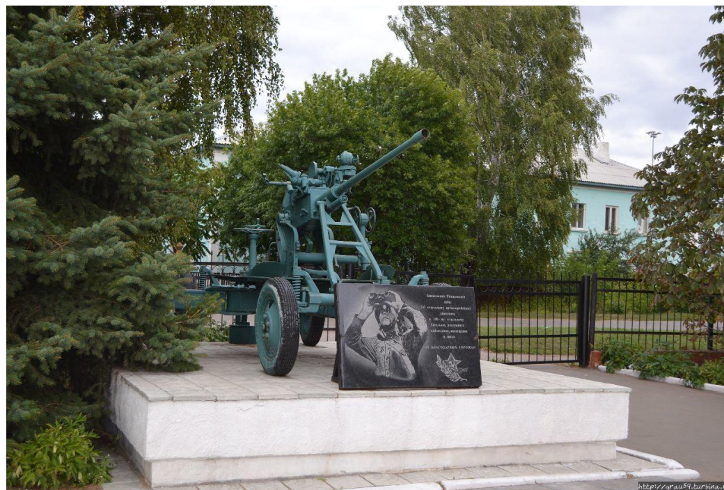
Мемориальная доска на здании вокзала станции Ртищево-I, посвящённая 100-му отдельному батальону ВНОС и 243-му ОЗАД