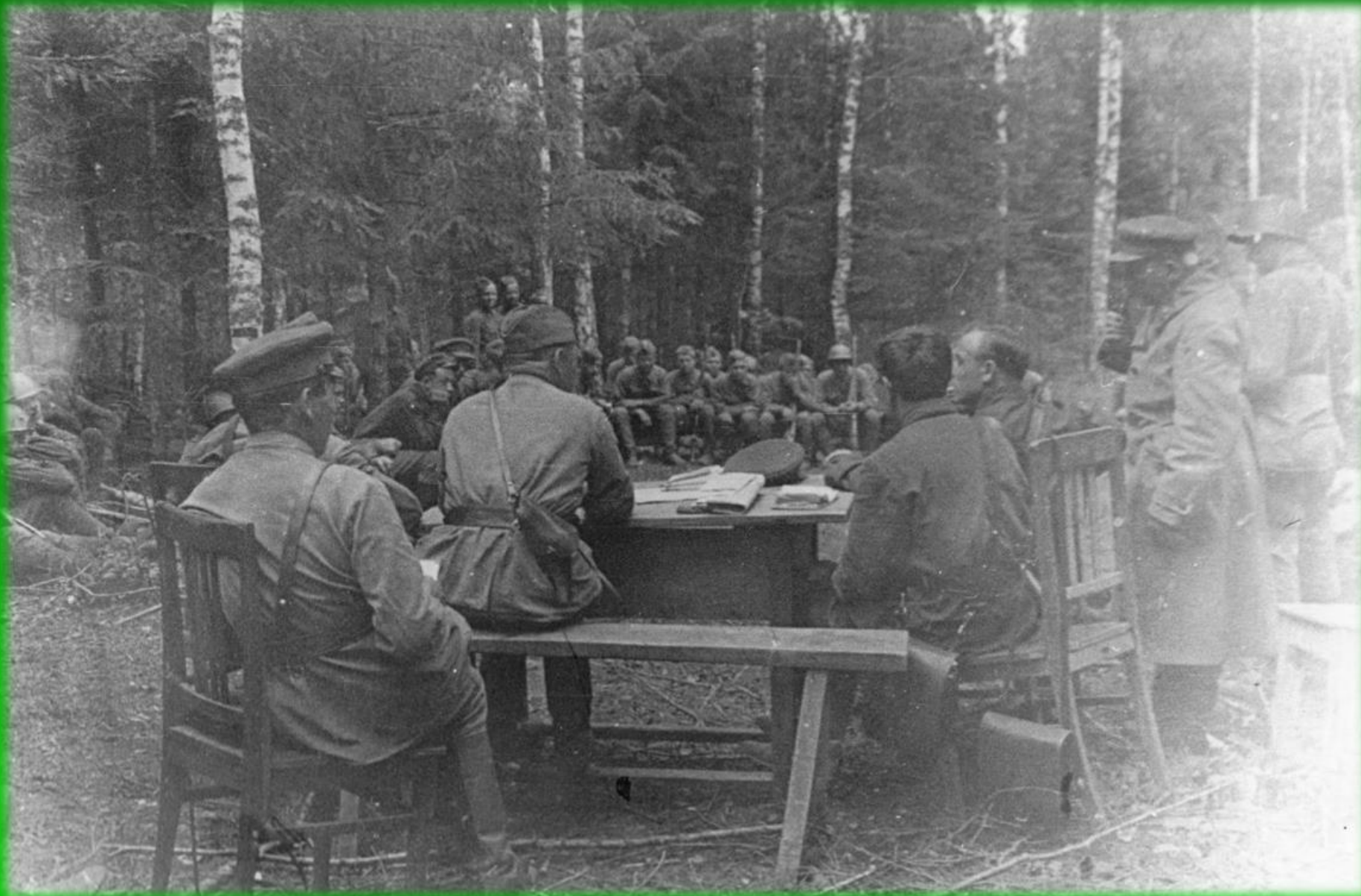
СОВЕЩАНИЕ В 1099 СП 326 СД ПО ОБМЕНУ ОПЫТОМ СНАЙПЕРСКОЙ СТРЕЛЬБЫ. 1942 г.