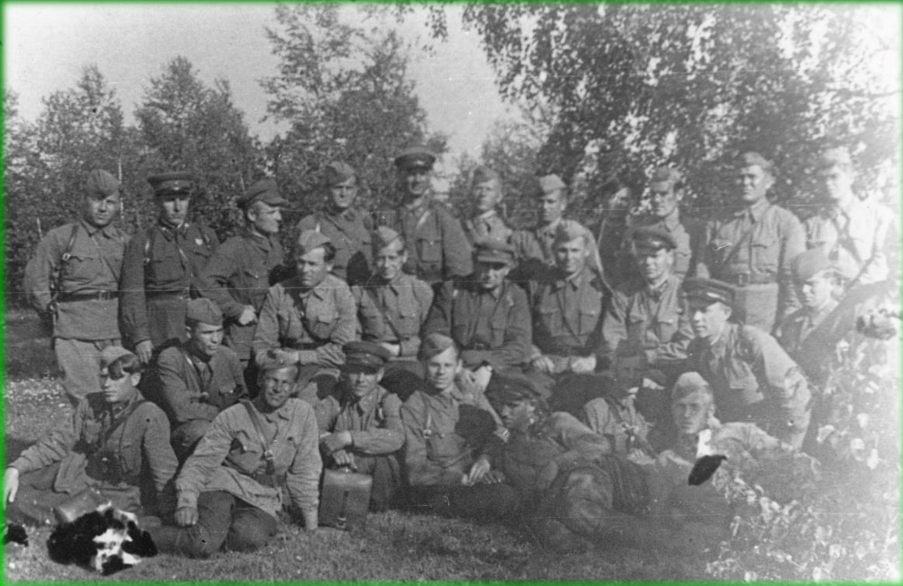
СОВЕЩАНИЕ ПОЛИТСОСТАВА 326 СД. РАЙОН р. ЖИЗДРА. 17 августа 1942 г.