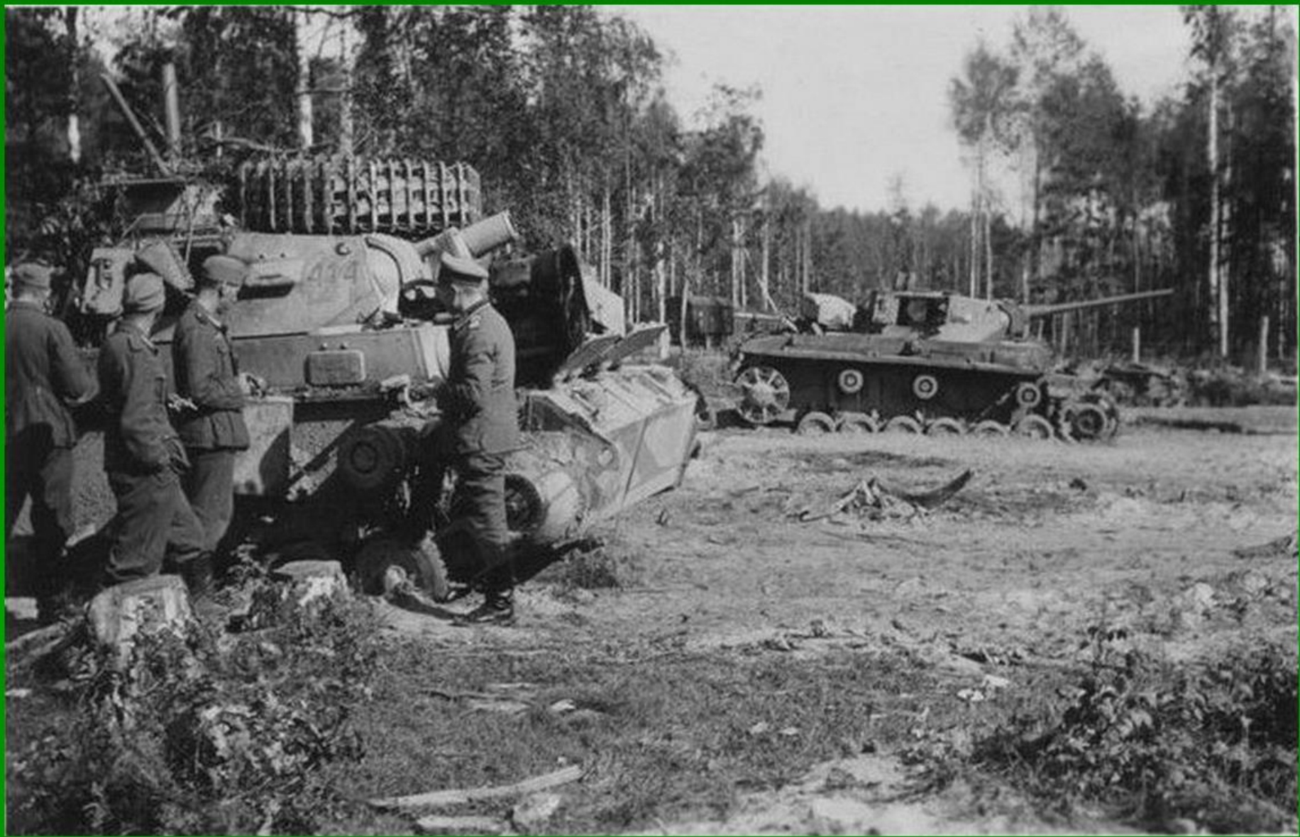
Подбитые танки немецкой 9-й танковой дивизии, которые в августе 1942 года воевали против 326-й стрелковой дивизии