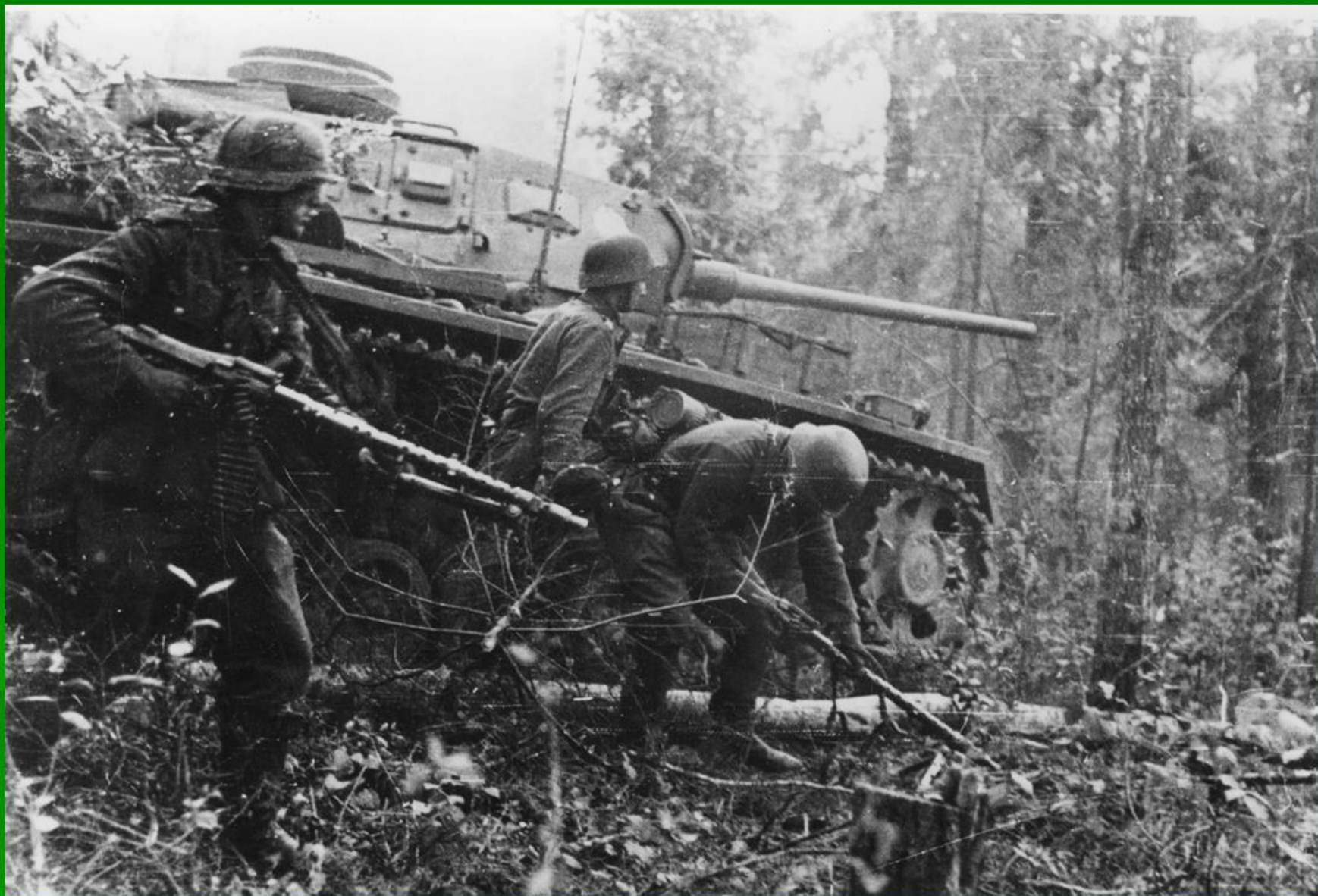
Атака немецкой мотопехоты и танков 23 августа 1942 года против участка обороны 1097 сп 326 сд.