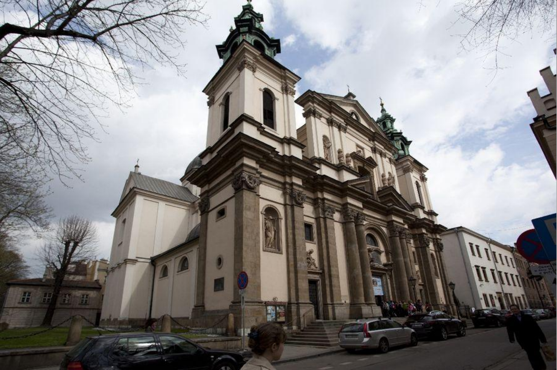
Św. Anna w Krakowie, Tylman van Gameren, od 1695