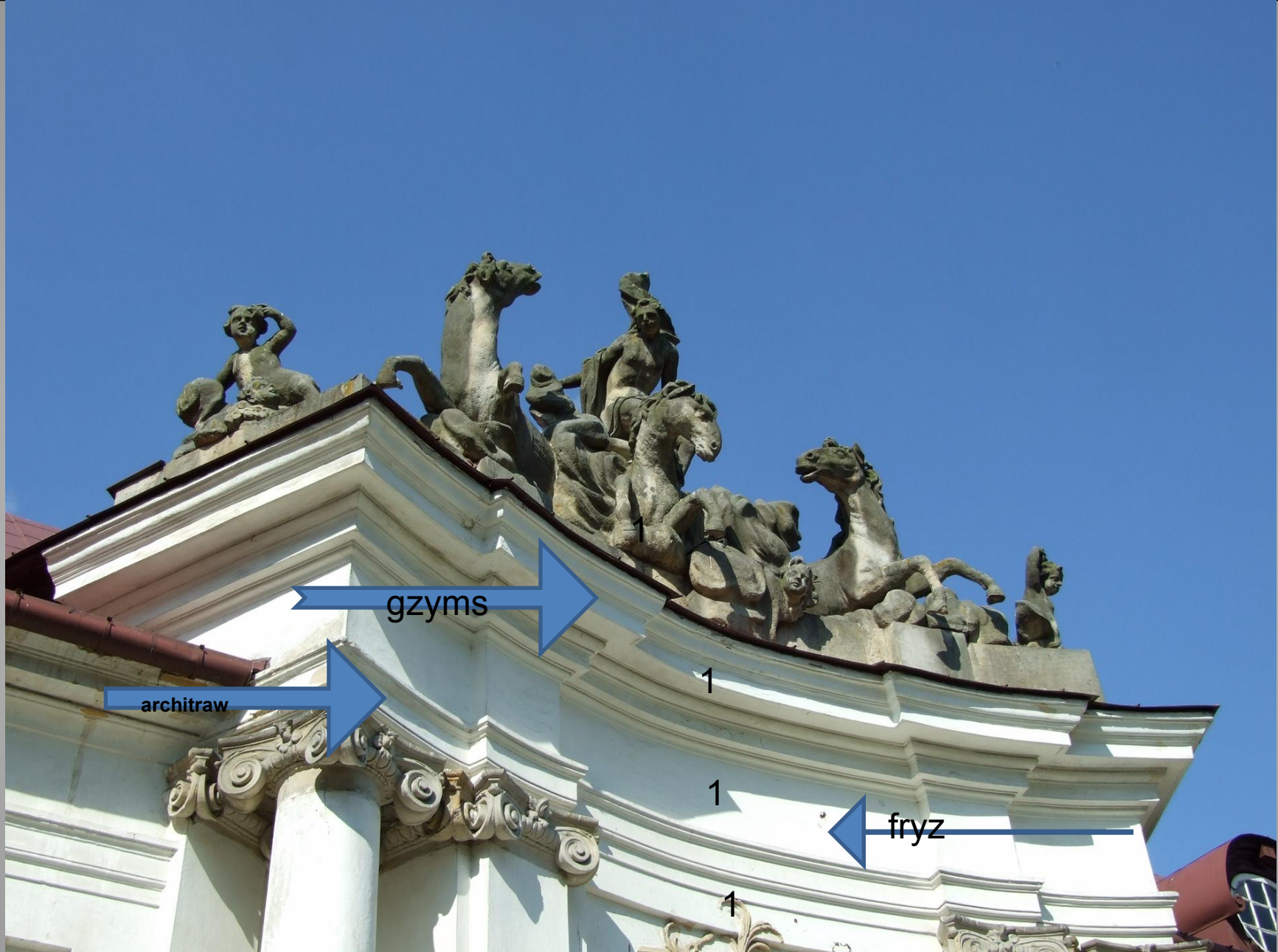
Bogate gzymsy światłocieniowe, dynamiczna rzeźba z motywami alegorycznymi (symbolicznymi). Sięganie do form antyku. 1-1-1 = elementy belkowania