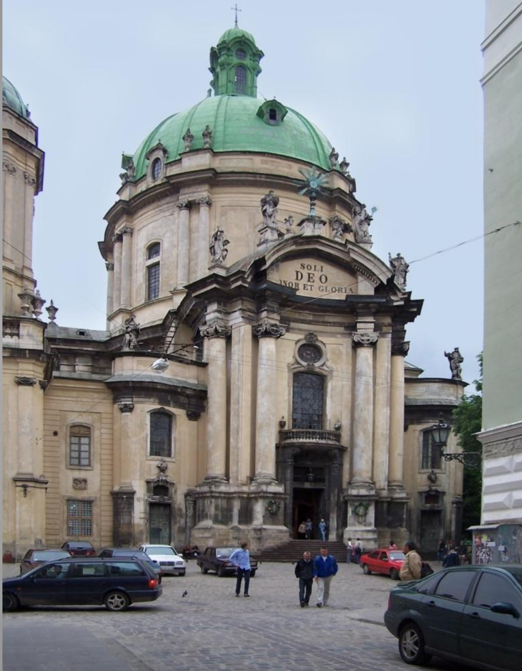
Kościół dominikanów we Lwowie, 1744, Jan de Witte

https://www.youtube.com/watch?v=1ZV7T6x8-Qk