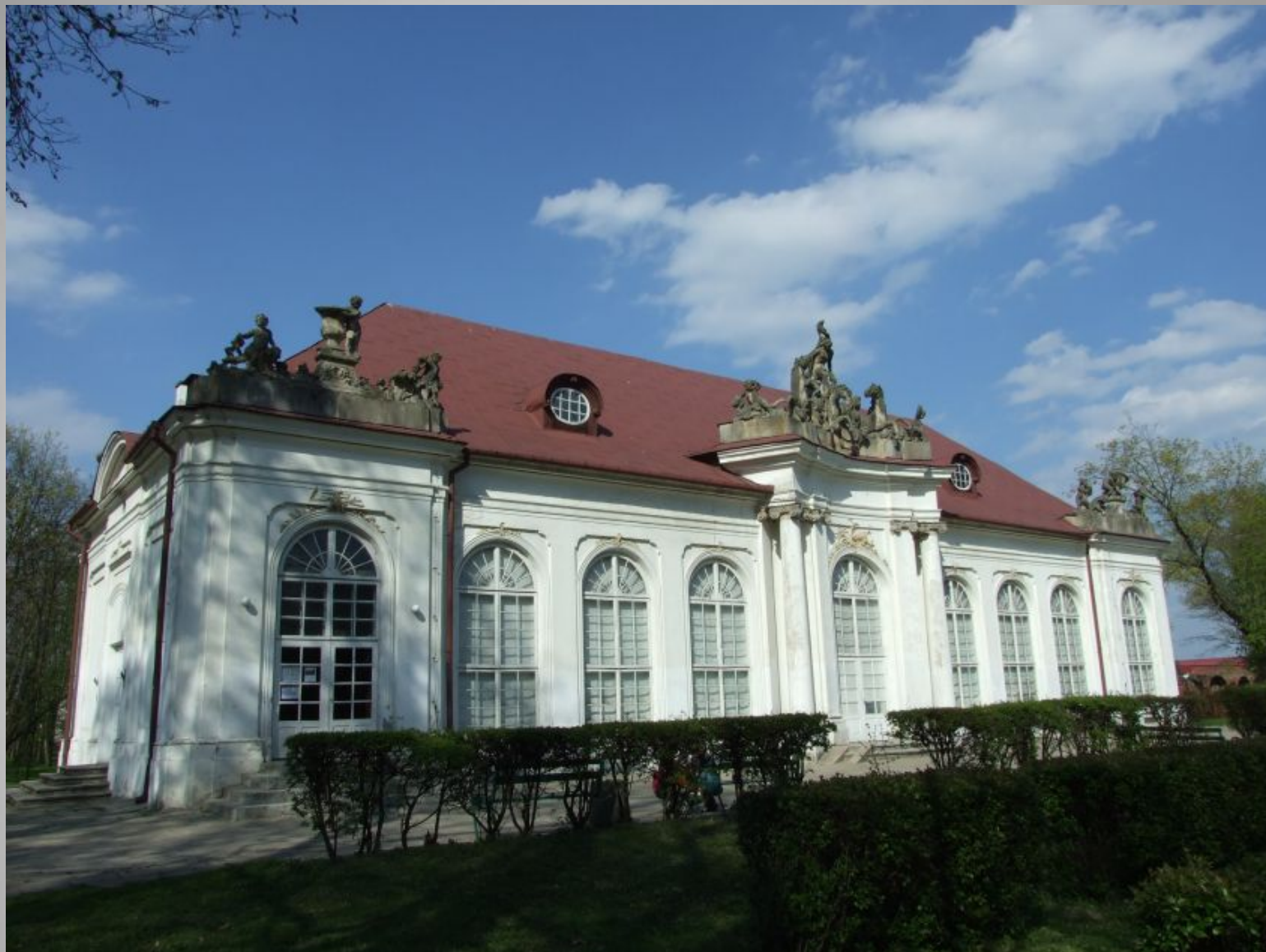
Radzyń Podlaski, oranżeria barokowa, arch. Jakub Fontana